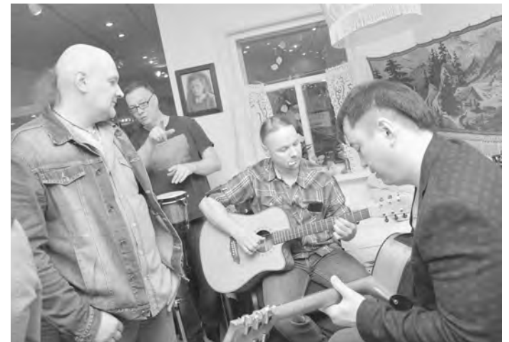
«Рыба пила» и «Т.Э.Т.» во время «Ночи музеев» смогли выступить сразу на двух площадках - в Новоуральске и Екатеринбурге

Засиделись мы с коллегами гораздо позднее полуночи,