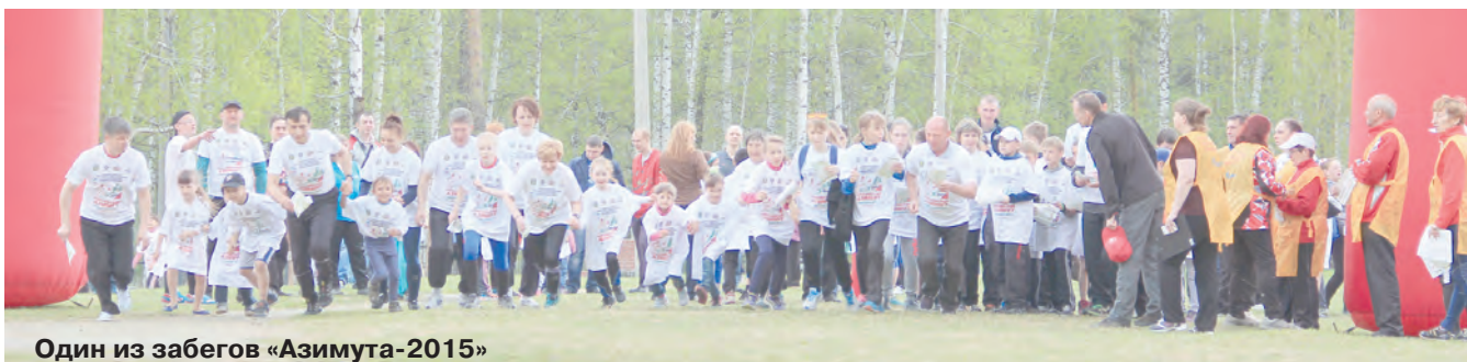
Один из забегов «Азимута-2015»

Главным событием минувшей недели стали массовые старты любителей бега с компасом и картой.