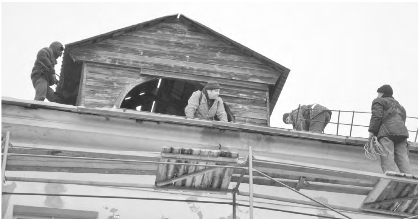
Больше всего вопросов у людей вызывает тема капремонта

Обучение по вопросам реализации актуальных проектов в сфере ЖКХ прошли более полутора тысяч свердловчан