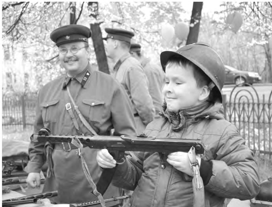
В «Ночь музеев» в Новоуральске кто-то в первый раз подержал в руках автомат, а кто-то - покатался на детской машинке времен СССР

Ещё одной темой акции в Новоуральске стало 70-летие Победы. На экспозиции «Помним о павших во славу живых» были представлены документы новоуральцев-участников Великой Отечественной войны и тружеников тыла, фотографии и личные вещи фронтовиков. В этом же зале студенты междоколледжа организовали своеобразный мастер-класс, показывая, как правильно перевязывать ра-