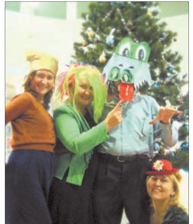
Детская художественная школа встречает Новый 2008 год. «Шляпная вечеринка» в разгаре!