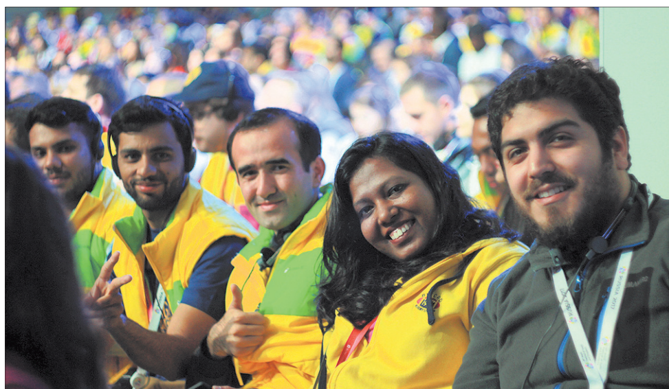
Лучезарные улыбки участников стали главной изюминкой Всемирного фестиваля.