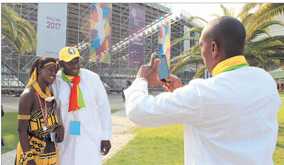
В день Африки по олимпийскому парку гуляли туземки и со всеми фотографировались.