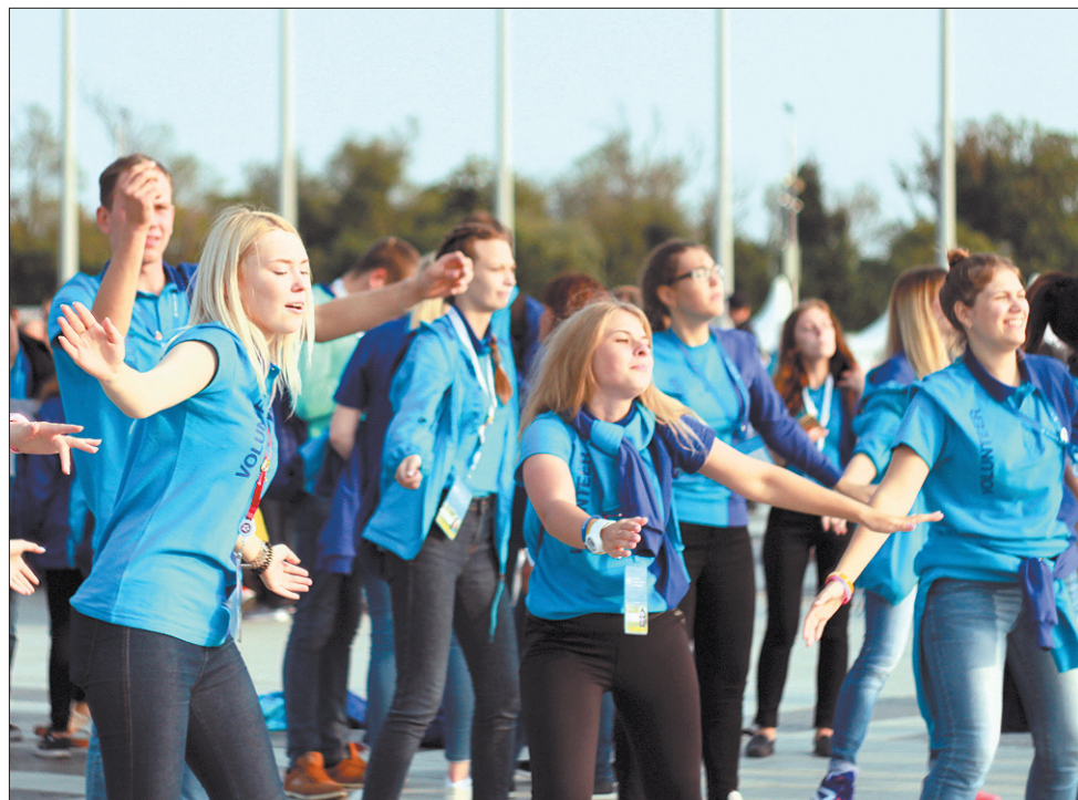
...а волонтеры задавали им ритм.