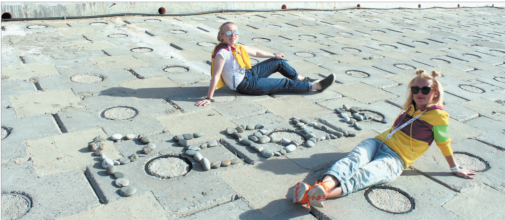
Мы построили на берегу Черного моря свою маленькую Ревду.