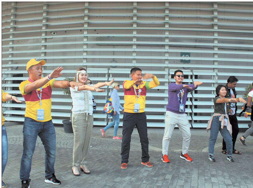
Чтобы не скучать в очередях на обед, участники зажигательно танцевали...

Еще больше фото и видео ищите на портале Ревда-инфо.ру