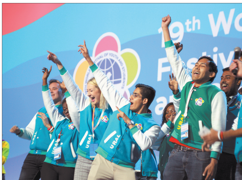
Иностранцы, приехавшие в гости к свердловчанам в рамках региональной программы фестиваля, рассказали, что «в Екатеринбурге им понравилась даже погода»