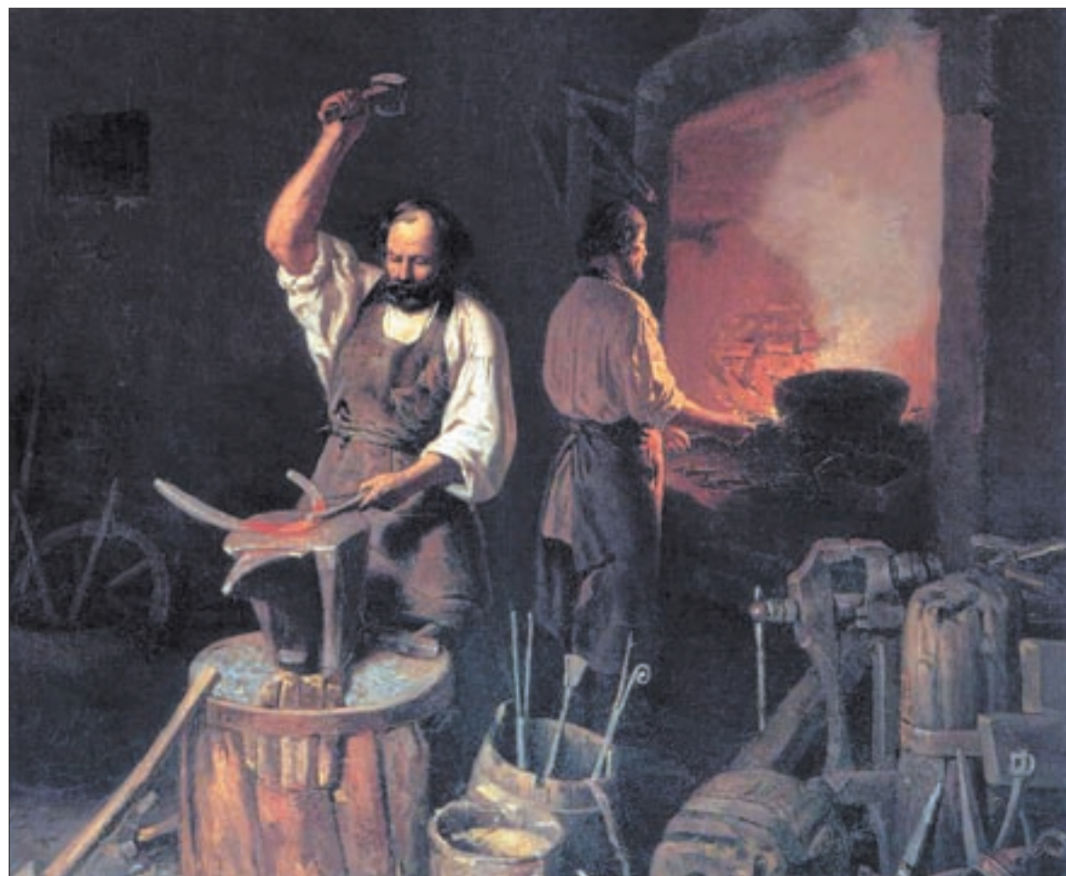
Кузнечный мастер и подмастерье

Кстати, в наши дни Слопинец известен благодаря находящемуся неподалеку природному феномену. В небольшом овраге близ деревни из-под земли вырываются несколько нерукотворных «фонтанов». Зимой они замерзают, образуя причудливые пятиметровые ледяные «статуи» необыкновенной красоты.