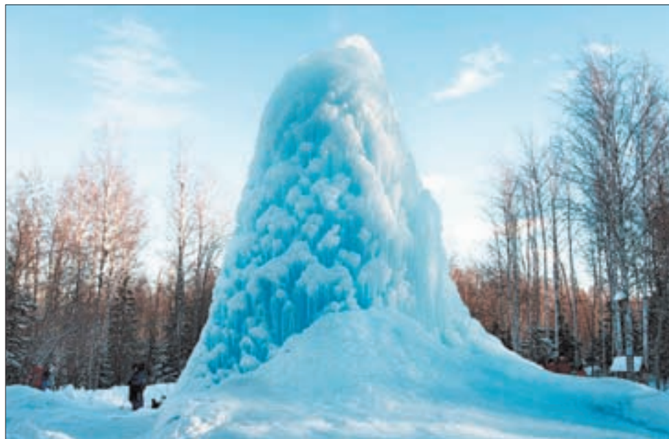
Ледяной фонтан у деревни Слопинец