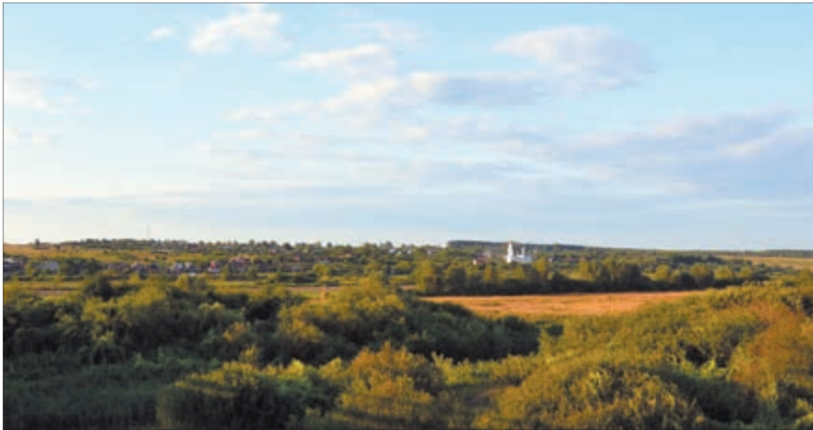
Панорама села Варганы

Продолжаем рассказывать об имениях заводладельцев Демидовых, из которых на Урал были переселены сотни крестьянских семей для работы на строящихся предприятиях. Наша новая история посвящена находившимся относительно недалеко от Нижнего Новгорода Варганской, Юркинской и Высоковской вотчинам, из которых более 60 семей были переведены на Ревдинский завод.