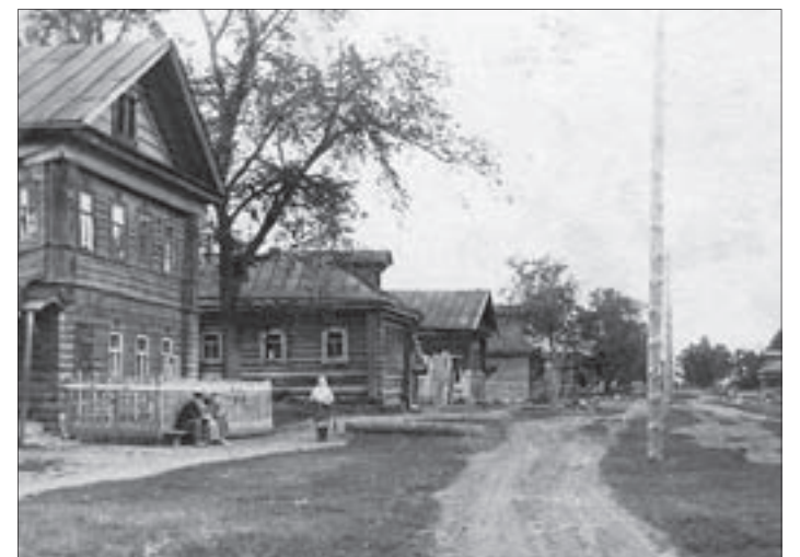
Юркино в прошлом