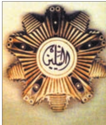
Знак «Голубого Нила»