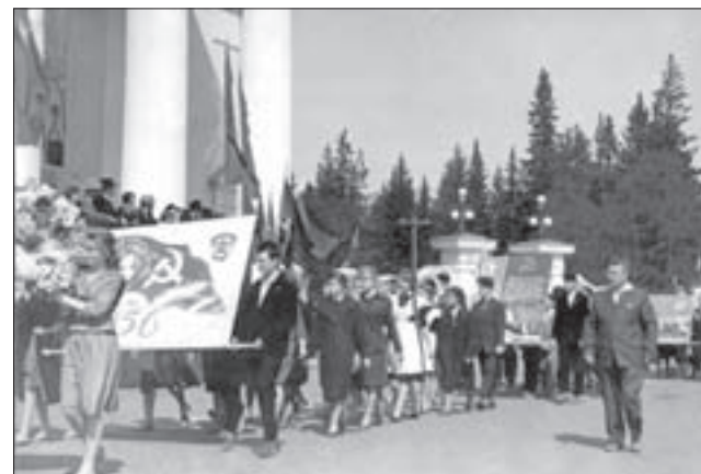
Демонстрация у Дворца в 50-х годах прошлого века.