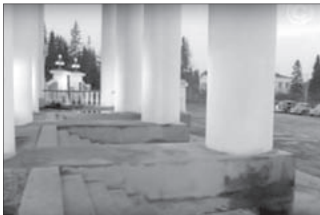
Кадр из фильма «Одна строка»

Уважаемые читатели, может быть, вы слышали, были свидетелями или сами участвовали в съёмках ленты «Одна строка»? Поделитесь с нами воспоминаниями! Звоните: 3-46-29.