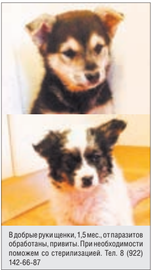
В добрые руки щенки, 1,5 мес., от паразитов обработаны, привиты. При необходимости поможем со стерилизацией. Тел. 8 (922) 142-66-87