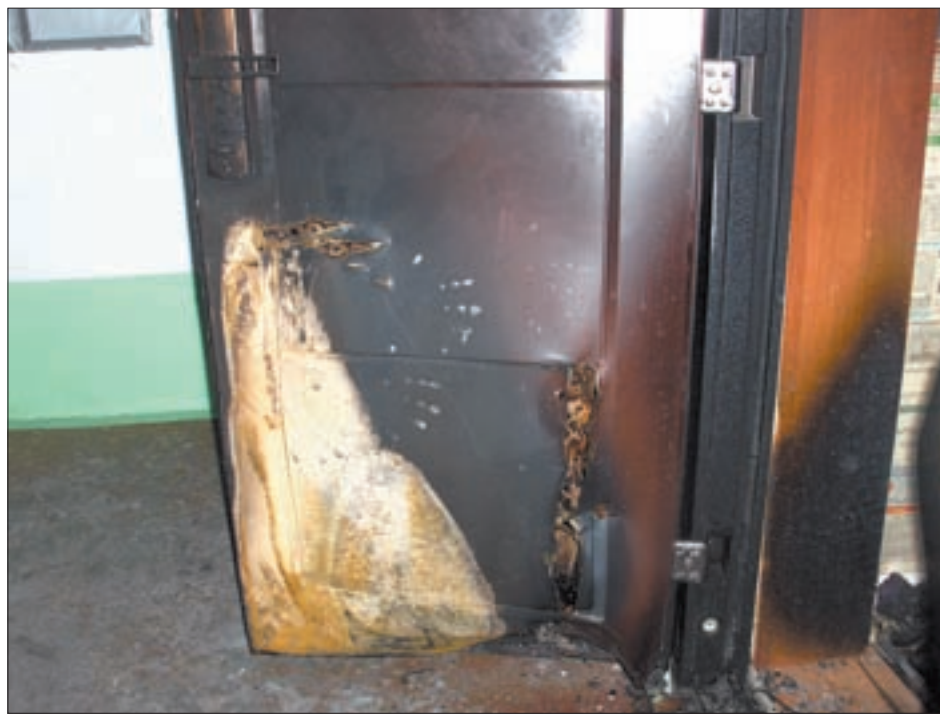
Пожарные дознаватели считают, что пол в коридоре загорелся от непотушенного окурка. Хорошо еще, хозяин, проводив гостей, не улегся спать и быстро заметил загорание.

При осмотре квартиры пожарные обнаружили, что газовый шланг в кухне оторван — как потом пояснил хозяин, он хотел отключить газовую колонку, но перестарался и запаниковал (кстати, стоя на балконе, он кричал, чтобы вызвали газовиков). Слава богу, что окно было открыто и времени прошло немного, газ не успел заполнить помещение.