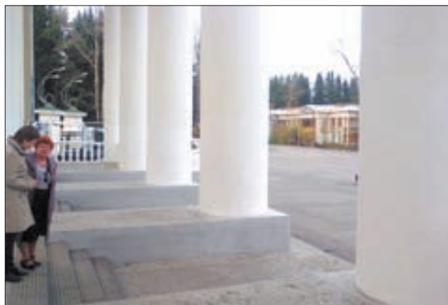
Дворец культуры в наши дни