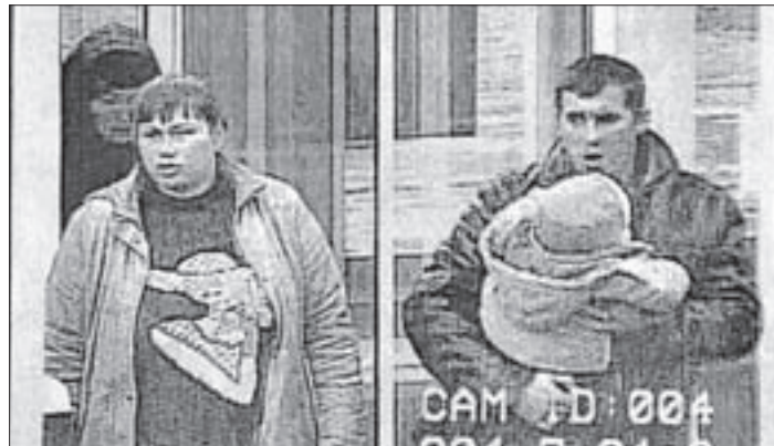
Разыскиваются магазинные воришки. Если вам известны эти люди и вы хотите их изобличить, звоните в полицию: 02, 8 (34397) 5-15-68 (дежурная часть).