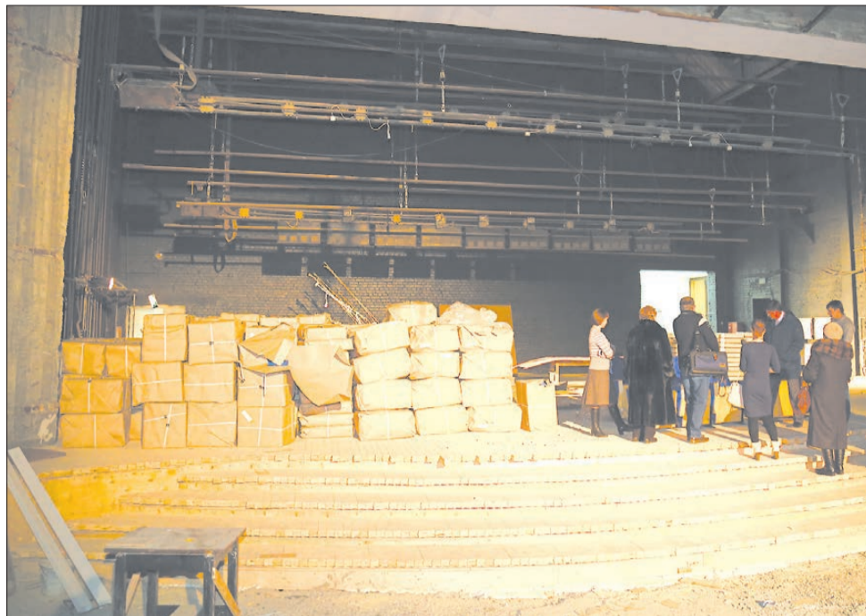
Ремонт еще не окончен, но уже сейчас видно, что зал ДК полностью изменил свой облик. Подиум, предназначенный для проведения конкурсов «Мисс Берёзовский», остался в прошлом.