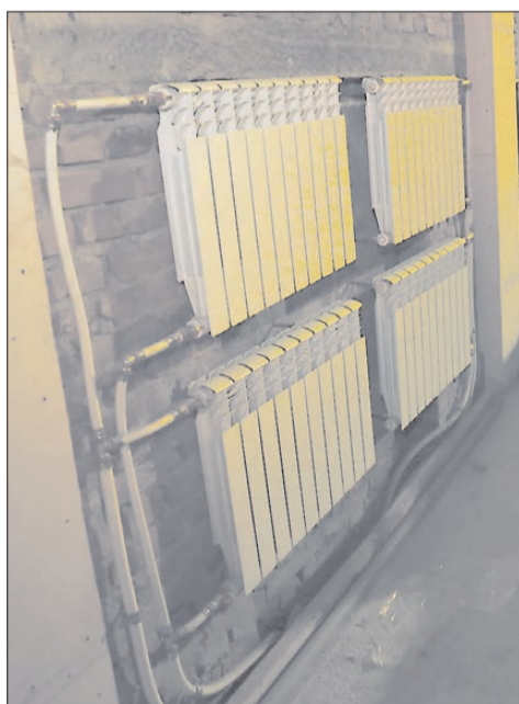
Радиаторы в два ряда установлены по внешней стороне зала. Регуляторы позволяют менять температуру – по всему периметру она будет равномерной.