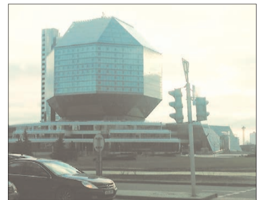
Здание Национальной библиотеки Беларуси — одна из визитных карточек столицы и республики

ских перевозках по Европе, — тут и спинка кресла опускается, и розетка под сидением у каждого пассажира, и кофейный автомат есть, и туалетная кабинка. Впрочем, прихотливым путешественникам всё же лучше выбирать поезд или автомобиль.