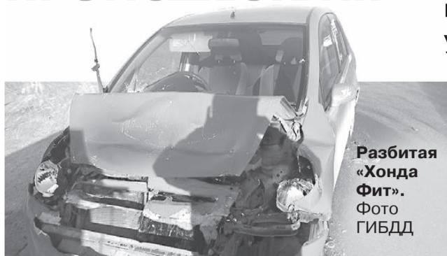
Разбитая «Хонда Фит».