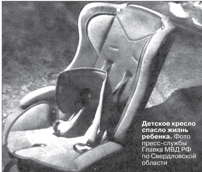
Детское кресло спасло жизнь ребенка.

После первого удара «десятку» отбросило на «Фольксваген Туарег», а затем на металлическое ограждение трассы. От столкновения с «Ауди» находившиеся в ВАЗе мужчины — 25-летний и 54-летний — скончались на месте. Двухлетний малыш лишился в аварии отца и деда. За жизнь маленького пассажира боролись врачи детской больницы № 9 Екатеринбурга. Стражи порядка отмеча-