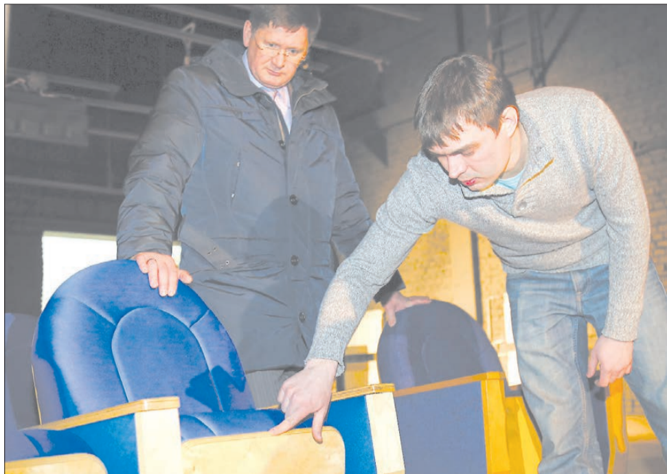
Дизайн кресла претерпел немало изменений – формы стали более округлыми, изменилась высота спинки соответственно перепадам высот ступеней амфитеатра зала.