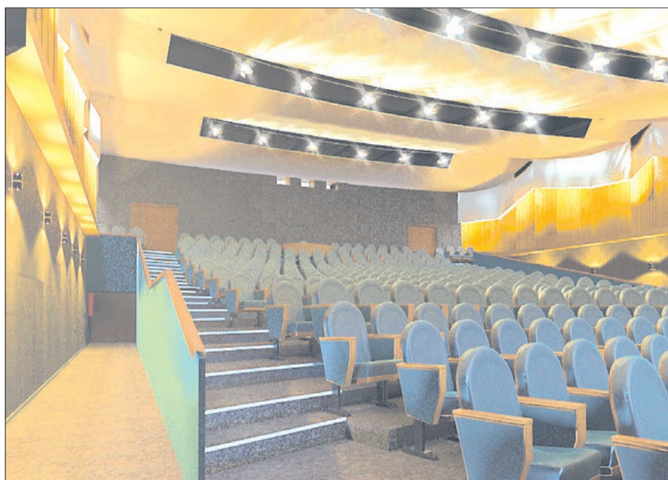
В дизайн-проект периодически вносятся дополнения и правки. Например, ограждения из фанеры заменены на хромированные со стеклом. Разработка архитектурной мастерской Sm-art