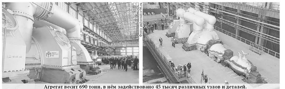
Агрегат весит 690 тонн, в нём задействовано 45 тысяч различных узлов и деталей.

730 тыс. уральцев пройдут диспансеризацию в 2017 году. На эти цели из системы ОМС направят 1,3 млрд. рублей. Программа может состоять из обязательных консультаций и анализов, а также – углублённых исследований для постановки точного диагноза.