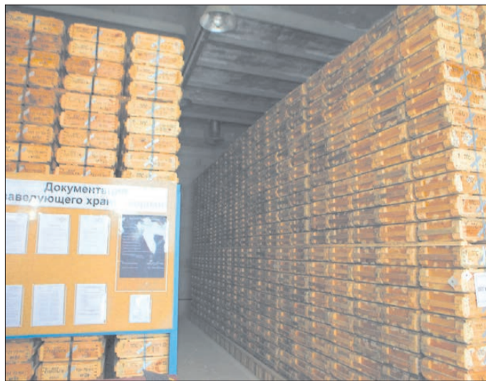
Один из перестроенных бетонных складов арсенала в Кедровке. 2013 год

ФГУП «Спецстройинжиниринг при Спецстрое России» получило крупный заказ от Министерства обороны России на строительство новых складов