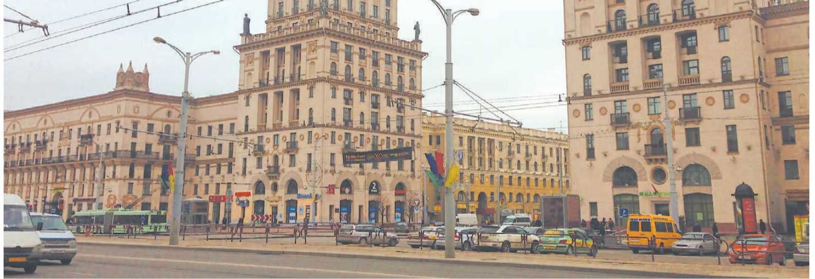
Минские ворота — одна из главных достопримечательностей столицы — выполнена в стиле Сталинского ампира, популярного в СССР в 1945-55-е годы. Ворота стоят напротив современного здания железнодорожного вокзала — такие сочетания достаточно часто встречаются в Республике Беларусь.

Картошка, позднее средневековые и ухоженность