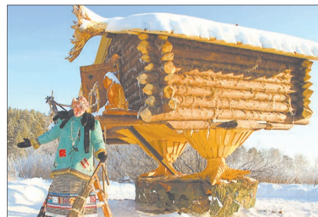
Избушка на куриных ножках – владения Бабы Яги.