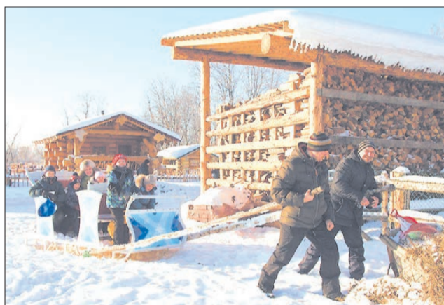
Парк сказов – первый на Урале тематический парк, посвящённый традиционной уральской народной культуре, сказам Бажова и русской сказке