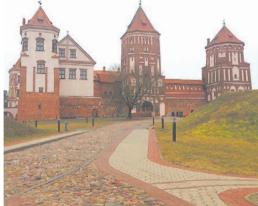
Современный вид Мирского замка в одноименном поселке совсем не намекает, что ему уже более пяти веков.