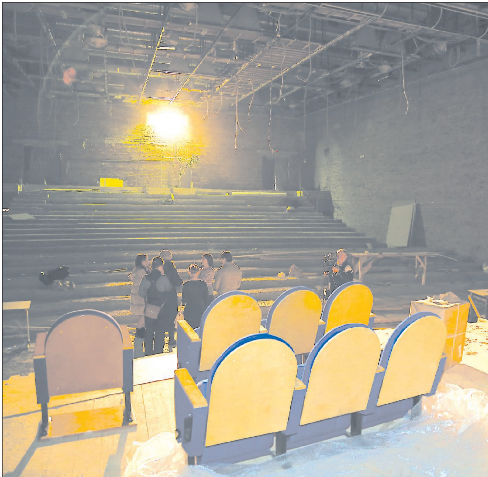
Для демонстрации собраны лишь шесть кресел, остальные хранятся в разобранном виде в коробках. Заказ выполнила крупная московская фирма «Кресла в зал».

Выбор ткани тоже имел большое значение: если взять за основу то, что предназначается для бытового использования, долго кресла в хорошем виде не протянут, необходима износостойкая. В сравнении с первым образцом, который изготовитель представил для «Современника», заметны существенные коррективы — вместо темно-синей обивки и желтой фанеры выбраны более светлые тона; подлокотники,