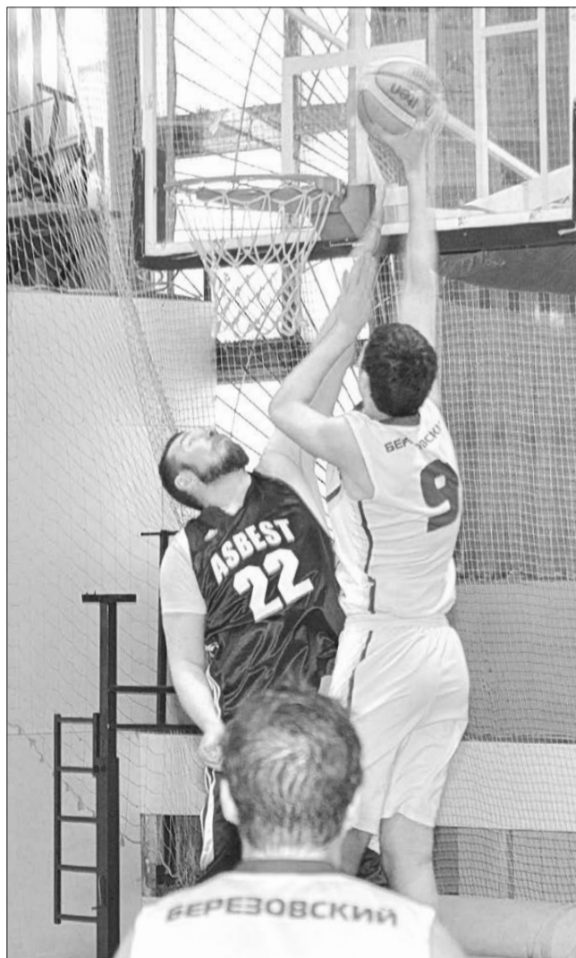
Матч УЭС-«Урал-Асбест».

Команда УЭС на следующий день провела еще один матч против студентов Уральского государственного университета путей сообщения и снова выиграла – 93:80.