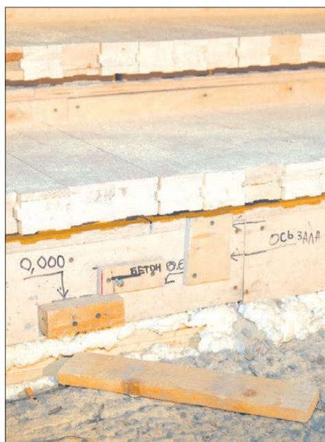
На сцене «Современника» застелен и выстаивается брус. В дальнейшем он будет оформлен по языку сцены и обработан защитным покрытием.