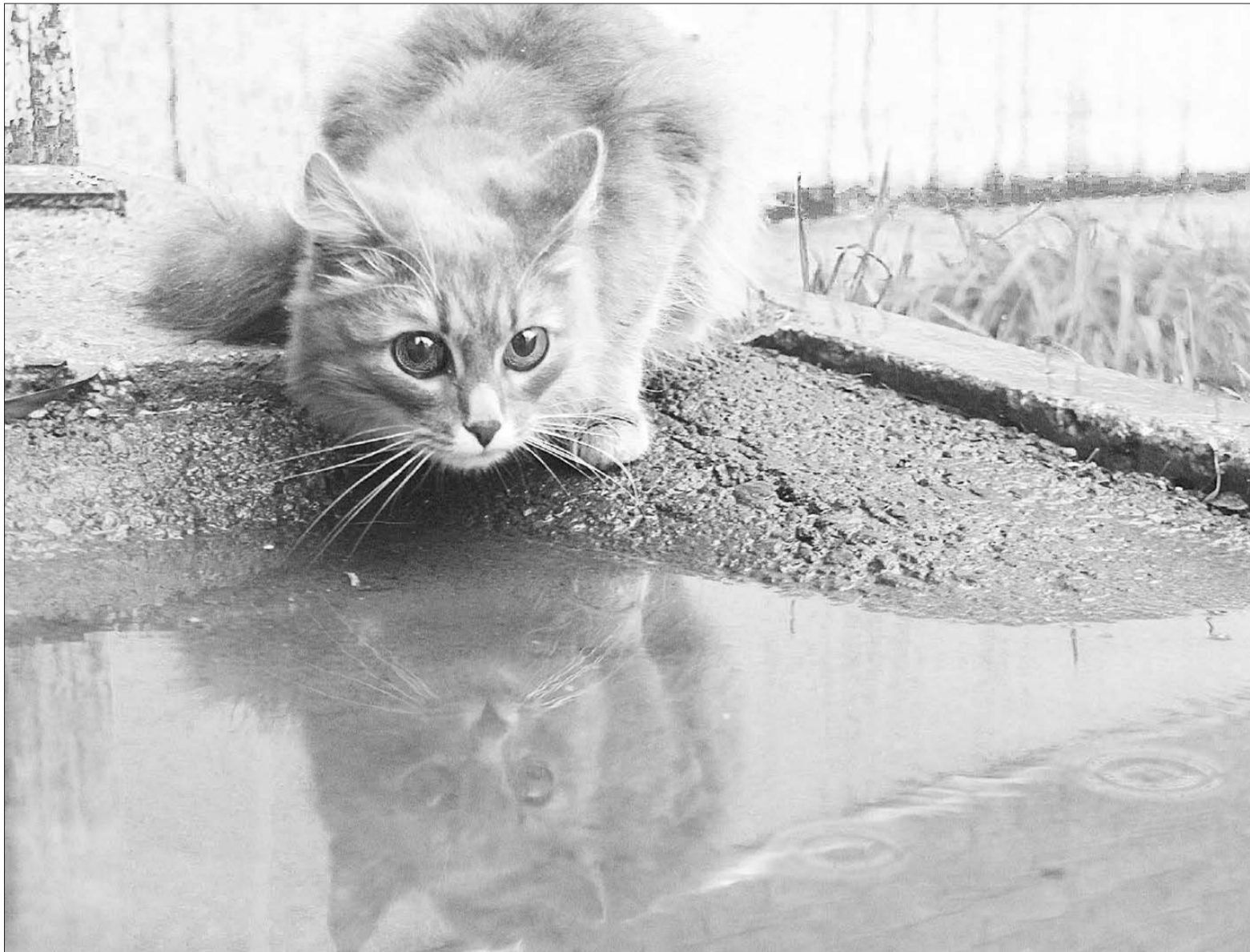
Общественники добиваются, чтобы безнадзорных животных на улицах не стало.

Необходимо донести до владельцев кошек, собак и прочей живности, проживающей в домах и квартирах, их права и обязанности. Леонид Савин назвал конкретные суммы, которые могут существенно изменить ситуацию в лучшую сторону. Так, сканер для чипования животных стоит около 13 тыс. руб., сами чипы — около 450 руб. Если перейти на обязательное чипование собак и кошек, то проблема с «неопознанными» животными решится сама собой. Будет понятно, по чьей вине животное оказалось на улице.