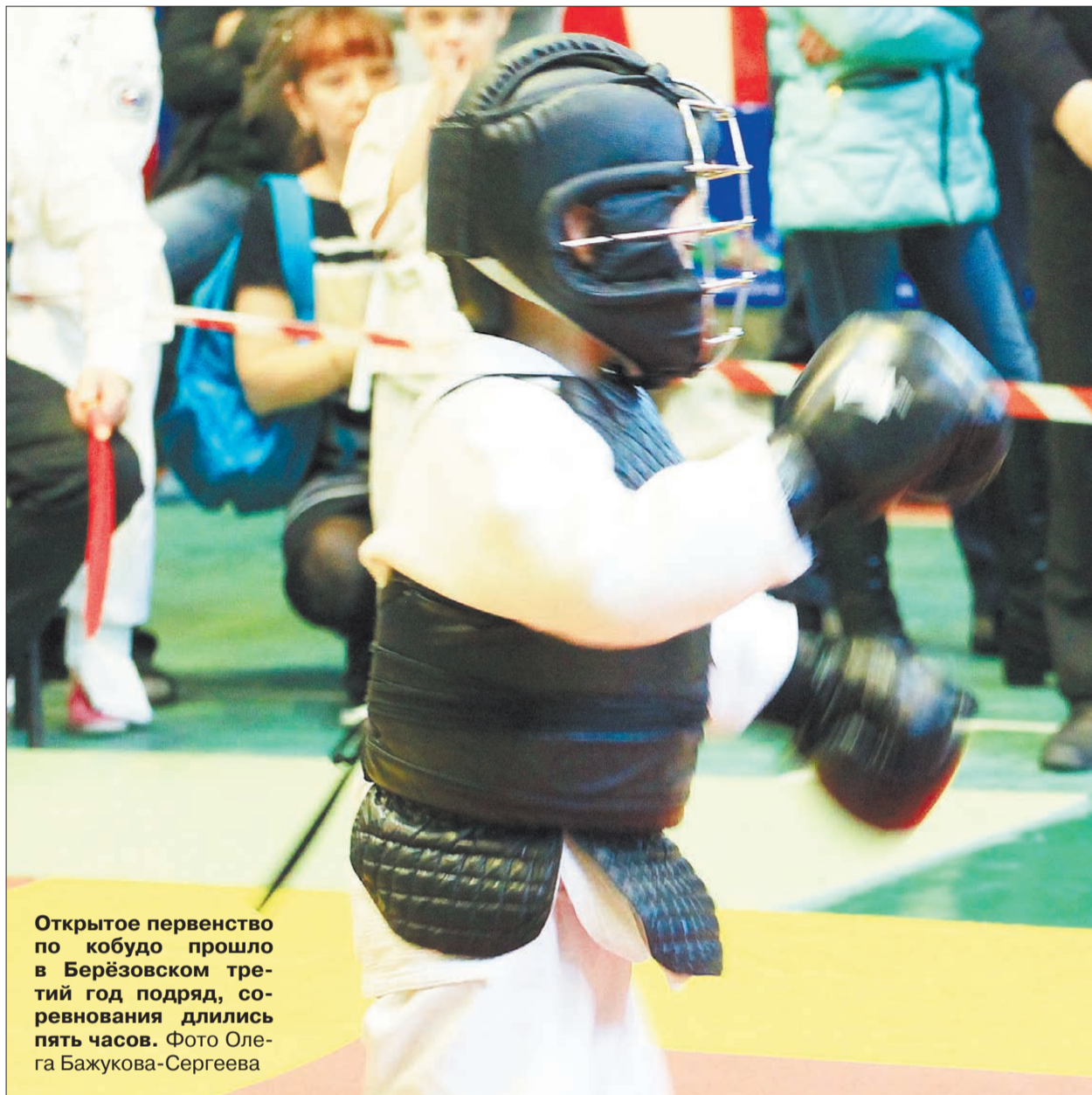
Открытое первенство по кобудо прошло в Берёзовском третий год подряд, соревнования длились пять часов.