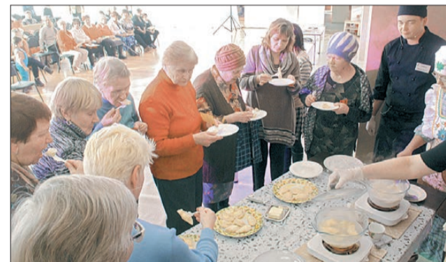
Когда вареники были готовы, место вокруг стола заняли зрители. Их судейство поделило голоса за каждую команду поровну