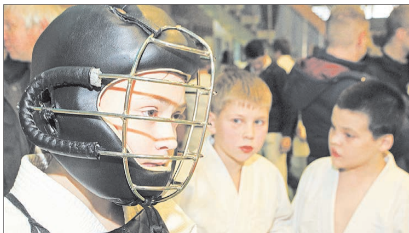
Чемпион России Фёдор Джулай сосредоточен перед боем.