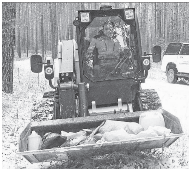
Общественники и спецтехника работали в лесу семь часов.