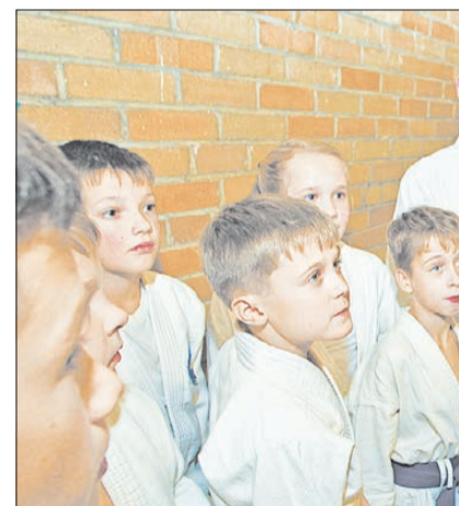
Тренер команды «Берёзовские бойцы» дает наставления своим подопечным