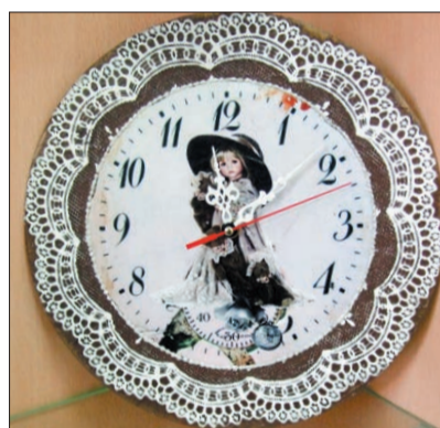
Декупажировать можно любое изделие. С помощью этой техники Нина Широкова, например, создала настенные часы.