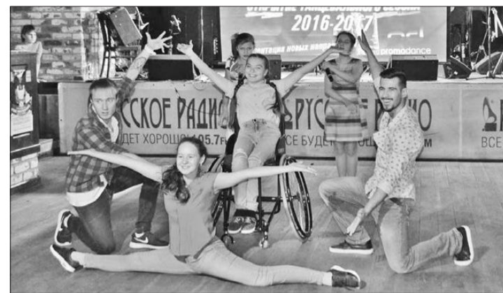
Концерт в «Максимилиансе» поддержали благотворительные организации «Линии добра Линлайн» и «Время добра»

Всего летом в «Зарнице» отдохнули 540 школьников — по 135 в каждой из четырех смен.