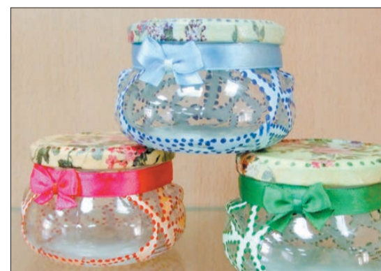
Нина Федоровских с помощью декупажа украсила баночки.