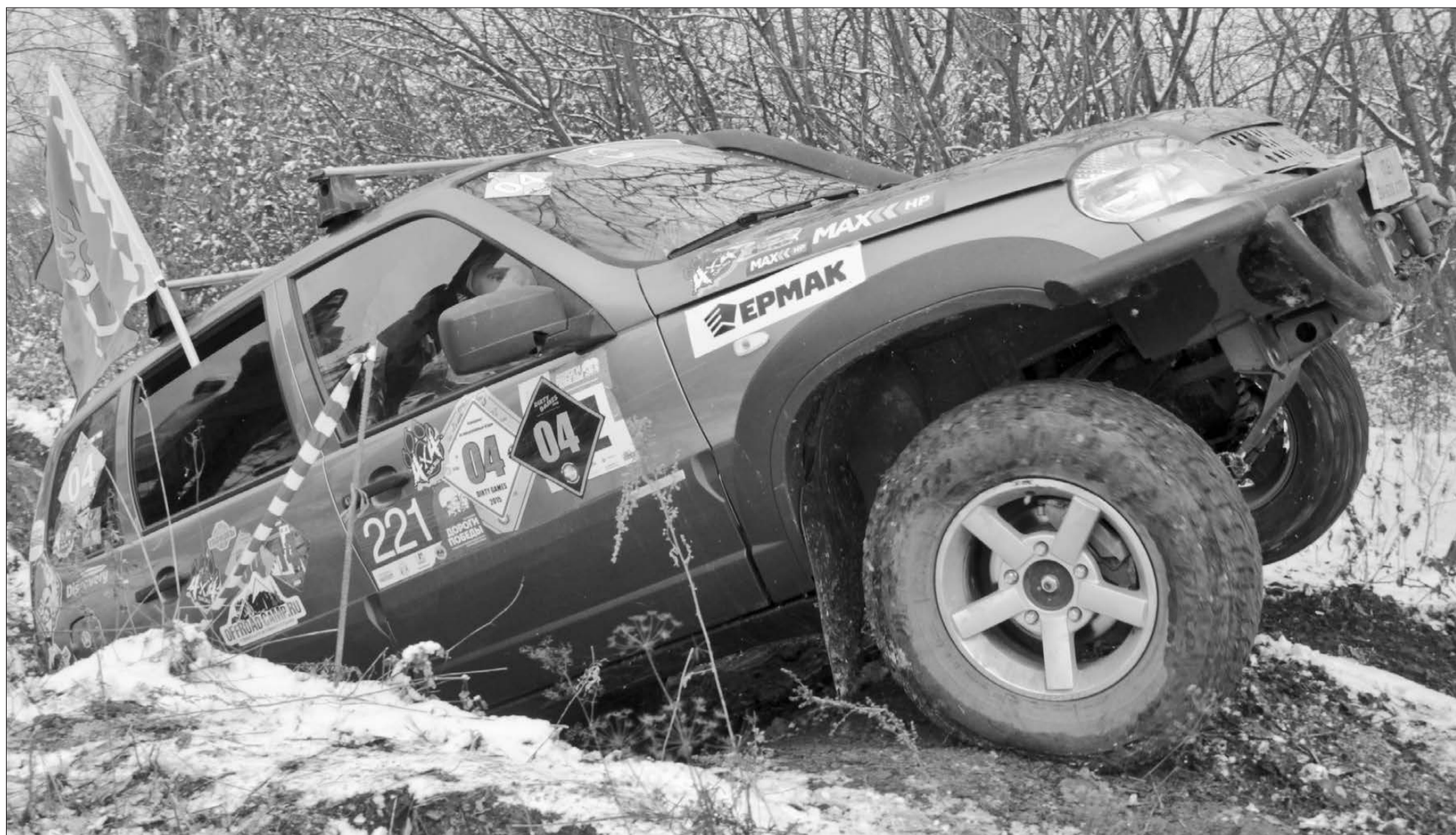
Прохождение трассы гоночным дуэтом из Берёзовского – единственным среди участников IV этапа.