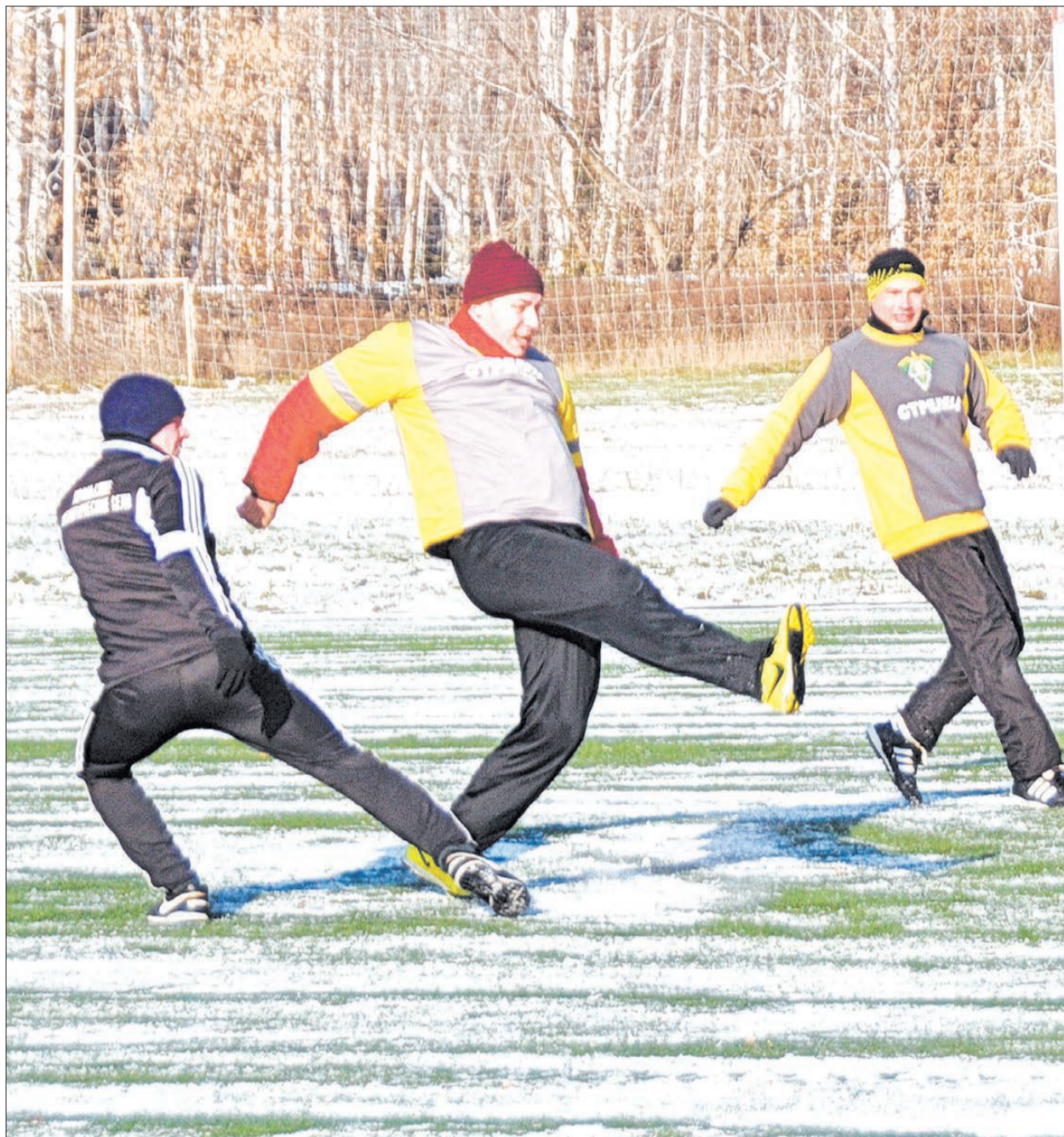
Голевой момент. Встреча команд «Стрелец» и УЭС завершилась со счетом 5:3.