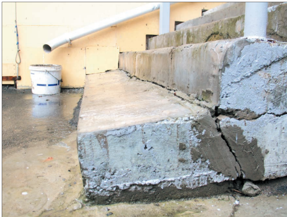
Треснутая ступенька подъезда дома № 2 по ул. Виктора Чечвия, по мнению чиновников, вполне справляется со своими функциями, несмотря на опасный уклон