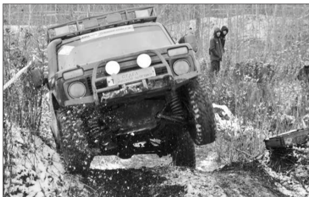
Чтобы преодолеть препятствия, автомобилям иногда приходилось отрываться от земли.