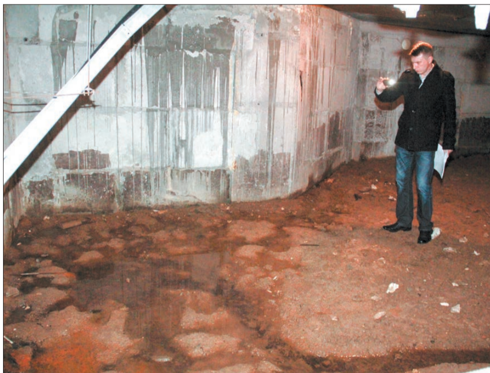
Бьющая из-под земли вода в подвале дома № 6 по ул. Виктора Чечвия. Для откачки воды установлен насос с поплавковой системой включения. Вода прибывает – насос начинает работать, за потребляемую электроэнергию платят жители.