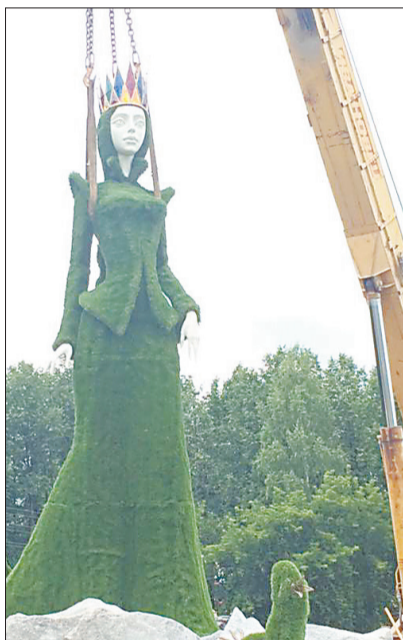
Из Санкт-Петербурга в Берёзовский Хозяйку привезла удлиненная «Газель». Выгружали фигуру вручную шесть человек. Установили Малахитницу за несколько часов с помощью кожаных рукавов и 25-тонного крана.