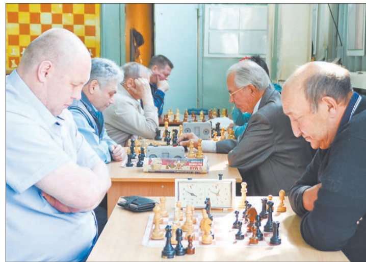
Городской турнир собрал рекордное количество участников.

Пляжники не без основания считают свою игру более сложной. Каждый игрок должен быть универсальным, без разделения по амплуа. В игре на песке спортсменам приходится чаще совершать прыжки и рывки, матчи зачастую проходят при ярком солнце или же в сильном ветре и дожде. К тому же на турнирах обычно одна команда проводит несколько игр в день. Где всё построено на обмане противника и где всё без обмана для зрителей.