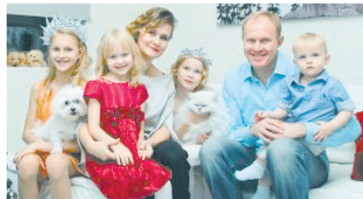
Сергей ЧЕПИКОВ двукратный олимпийский чемпион, депутат Законодательного Собрания Свердловской области