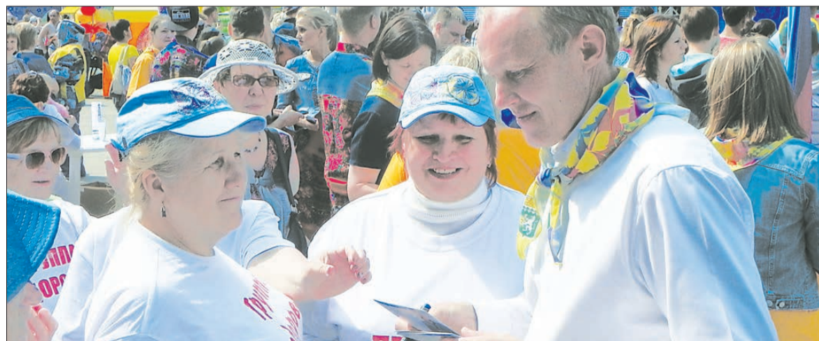
Сергей ЧЕПИКОВ, двукратный олимпийский чемпион, депутат Законодательного Собрания Свердловской области