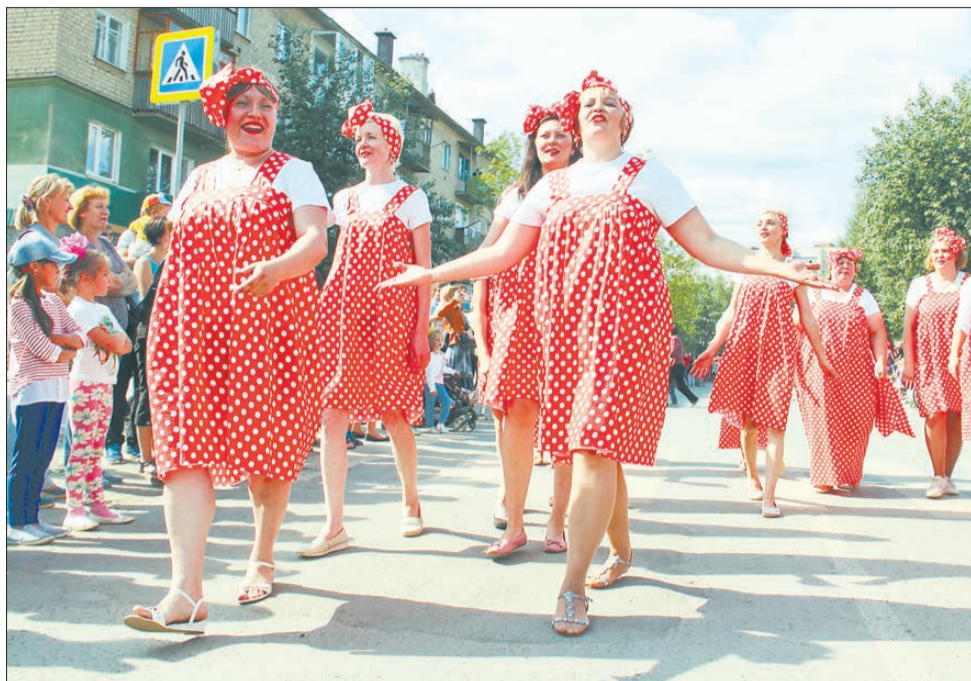
Команда детского сада № 22 решила оттолкнуться от выражений «красна девица» и «красна горница». Образы сельчан, празднующих окончание посева, принесли садикам победу. Шить сарафаны силами сотрудников начали за три дня до праздника.