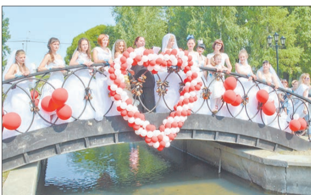
Дефиле всех «сбежавших невест».