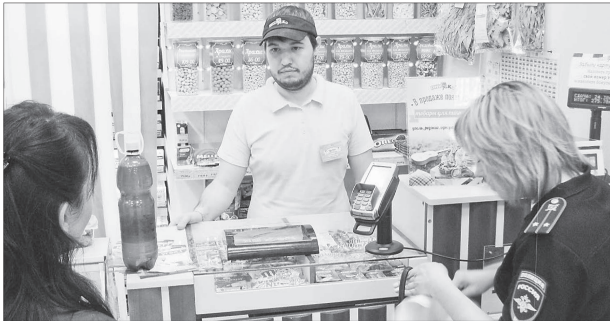
Вызванные общественниками сотрудники полиции берут объяснения у реализатора магазина «Пивко», расположенного по ул. Академика Королёва, 2а.

По результатам проверки прокуратуры руководитель и специалист центра по предоставлению услуг привлечены к дисциплинарной ответственности и административному штрафу в 1000 руб.