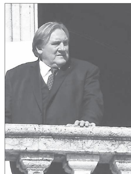
Жерар Депардьё на балконе мэрии Марселя.