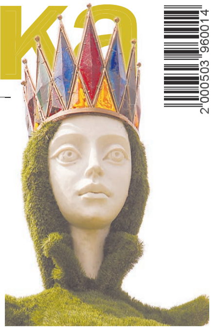
Голова и руки сказочной героини изготовлены из литьевого мрамора – теплое на ощупь