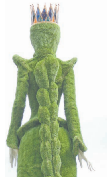
Коса Хозяйки медной горы.

смесь полиэфирной смолы с наполнителем и залили в форму до отверждения готового изделия.