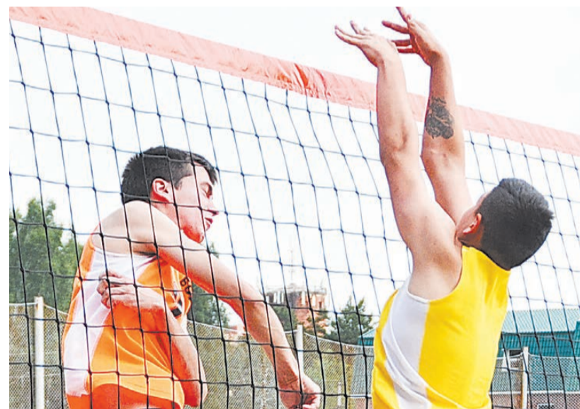
Бить – так добивать!