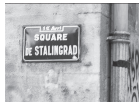
Нижнее фото: памятная доска в сквере Сталинград.