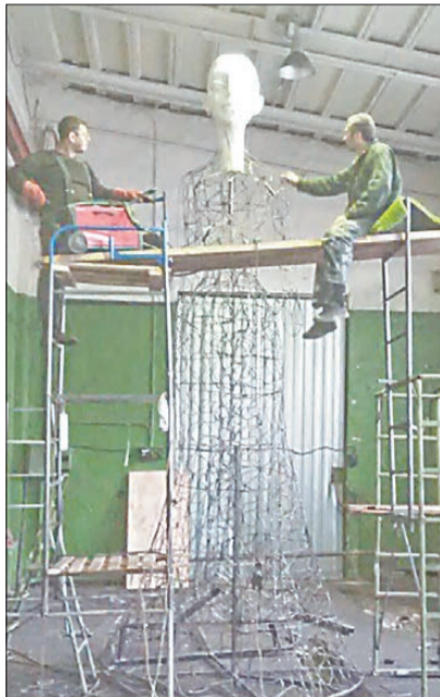
Изготовление скульптуры в цехе компании «ТопиАрт».