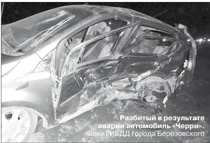
Разбитый в результате аварии автомобиль «Черри».

Тел. журналистов: (34369) 4-53-95, 8-904-982-33-11