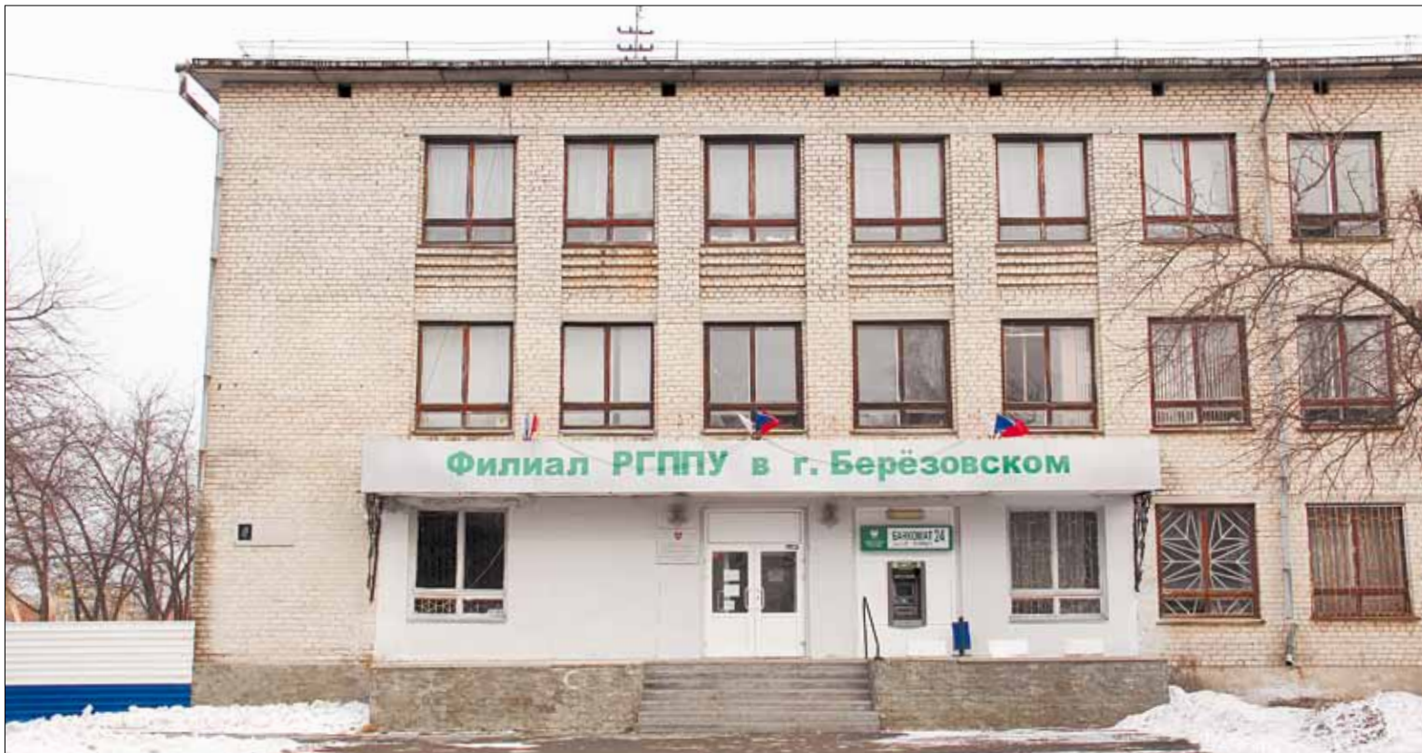
В ближайшем будущем здания филиала РГППУ в городе Берёзовском попадут в руки нового хозяина

Незавидную участь берёзовского филиала предопределил так называемый рейтинг эффективности вузов России, составленный в 2013 году. Чиновники федерального министерства образования и науки проверили каждый университет страны и составили список неэффективных учебных заведений. По мнению экспертов, получившие «неуд» учреждения работают спустя рукава и не справляются с задачами. В число отстающих попал единственный вуз нашего города.