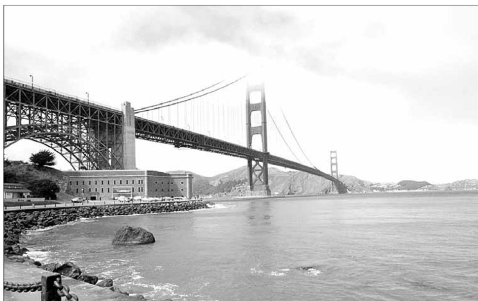
Одна из главных достопримечательностей Сан-Франциско – мост «Золотые ворота», до 1964 года был самым длинным мостом в мире. Сентябрь 2012 года.