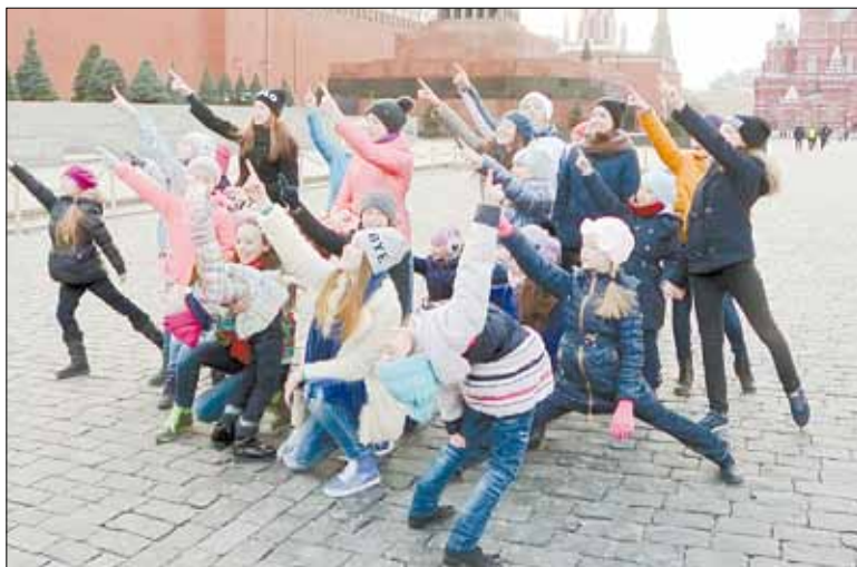
Березовчане во время прогулки по Красной площади

Совсем недавно мы поздравляли коллектив с высокими наградами. В том числе с гран-при фестиваля «Берега надежды». И