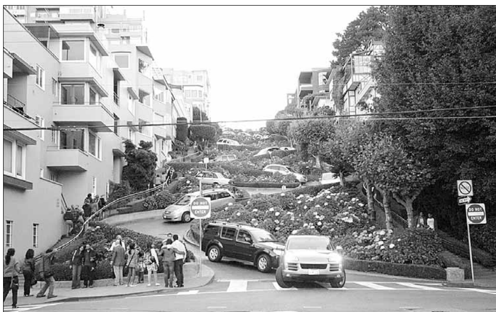
Самая известная из крутых улиц города – змееобразный конец Ломбард-стрит. Район, где находится этот отрезок, называется «русский холм», в честь когда-то находившегося тут кладбища русских колонистов. Сентябрь 2012 года.