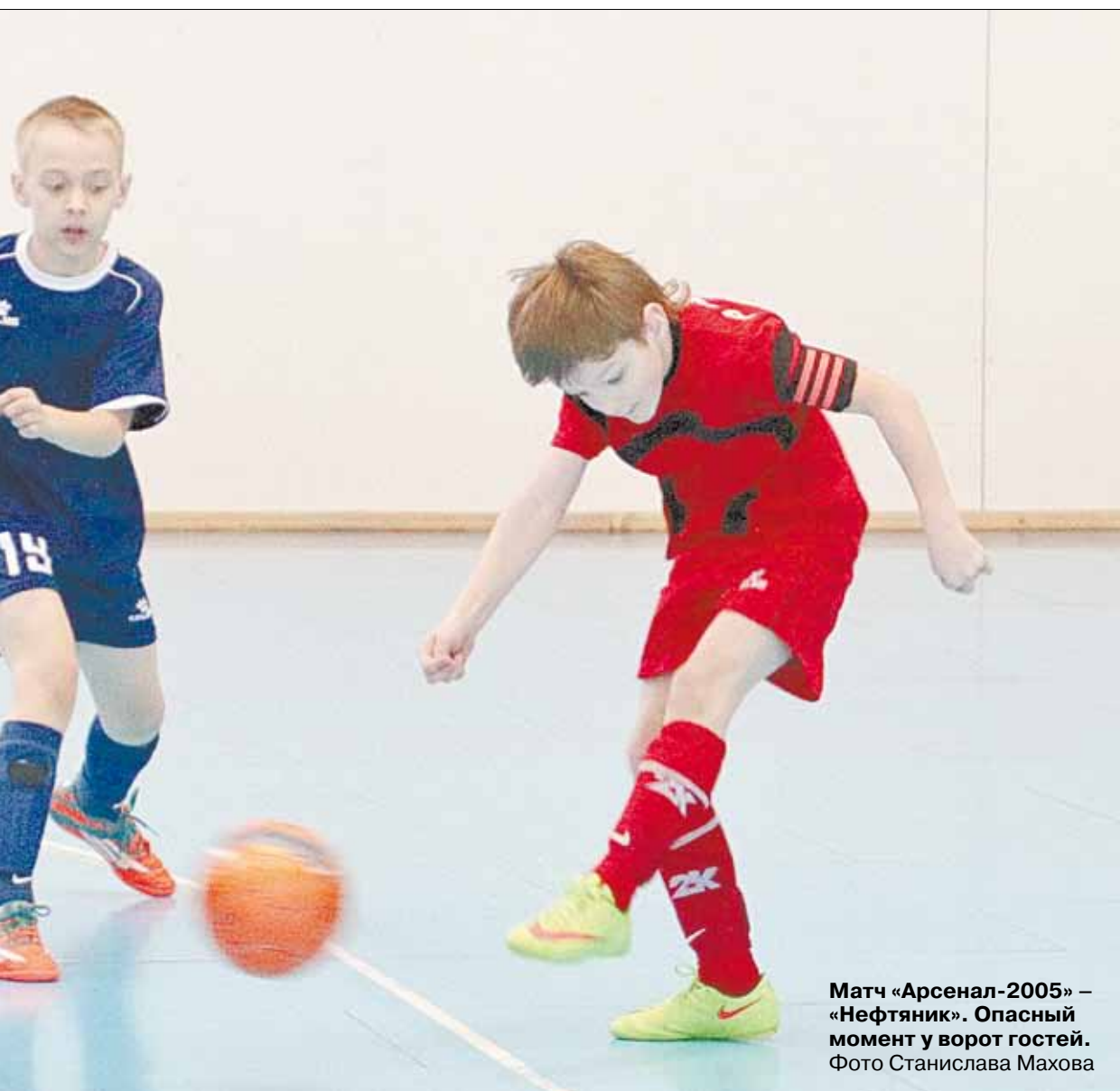
Матч «Арсенал-2005» – «Нефтяник». Опасный момент у ворот гостей.