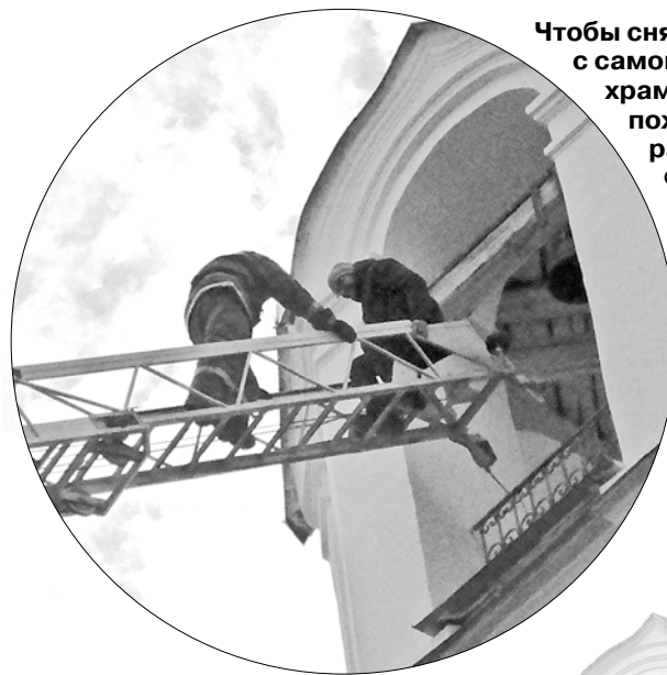
Чтобы снять человека с самой высокой точки храмового строения, пожарные пригнали и разложили автолестницу.

ском. 27-летняя рулевая автомобиля «Хонда Цивик» не увидела в зеркалах заднего вида 54-летнего пешехода. Не успев затормозить, автоледи причинила мужчине травмы. По факту происшествия проводится разбирательство.