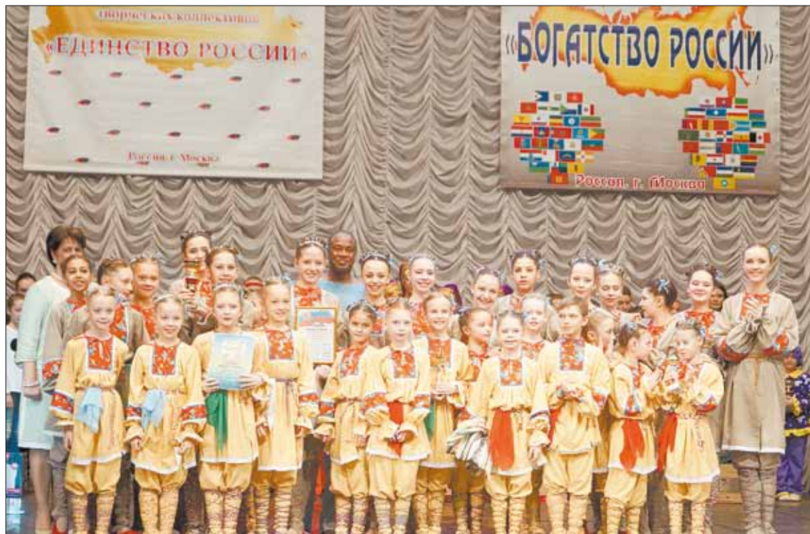
Фестиваль в Москве посетили 32 юных танцора образцового хореографического коллектива «Ассоль».