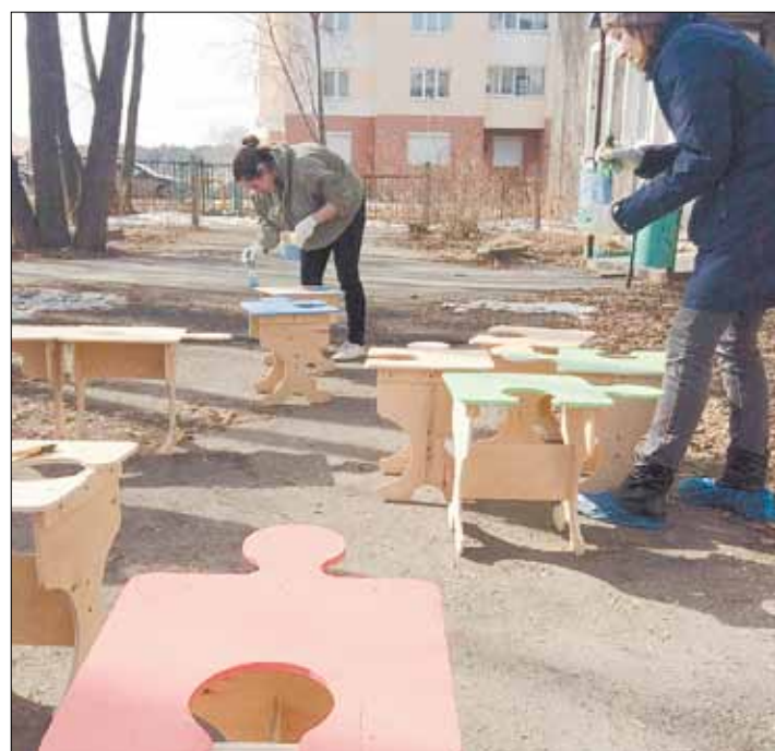
Участников мастер-класса научат делать оригинальные скамейки-трансформеры