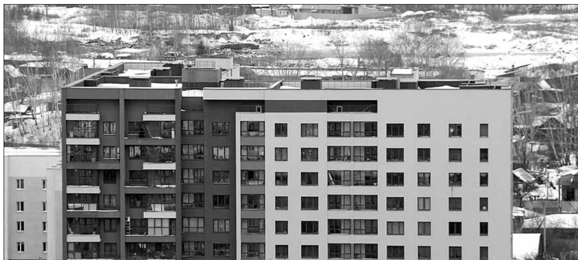
На фоне большинства домов этого района города Берёзовского дома № 16 и 18 Жилищного комплекса на Красных Героев отличаются яркой расцветкой и необычным наружным фасадом.

— Раз у меня вода бежит в зал, <...> они определили, что пол сделан неправильно — такой наклон. Еще они сказали,