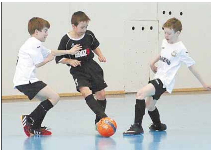
В матче с клубом «Тюмень» футболисты «BROZEX» уступили со счётом 7:3.