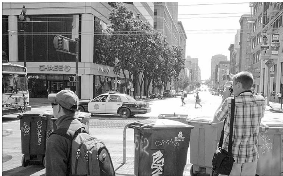
Разноцветные контейнеры для раздельного сбора мусора на одной из улиц Сан-Франциско. Сентябрь 2012 года.