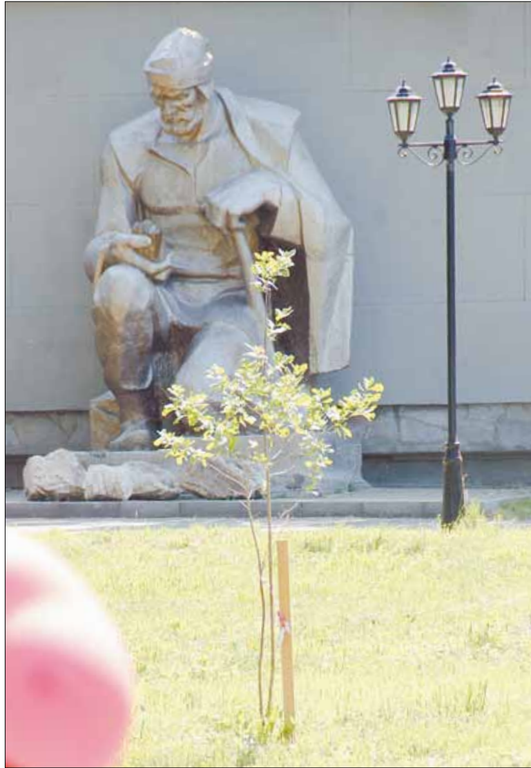
Памятник Ерофею Маркову в Историческом сквере города Берёзовского.

Заинтересованный разговор профессионалов въездного туризма на конференции стал лучшим подарком для двух знаменательных дат в развитии внутреннего туризма в Берёзовском. Конференция по минералогическому туризму прошла уже в пятый раз. И бесценным, активным участником ее организации является берёзовское турагентство «Аурум», которому в 2015 году исполняется десять лет.