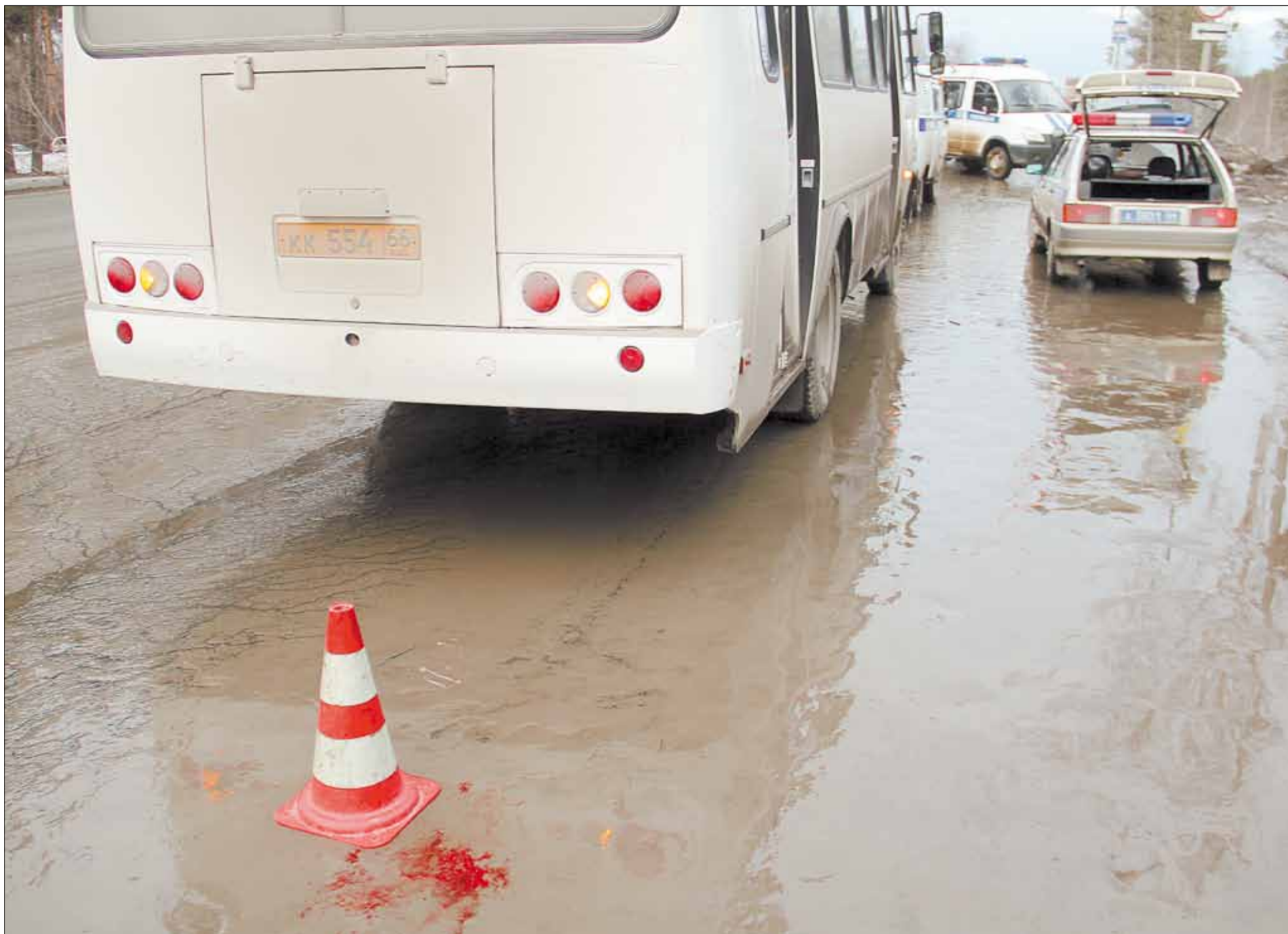
Сигнальным конусом сотрудники ГИБДД отметили место, где автобус наехал на ребенка.