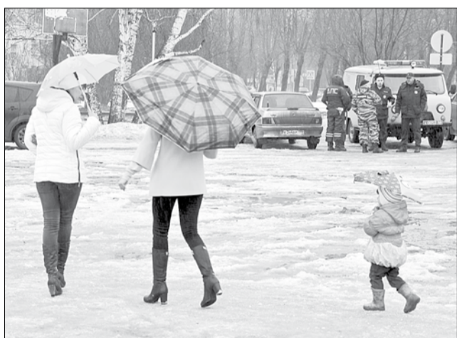
Полиция готова была пресечь незаконную акцию на Торговой площади при попытке ее проведения.

Чиновники отказались согласовать акцию «За доступную медицину»