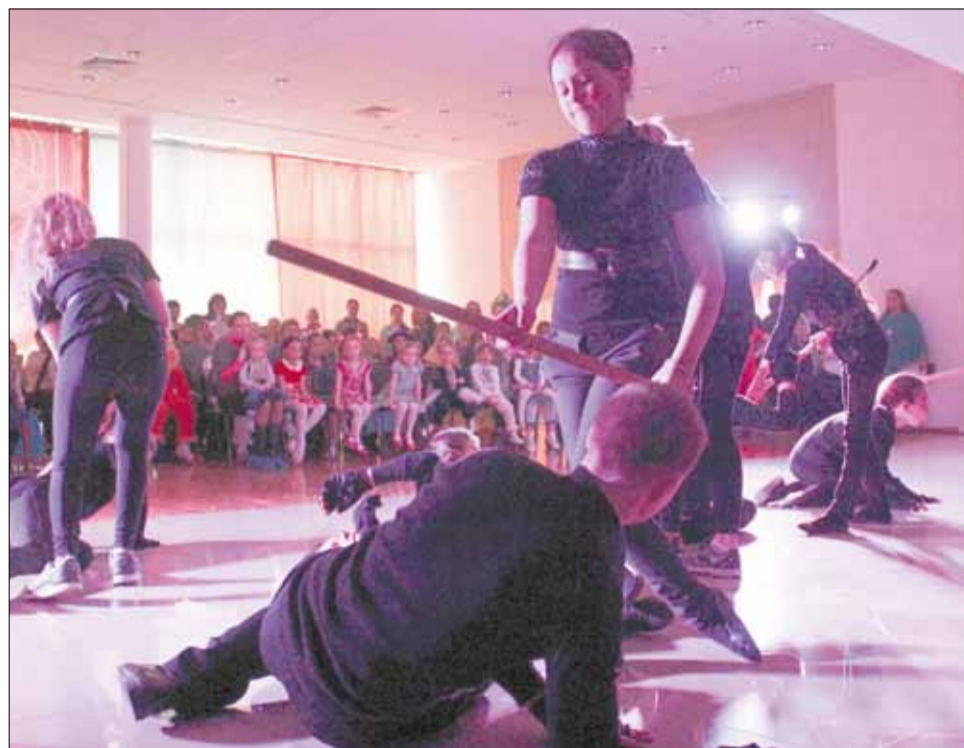
Ребята студии «Мир фантазий» взялись за сложную в плане сценического решения постановку «Как собака стала другом человека»