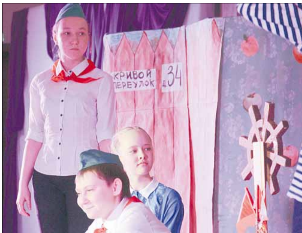
Семиклассники коллектива «Фантазёры» представили героев произведения Аркадия Гайдара «Тимур и его команда».