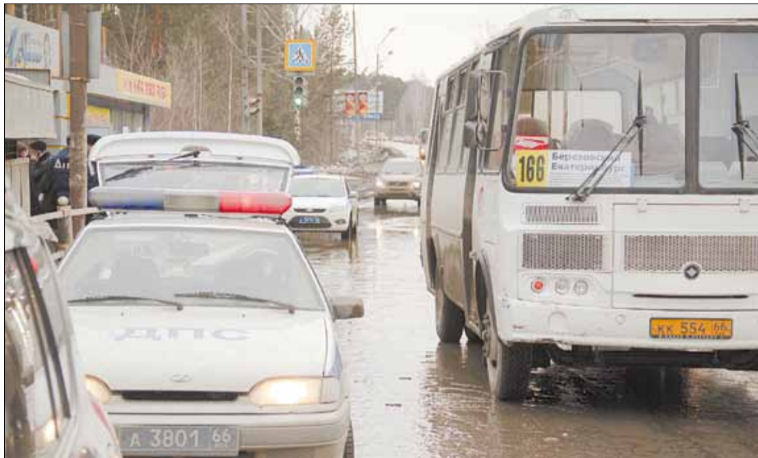
Отъезжая от остановки, «Пазик» объехал впереди стоящий автобус, высаживающий пассажиров. В этот момент его спереди обходила женщина с детьми