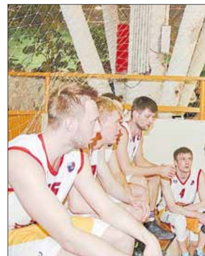
Таймаут. Тренер «BRG-basket» даёт указания игрокам.