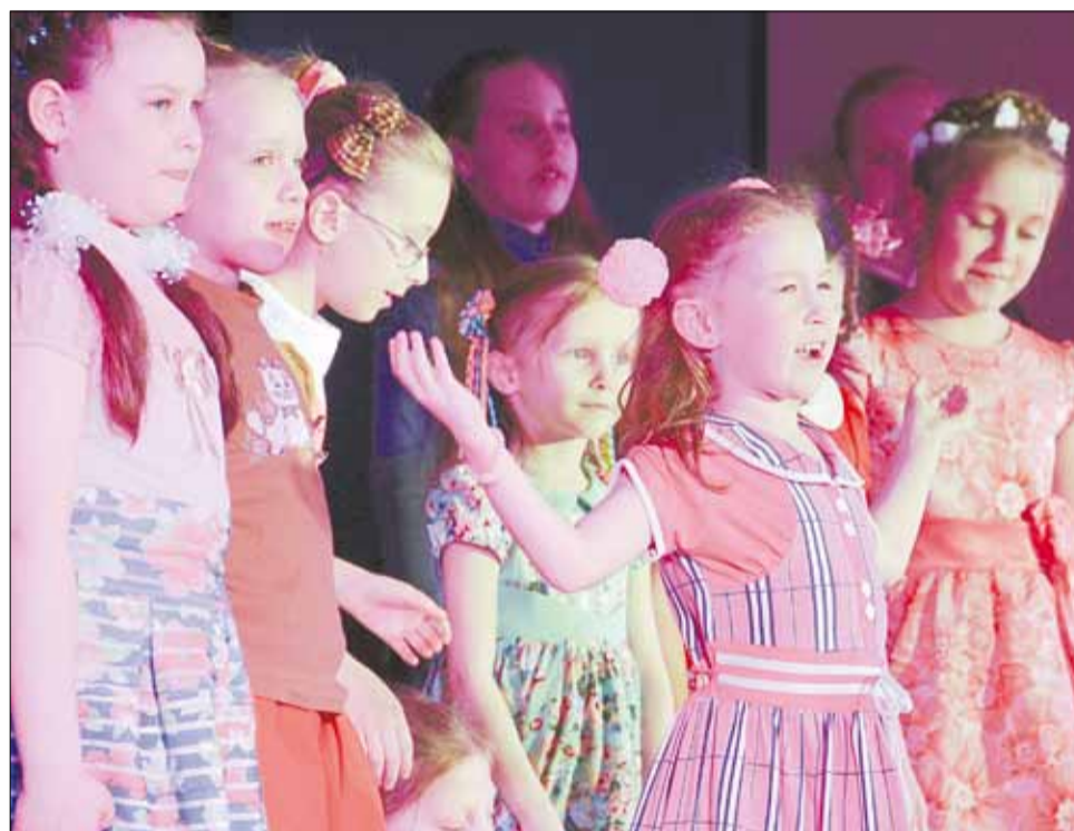
Спектакль из скороговорок «Чемодан чепухи» от коллектива «АРТист» городского центра детского творчества.