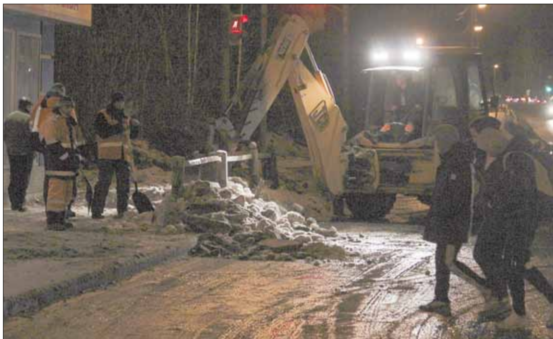
После происшествия дорожники до ночи чистили дорогу возле остановки, на следующий день уборка продолжилась.

Высказывания горожан о трагедии, которая случилась с ребенком на автобусной остановке. Свои отзывы авторы размещали на страницах газеты в соцсети «ВКонтакте», на сайте издания.