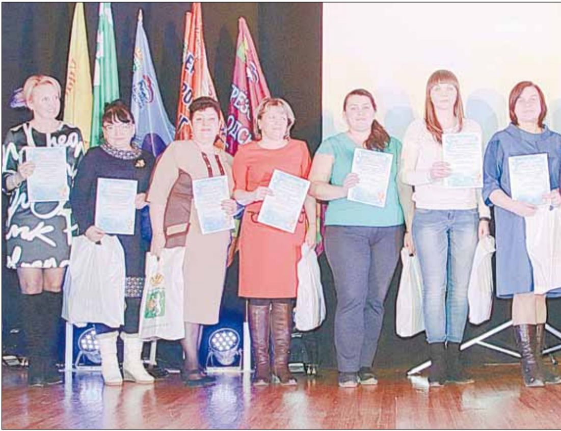
Награждение участников и победителей акции среди бюджетных организаций.

Тел. журналистов: (34369) 4-53-95, 8-904-982-33-11