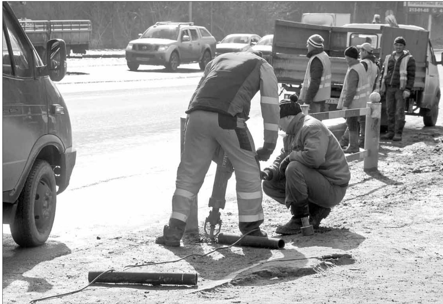
Рабочие устанавливают новое ограждение на остановочном комплексе «Максима Горького». Оно должно разделить участок высадки пассажиров из общественного транспорта и коридор для перехода дороги.