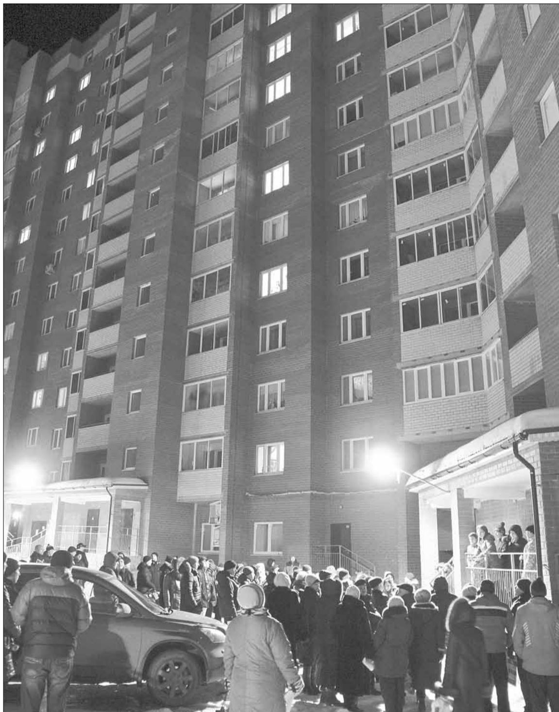
На общее собрание собственников дома № 17 по ул. Гагарина собралось более 100 человек. Всего же в 17-этажке 484 квартиры — это один из самых больших по площади помещений и численности собственников дом-новостройка в Берёзовском.

Собственники считают, что в сложившейся ситуации управляющая компания не в полной мере отстаивает их интересы. В 2014 году, когда новостройка была сдана в эксплуатацию,