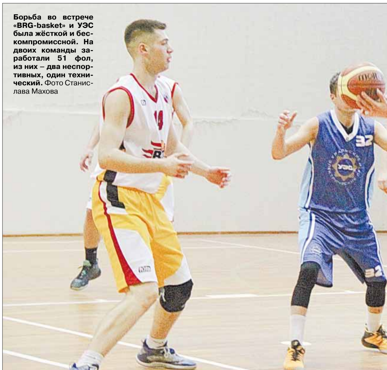
Борьба во встрече «BRG-basket» и УЭС была жёсткой и бескомпромиссной. На двоих команды заработали 51 фол, из них – два неспортивных, один технический.