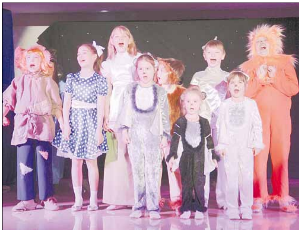
Отрывок из спектакля «Волшебник Изумрудного города» сыграли воспитанники студии «Чародеи».