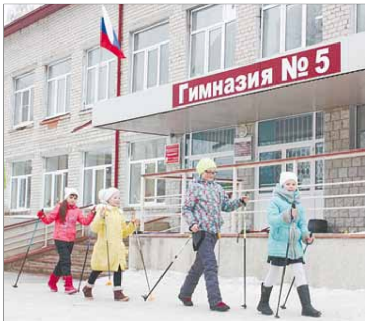
Занятия скандинавской ходьбой на уроке физкультуры

Тел. журналистов: (34369) 4-53-95, 8-904-982-33-11