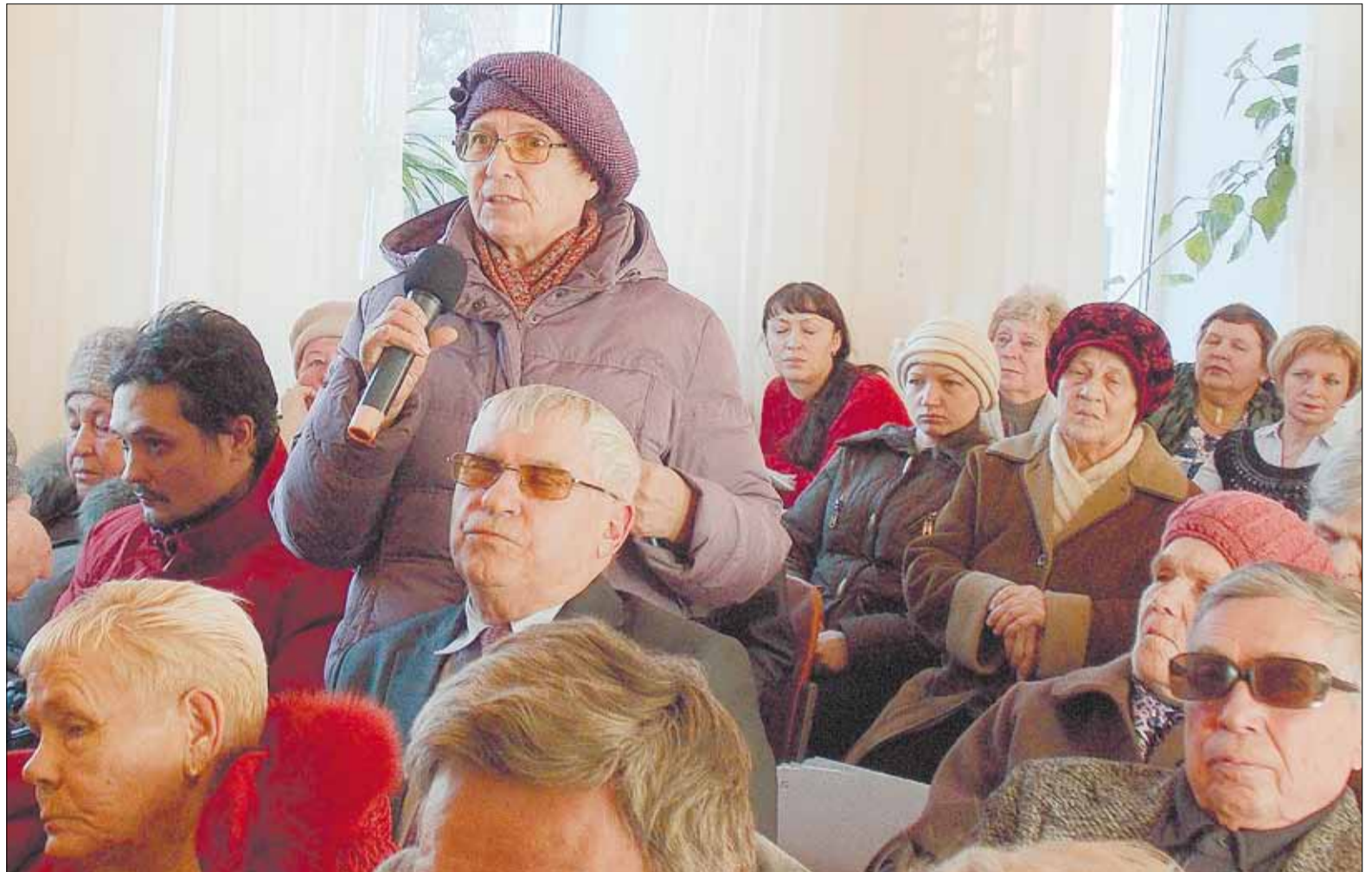
На отчёте в досуговом центре пенсионерка спросила мэра о судьбе пустующих больничных корпусов. Такой же вопрос жители задали Евгению Писцову на второй встрече, в школе искусств.

Дом № 20 пока не признан аварийным. Если жители хотят получить новые квартиры, им надо подать заявление в межведомственную комиссию мэрии. Специалисты, оценив условия проживания, официально подтвердят: надо расселять. Только тогда барак включают в федеральную программу. Правда, новые дома построят только после 2017