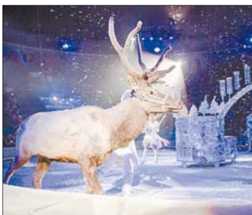
Номер «Зимняя сказка Русь» с участием оленей, лисиц, борзых выдержан в стиле замка Снежной Королевы