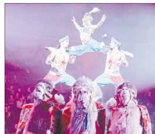
Дрессированные верблюды в номере «В гостях у шейха»