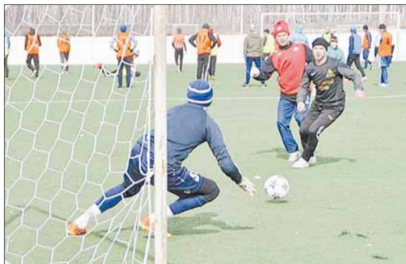
Опасный момент у ворот «Горняка».