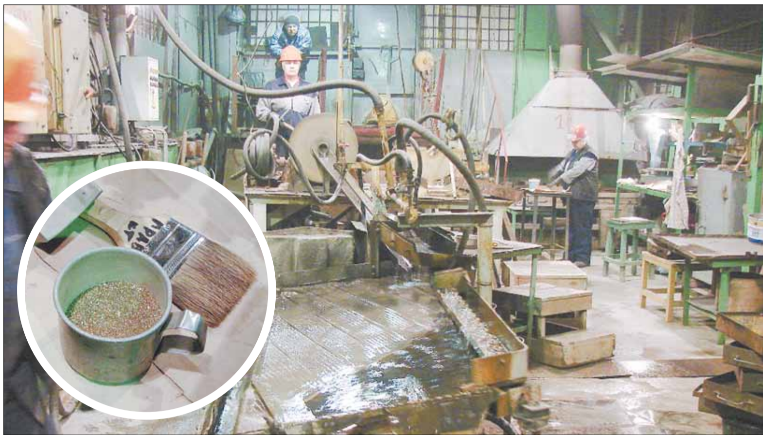
Обогатительная фабрика «Берёзовского рудника».

— В регионе разрабатываются новые золотоносные месторождения — Маминское, Бьинговское, Воронцовское. Кроме того, уже сейчас идут работы по подготовке к запуску нового горизонта «Берёзовского рудника» на отметке в 712 метров. Все эти месторождения позволяют нашим артелям стабилизировать ситуацию с объемом добычи и