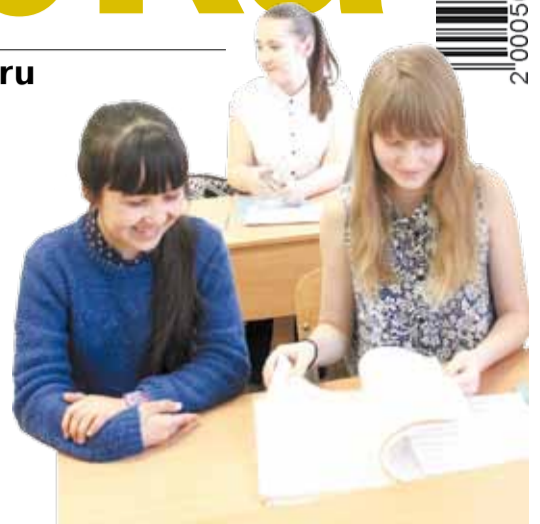
Урок сольфеджио у четвероклассников детской школы искусств № 2.