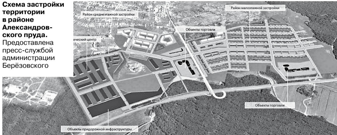
Схема застройки территории в районе Александровского пруда.