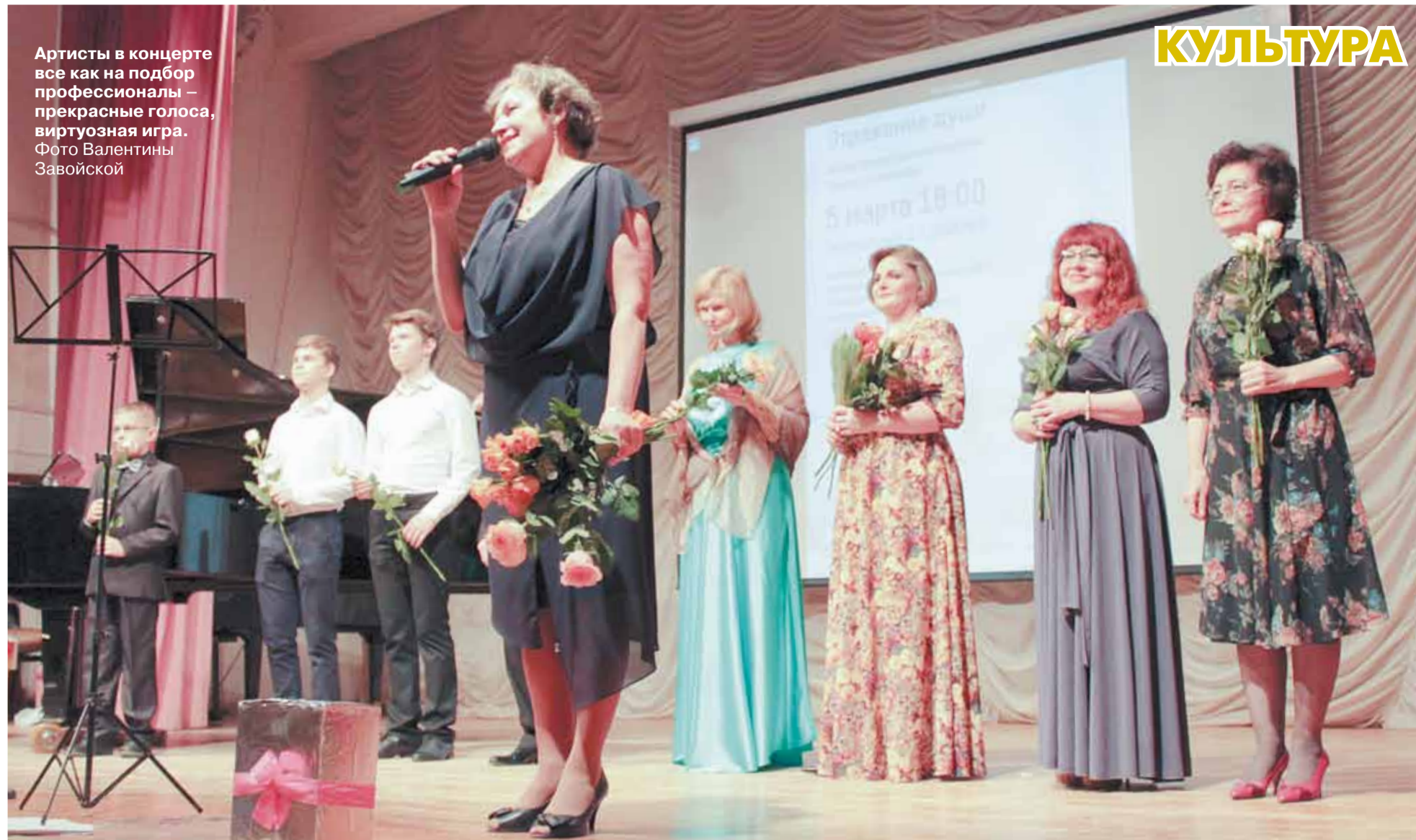
Артисты в концерте все как на подбор профессионалы – прекрасные голоса, виртуозная игра.