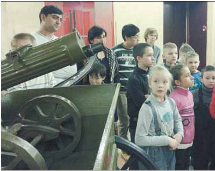
Юные березовчане в зале музея «Боевая слава Урала».

Тел. журналистов: (34369) 4-53-95, 8-904-982-33-11