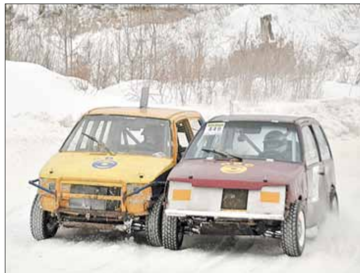
Состязания «Окушек» в День защитника Отечества.