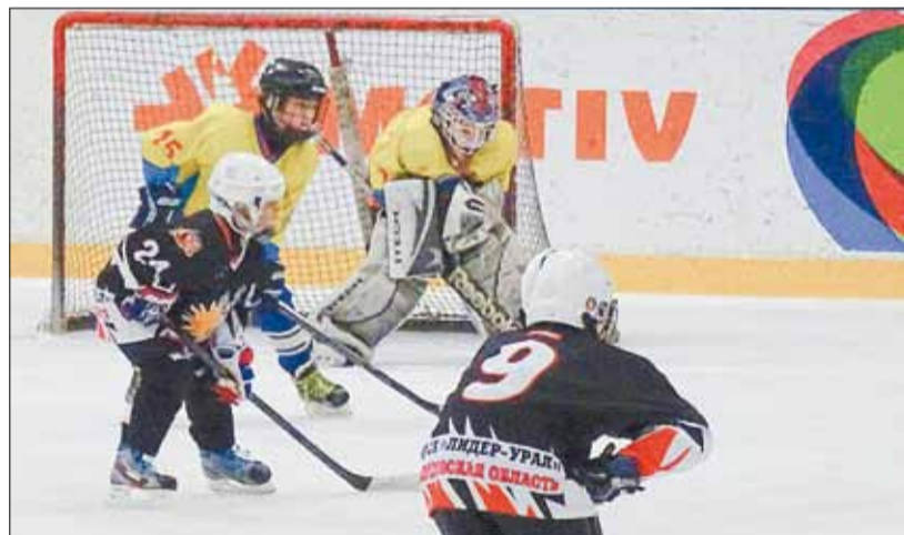
Финальный матч между «BROZEX» и «Молнией» из Верхней Туры. Игра прошла 28 февраля в спорткомплексе «Курганово».