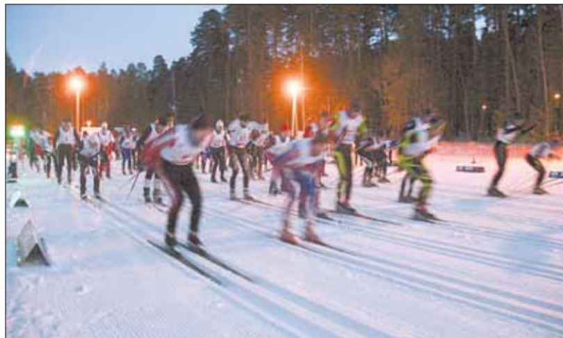
Старт забега на 30 километров.