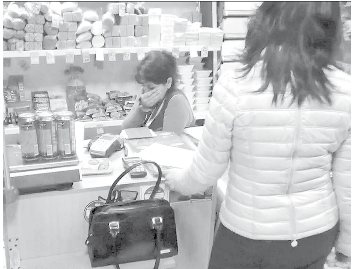
Успокоительные слова участников рейда о том, что ничего страшного не случилось, не подействовали, полиции удалось взять объяснения продавца только после приезда медиков. Стоп-кадр видеозаписи, сделанной общественниками