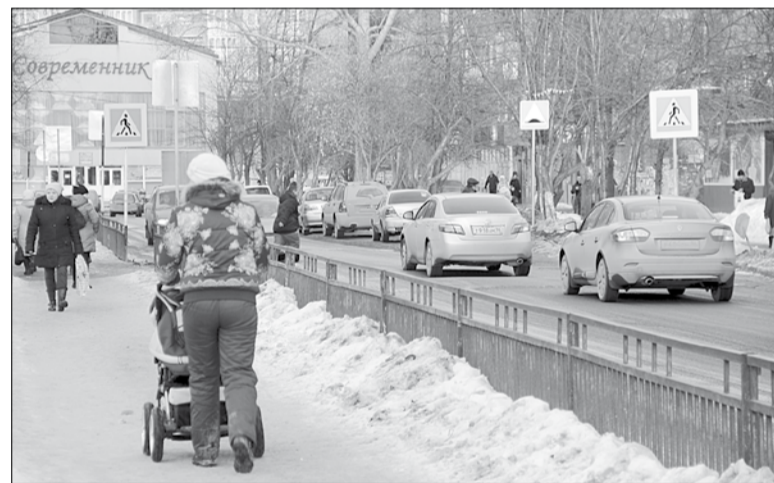
Одна из центральных улиц Новоберёзовского микрорайона — ул. Смирнова.

Много претензий было и к жилищникам. Горожане жаловались на управляющую компанию «ЖКХ-Холдинг», просили починить крышу и подъезды.