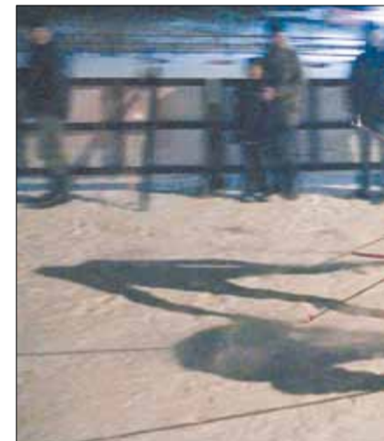
Борьба за второе место. Роман (справа) на сотые доли секунды