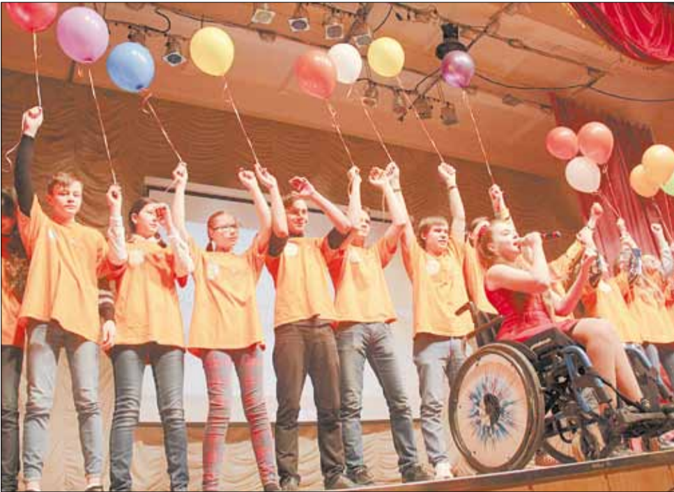
Многим березовчанам знакомы эти ребята, чьи яркие футболки служат символом «Искорок добра». Когда волонтеры спустились со сцены, они подарили воздушные шарики друзьям из Монетного.

Тел. журналистов: (34369) 4-53-95, 8-904-982-33-11