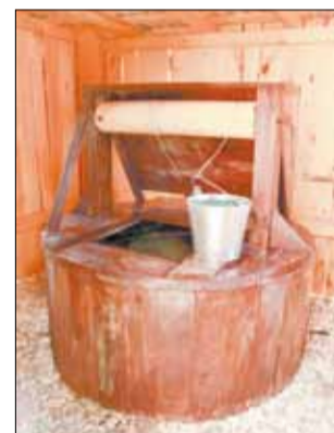
Колодцы на ул. Наумова и Меньшикова в Сарапулке расположены друг от друга сравнительно недалеко, но по вкусу вода в них разительно отличается.