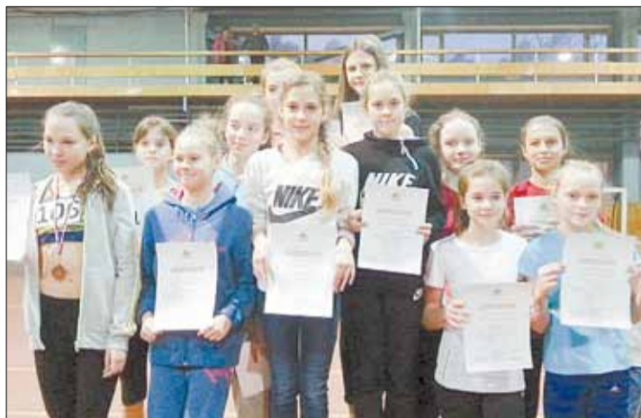
Дружная команда берёзовских легкоатлеток с трудом уместилась на пьедестал.

Тел. журналистов: (34369) 4-53-95, 8-904-982-33-11