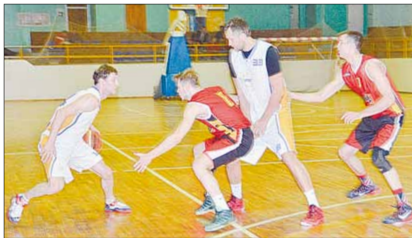
Яркая и непредсказуемая встреча в финале «BRG-basket» и УЭС надолго запомнится болельщикам