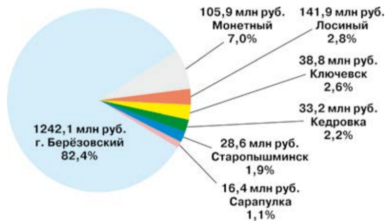
Исполнение расходов бюджета за 9 месяцев 2015 года. Всего: 1506,9 млн руб.

— Мало того, что привлекли [кредит] и вовремя рассчитались, у нас есть все основания рассчитывать на значительное списание этой суммы, — подчеркнул