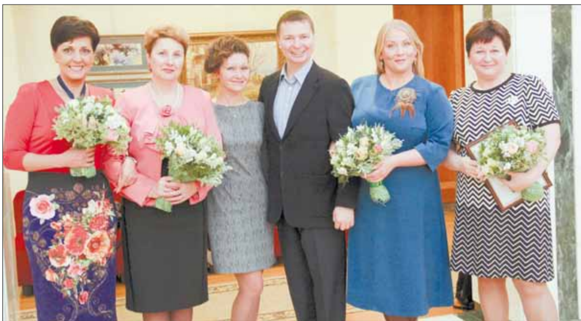
Руководители местных СМИ Свердловской области после церемонии награждения