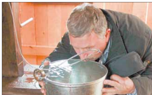
Зрелище, непривычное для квартирных жителей – воду из колодца можно пить не кипяченую.