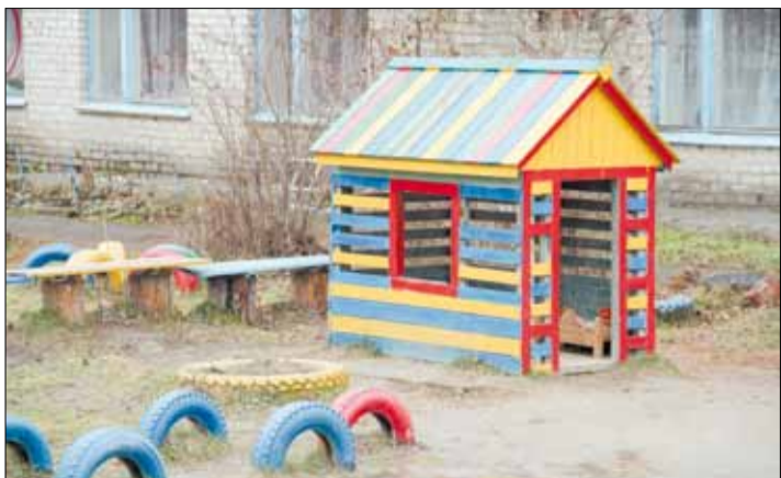
Поселковый садик был вынужден закрыть свои двери для детей.

Тел. журналистов: (34369) 4-53-95, 8-904-982-33-11