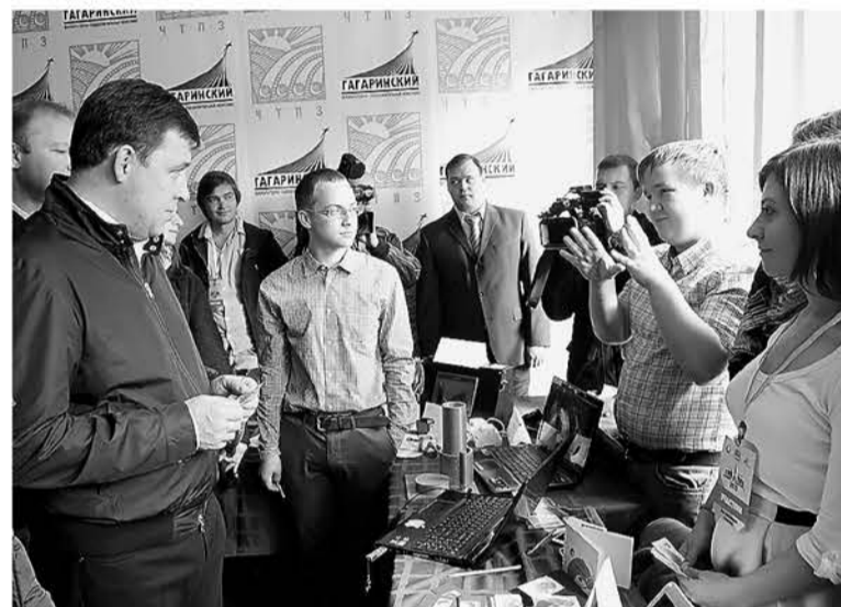
Любой житель региона может принять участие в обсуждении проекта Стратегии-2030 на сайте http://strategy2030.midural.ru/

К 2030 году Свердловская область войдет в число 10 регионов России с высоким индексом человеческого капитала, а продолжительность жизни повысится на 10 лет – до 77,5. Об этом гласит Стратегия социально-экономического развития до 2030 года. Проект основного стратегического документа области представлен губернатору.