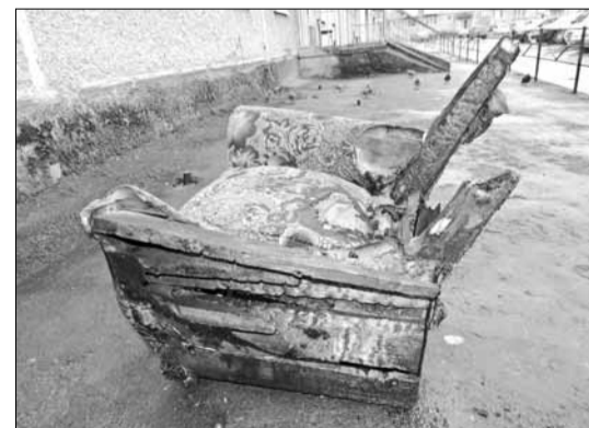
Горящее кресло огнеборцы вынесли на свежий воздух.

Как сообщает Тамара Дмитриевна, в ходе проверки следственный орган направил запрос в комиссию, ответ на который должен поступить не позднее 13 ноября. Ранее пенсионерка обращалась за помощью в областную прокуратуру, которая перенаправила ее заявление в прокуратуру города Берёзовского.