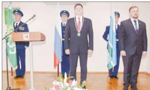
Мэр Евгений Писцов и спикер Думы Евгений Говоруха во время исполнения гимна России