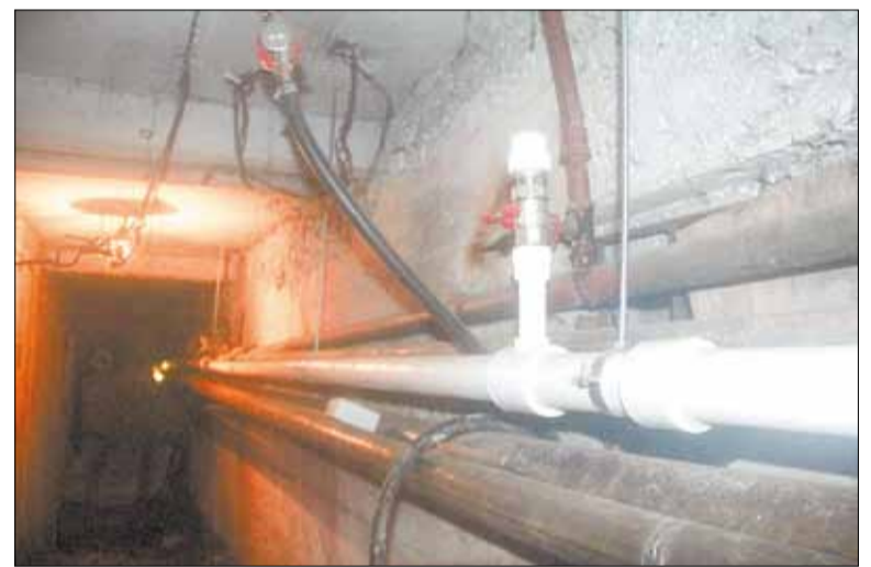
Новые трубы отопления и водоснабжения в подвале дома № 5 по ул. Шилловской.

Со двора окрашена часть стен дома № 5 по ул. Шилловской. Кровельщики перекаладывают шифер в тех местах, где уложили его неправильно. В планах — укладка минеральных плит для утепления чердачного перекрытия. Слесари заново смонтировали ввод тепла в дом, проложили в подвале разводку холодного водоснабжения. Отопление здесь было включено по временной схеме. На минувшей неделе специалисты «Термотехники» протянули в квартирах первого подъезда новые стальные