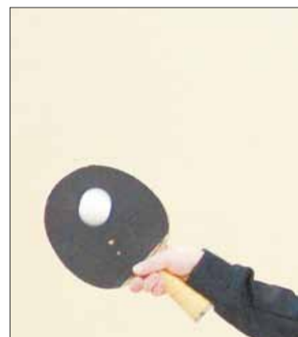
Один из са 10-летни