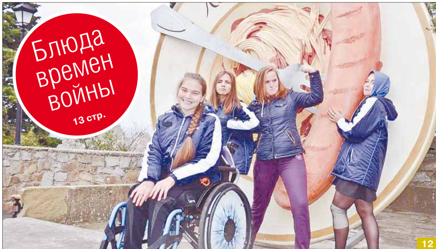
Скульптура возле столовой артековского лагеря «Лазурный» демонстрирует отнюдь не весь рацион. В крымской здравнице детей кормят пять раз в день по типу «шведского стола», превышая рекомендуемые нормы питательных веществ. Трудиться ребятам приходится и умственно, и физически, а это вызывает немалый аппетит.