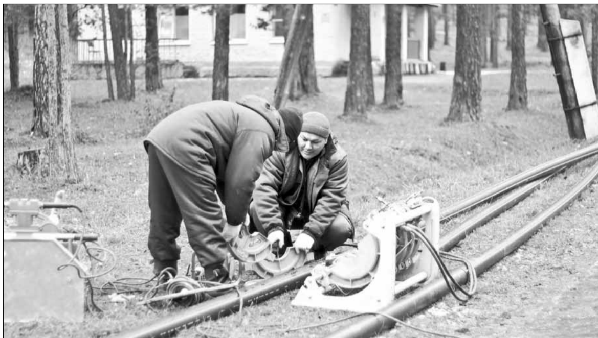
Сварка пластиковых труб будущей канализации на территории лагеря «Зарница».

Уважаемые читатели, делайте газету с нами! Ваши актуальные письма, сообщения, мнения будут напечатаны на страницах газеты