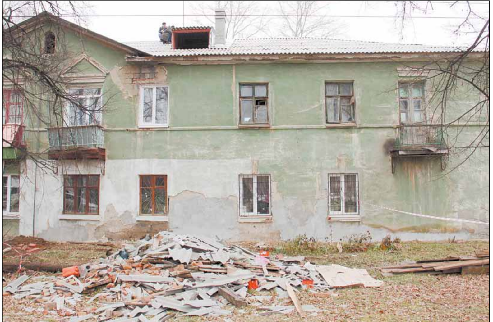
Капремонт дома № 27 в Первомайском поселке ведется неспешно, что не устраивает как жителей, так и контролирующие органы.

Вслед за трубами отопления в квартирах на Первомайском должны заменить стояки хо-