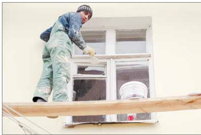
Эксперты гадают: сколько продержится на фасадах штукатурка и краска, нанесенные при низких температурах?

лодного водоснабжения и канализации. Во время этих работ строители раскрывают настежь входные двери квартир, заставляя жильцов мёрзнуть. Люди считают это ненормальным и требуют прекратить издевательство над ними.