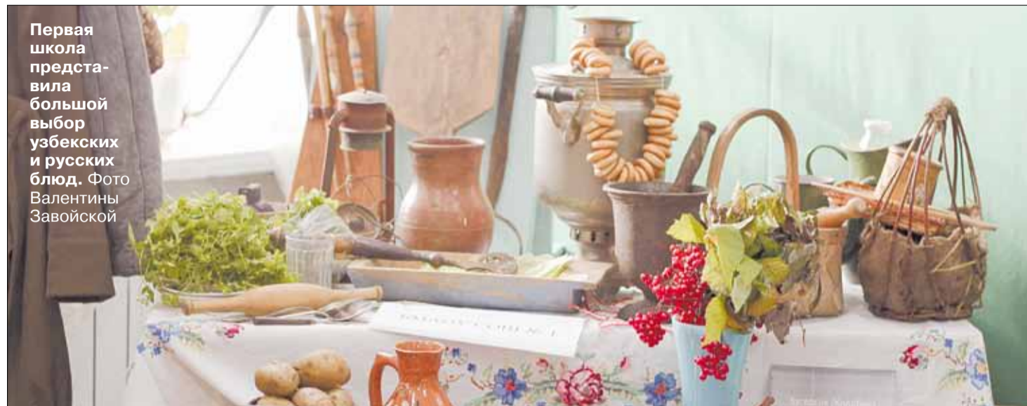
Первая школа представила большой выбор узбекских и русских блюд.