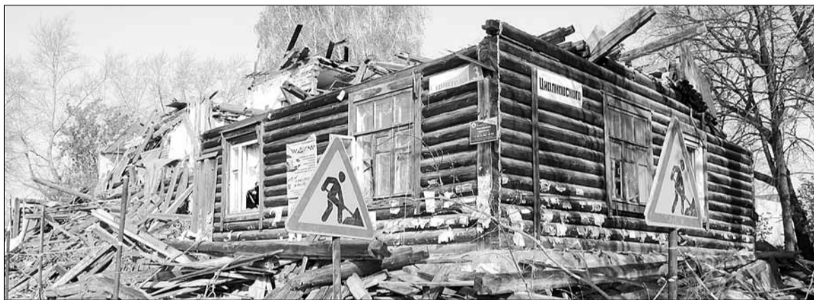
Рабочие ломают последний деревянный барак в центре Берёзовского. На освободившейся земле в районе перекрестка улиц Театральная – Строителей мэр Евгений Писцов обещал возвести в будущем современный дворец культуры.