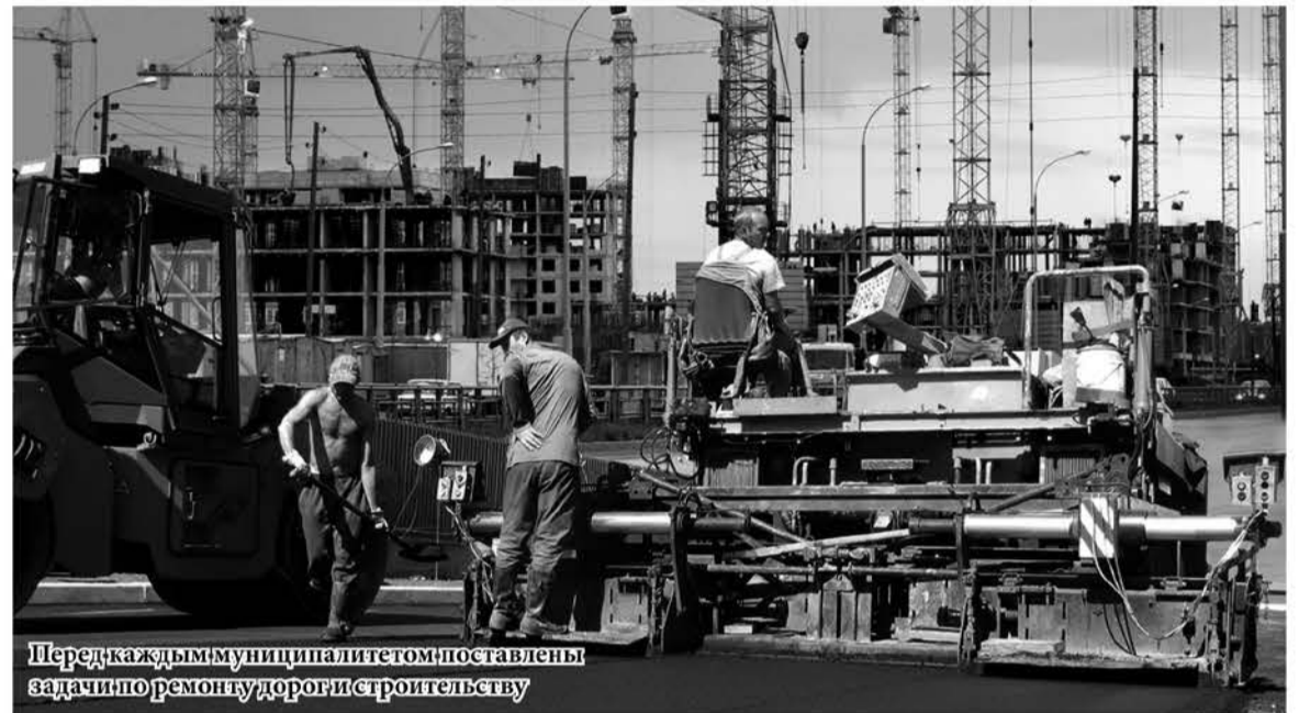
Перед каждым муниципалитетом поставлены задачи по ремонту дорог и строительству