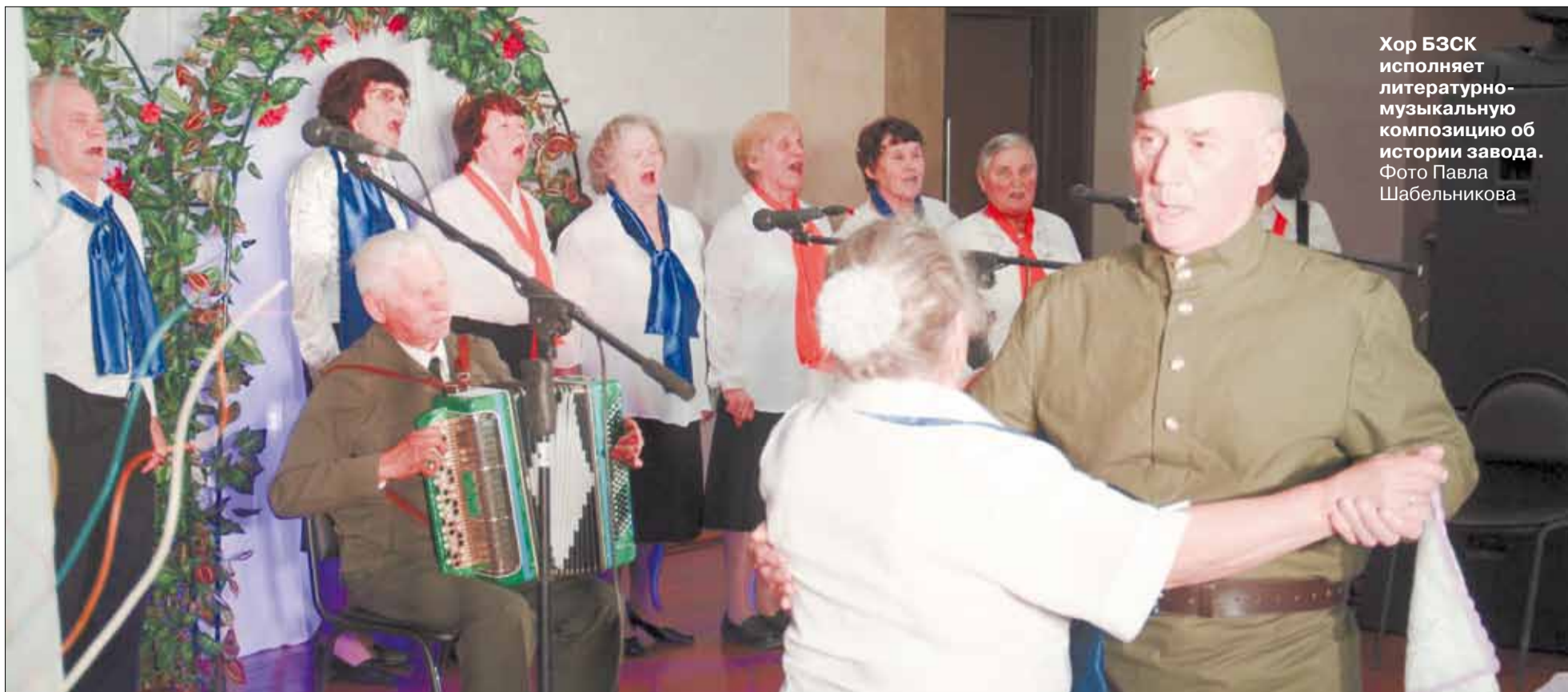
Хор БЗСК исполняет литературно-музыкальную композицию об истории завода.