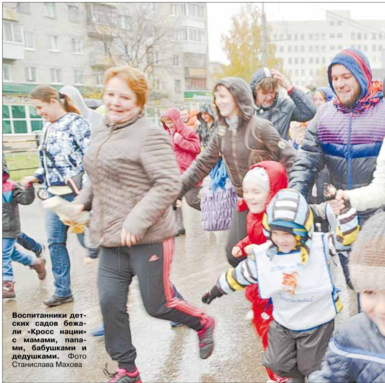
Воспитанники детских садов бежали «Кросс нации» с мамами, папами, бабушками и дедушками.