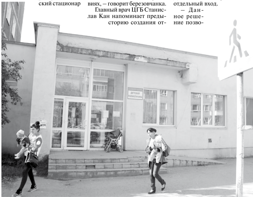
Дорога рядом со зданием детской поликлиники по ул. Гагарина, 1 в свое время была оборудована пешеходным переходом, а помещения отремонтировались за счет городской казны.

Ситуация с закрытием отделения на Гагарина, 1 обсуждалась на депутатской комиссии в местной Думе. Народные избранники настаивают на возвращении освобожденного здания в собственность муниципалитета. Среди вариантов его дальнейшего использования — размещение Единой дежурно-диспетчерской службы или досугового учреждения для детей. Например, можно перевести сюда дворовый клуб «Меридиан», который ютится в одной из квартир соседней пятиэтажки.