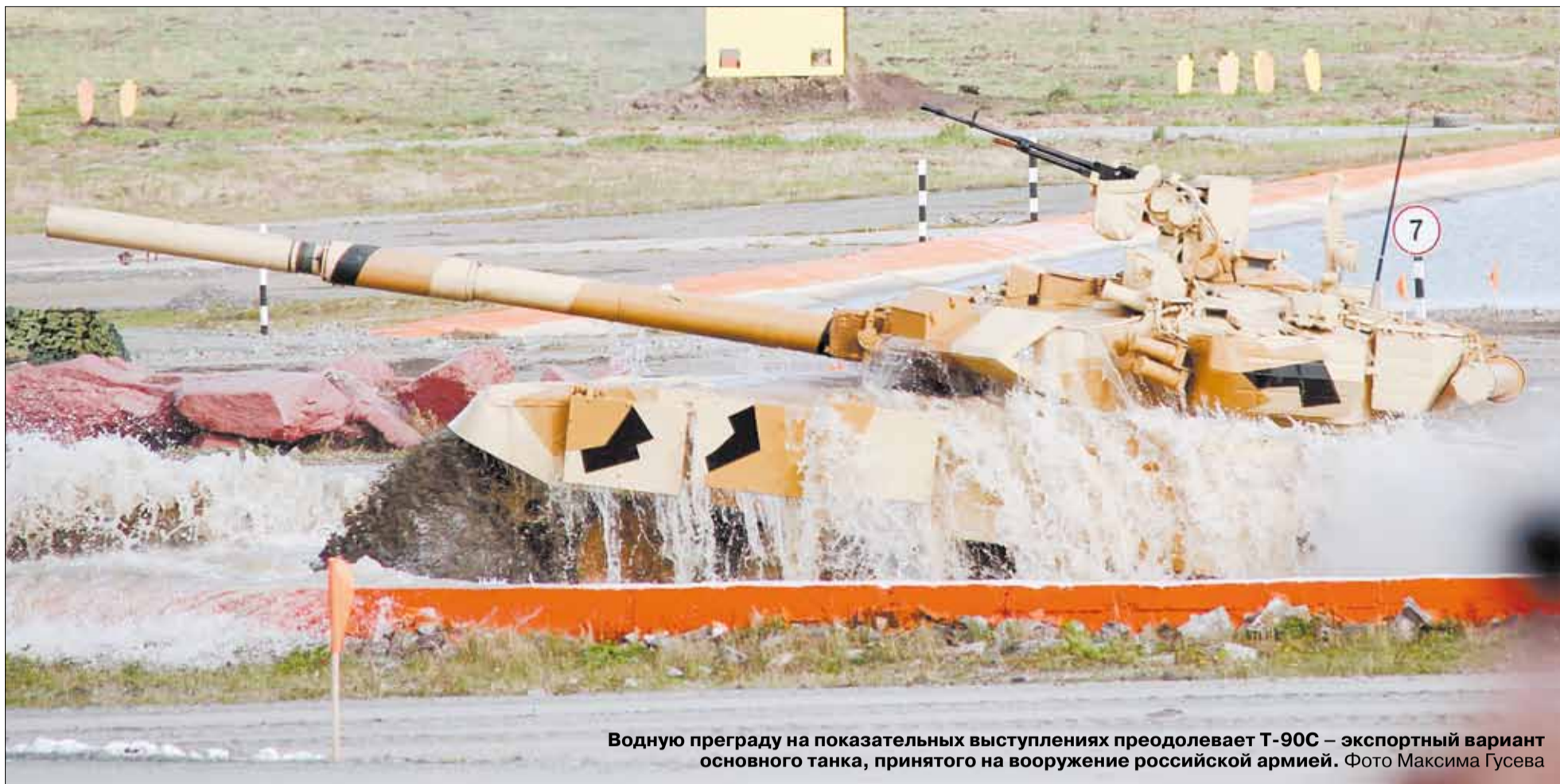
Водную преграду на показательных выступлениях преодолевает Т-90С – экспортный вариант основного танка, принятого на вооружение российской армией.