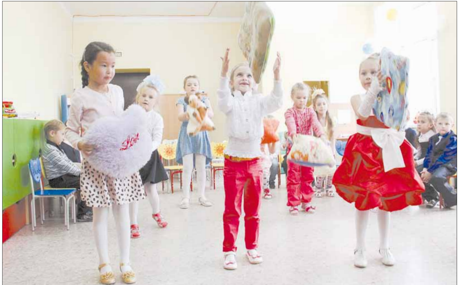
Музыкальный сюрприз на открытии новой группы в школе Лосиногорского: девочки-шестилетки танцевали с подушками под шутивную песенку о том, как же порой малышам не хочется ложиться спать в тихий час.