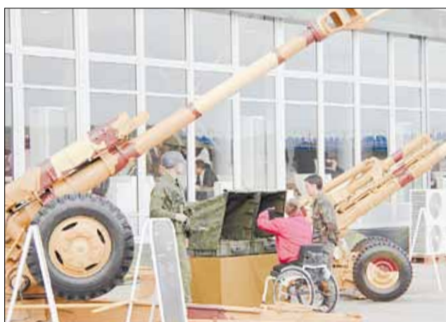
122-миллиметровая гаубица Д-30 (слева) находится на вооружении 35 стран.