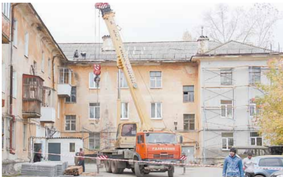
На ремонт дома № 5 по ул. Шиловской региональный фонд выделил максимальную сумму – 11,5 миллионов.