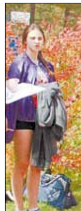
Победа в БР из пятой гимназии юношеской