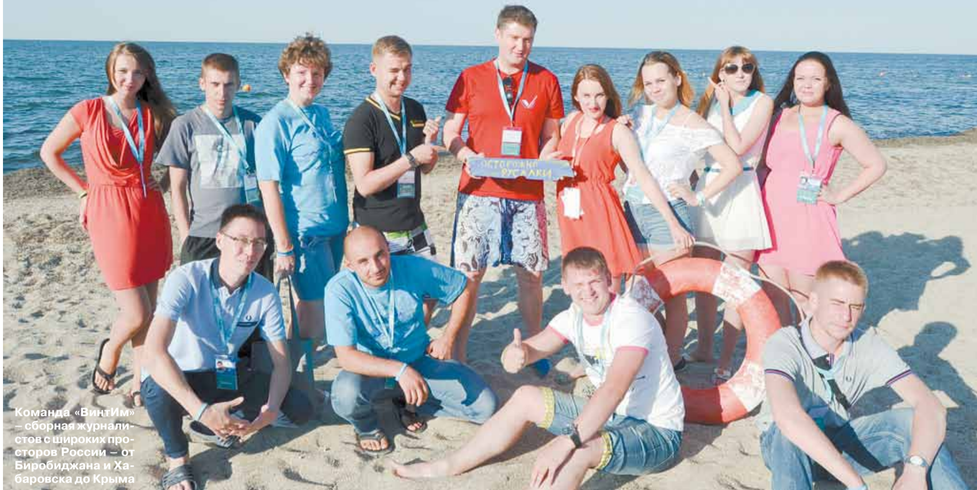
Команда «ВинТим» – сборная журналист- ов с широких про- сторов России – от Биробиджана и Ха- баровска до Крыма

Тел. журналистов: (34369) 4-53-95, 8-904-982-33-11