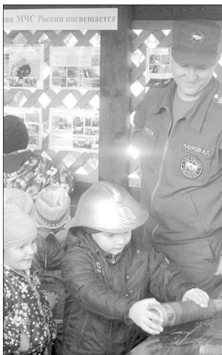
Малыши 39-го детского сада на экскурсии в пожарной части

Тел. журналистов: (34369) 4-53-95, 8-904-982-33-11