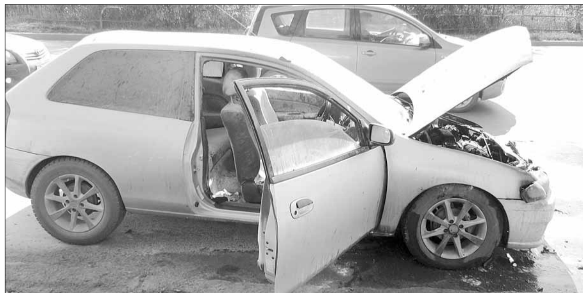
Протечка бензина из топливной системы привела к пожару в моторном отсеке «Мазды».

Пишите: gorka-info@rambler.ru Звоните по тел. (34369) 4-53-95, сот. 8-904-982-33-11 Наш сайт: zg66.ru