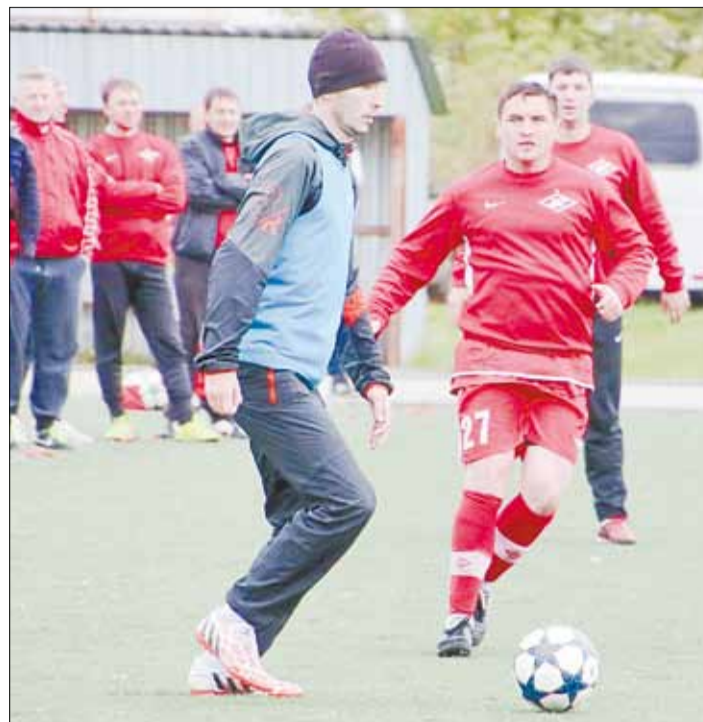
Матч «Спартак» – «Вакум». Красно-белые одержали победу со счётом 5:2.