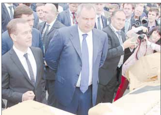
Военную технику осматривают председатель правительства Дмитрий Медведев и вице-премьер Дмитрий Рогозин.