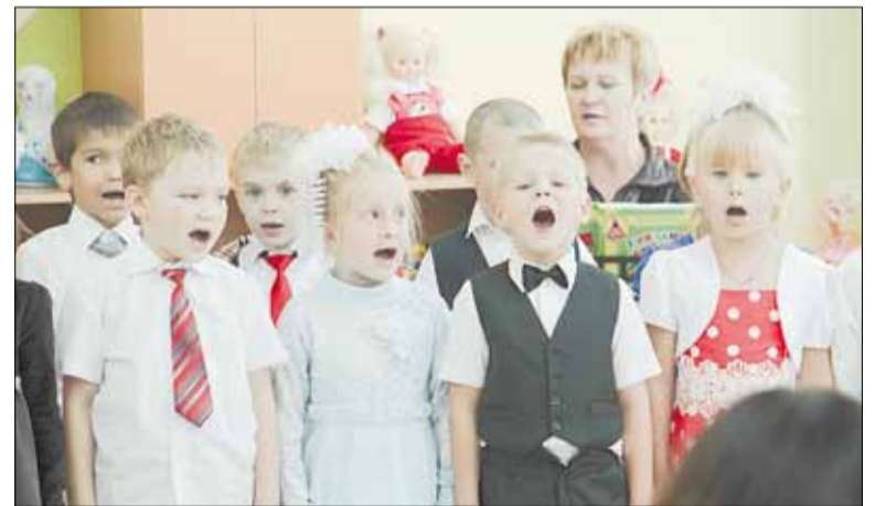
Первые воспитанники новой группы, построенной в стенах ключевской школы № 11.

— Сегодня праздник не только у тех ребят, кто празднует но-