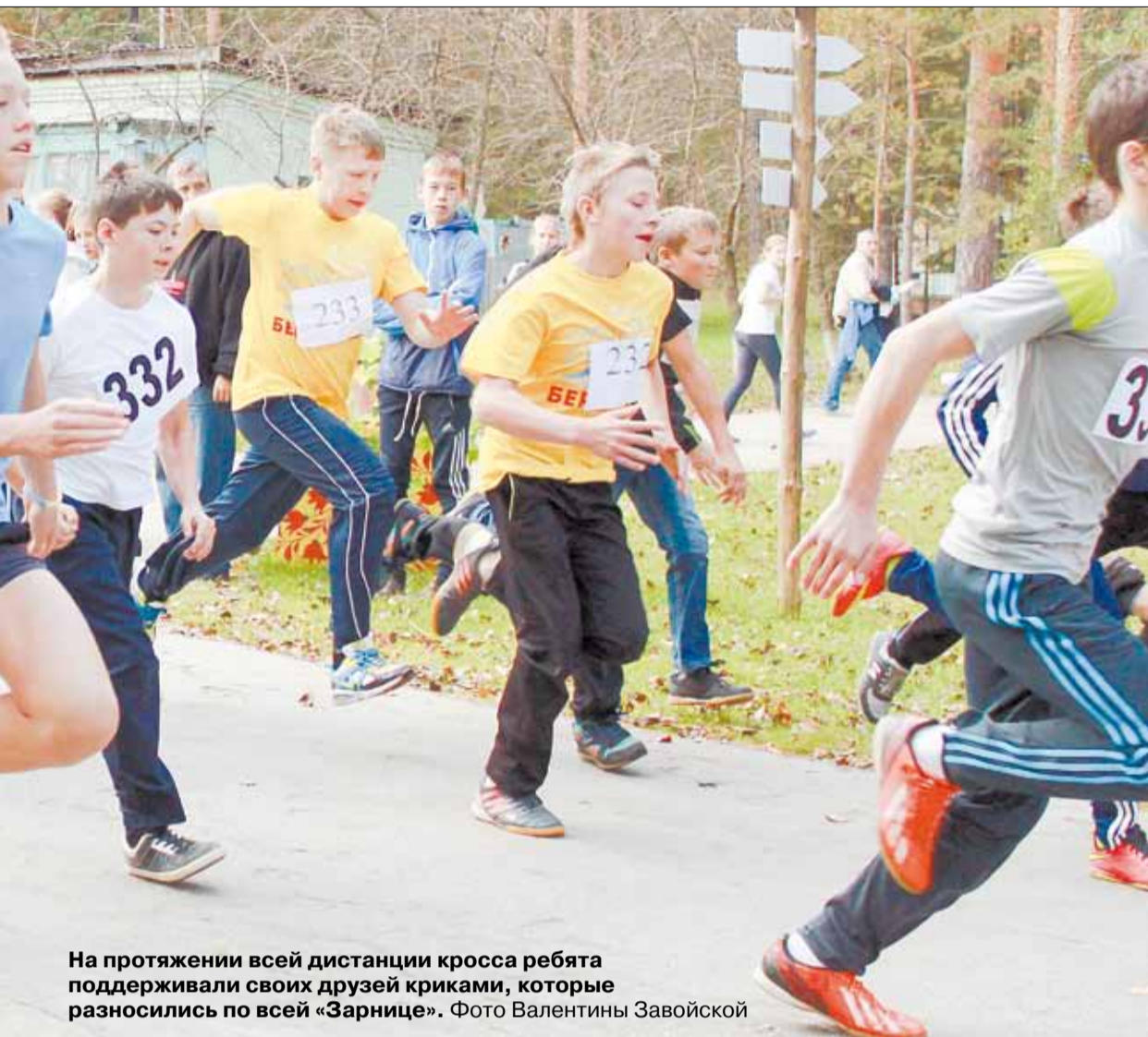
На протяжении всей дистанции кросса ребята поддерживали своих друзей криками, которые разносились по всей «Зарнице».