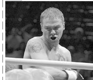
03.15 Х/ф «Бой с тенью 2: Реванш» (16+)