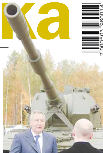
Вице-премьер Дмитрий Рогозин и 152-миллиметровая самоходная гаубица «Коалиция» на RAЕ-2015.