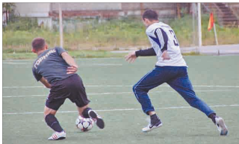
В этом сезоне «Дорстрой» и «Горняк» встречаются во второй раз. В первом матче уверенно победили «шахтёры»