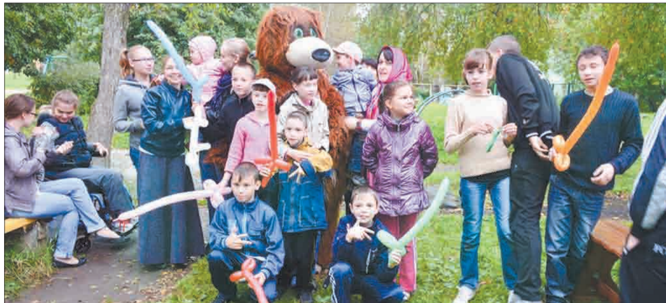
Забавной частью всей развлекательной программы стало творчество: дети с удовольствием делали различные фигурки из длинных воздушных шариков.

Всего за два дня акции «Купи газету — помоги ребенку из детского дома» волонтеры школьники собрали 7500 рублей. Часть денег ушла на настольные игры, наборы по уходу за руками, игрушки — для деток помладше, а также часы, наушники и портативную колонку — для подростков. Подарки были закуплены не просто так, а по заранее собранному просбам самих детей. Дополнительно к своим заказам име-