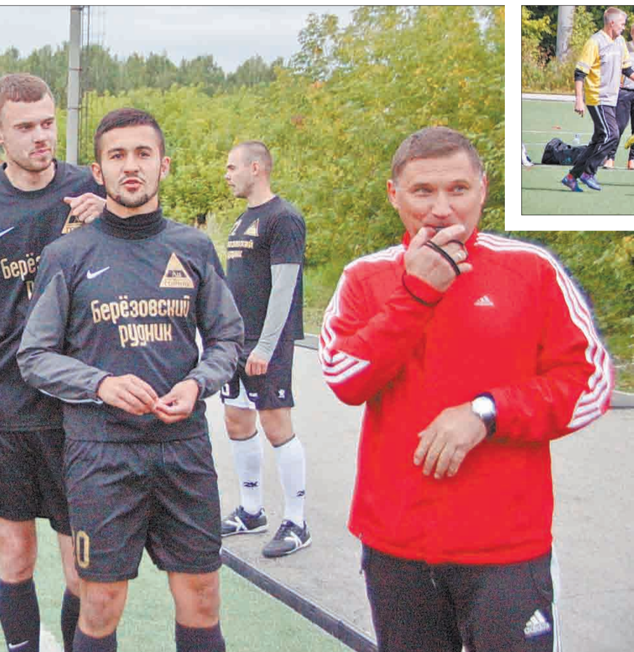
Главный судья ва