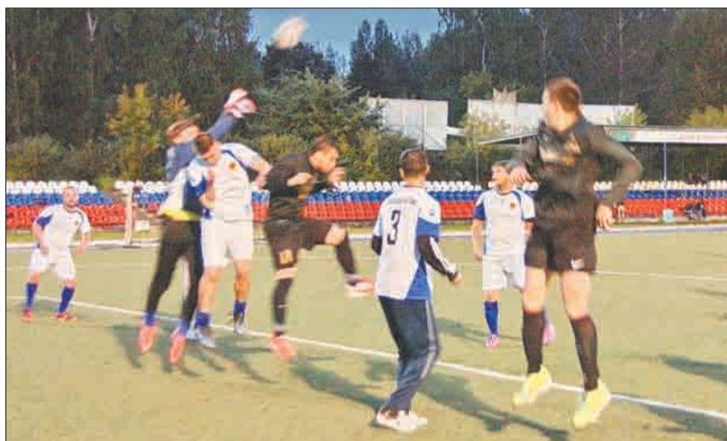
Опасный момент у ворот «Дорстроя».