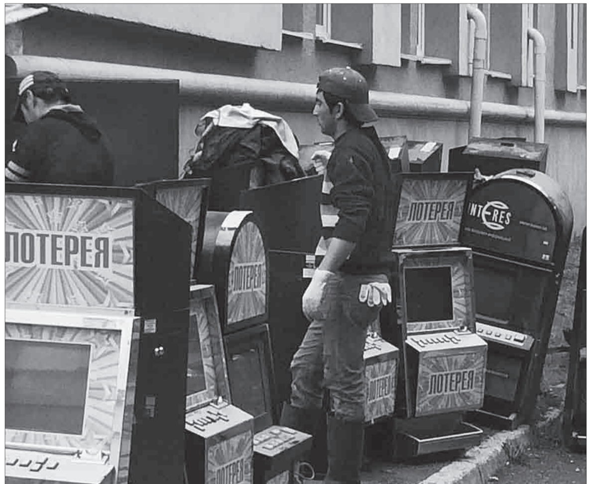
Прохожие удивленно взирали на то, как из здания городской администрации рабочие выносили многочисленные игровые автоматы.

В отношении 45-летнего гражданина возбуждено уголовное дело о даче взятки сотруднику ГИБДД, находящемуся при исполнении должностных обязанностей. Пытаясь уйти от привлечения к административной ответственности, гражданин передал патрульному полицейскому 2000 руб. Попытка дачи взятки зафиксирована 10 августа на ул. Косых.