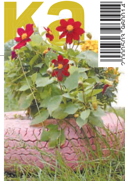
Участники акции «Цветущий гоь род» беззащитны перед вандалами и любителями чужого добра.