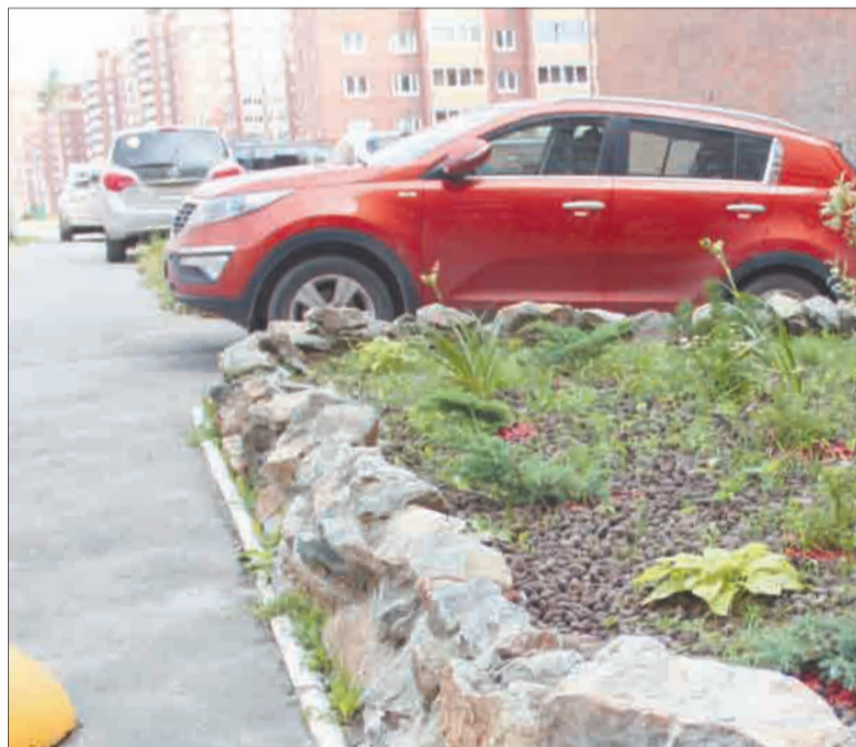
Пожилые жители шестого микрорайона не вполне довольны клумбой — по их словам, она опасна для детей и сократила места для парковки.

больше, чем пользы. Зимой на месте клумб появляются снеговики — одетые в варежки, шапки, шарфы ледяные скульптуры так же привлекают к себе много внимания, в том числе, и вандалов.