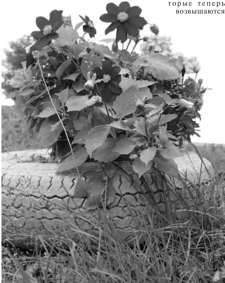
Ежегодно у трейлера «Черкашин и партнер» красуются милые клумбы — покрашенные автомобильные шины, наполненные грунтом.