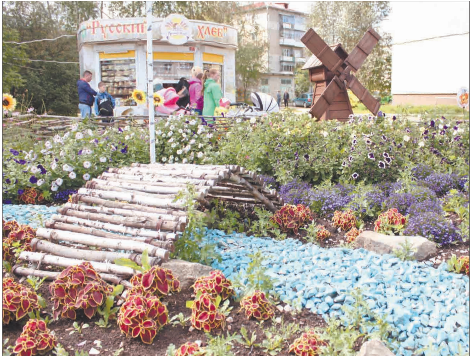
В следующем году в цветочную композицию на ул. Гагарина компания «Русский хлеб» обещает добавить фигуру Колобка — он будет сидеть на мостике, свесив ножки.

Яркие и аккуратные клумбы вандалы неоднократно разрушали в прошлом году — переворачивали, извлекая извне диски и подставки. Ныне предприниматели решили отказаться от дисков — проблем от них явно