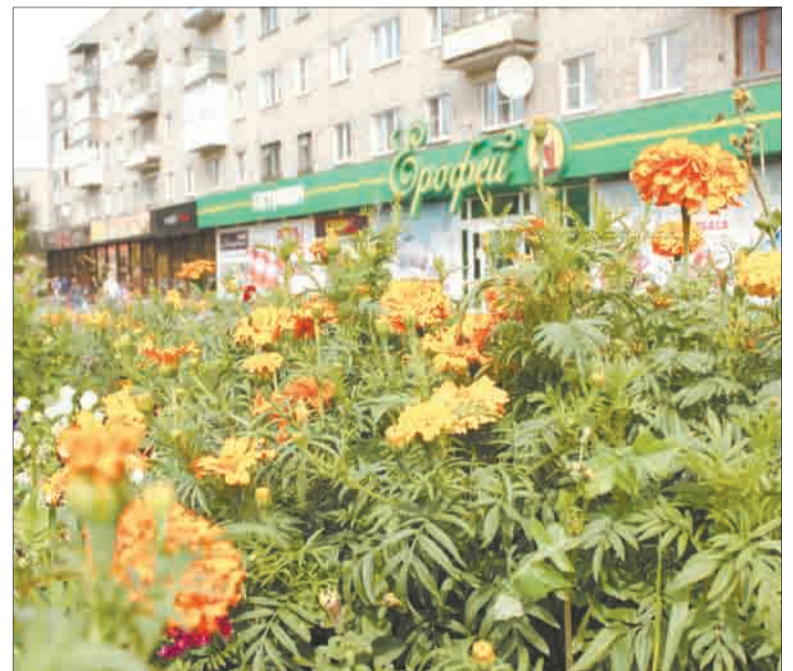
Две клумбы возле «Ерофея» потерпели убытки — сотрудникам вновь придётся подсаживать растения, которые были рассчитаны на два года.