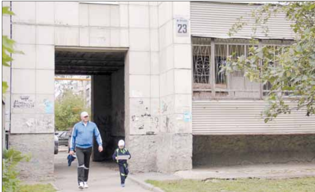
Арочный проезд между домом № 3 по ул. Смирнова и домом № 23 по ул. Максима Горького. На его ремонт депутаты выделили 180 тыс. руб.