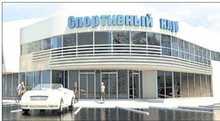
Примерный эскизный проект баскетбольного центра

Тел. журналистов: (34369) 4-53-95, 8-904-982-33-11