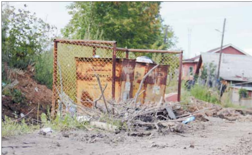
Контейнерная площадка на ул. Набережной. На деньги из депутатского фонда к ней будут оборудованы подходы.