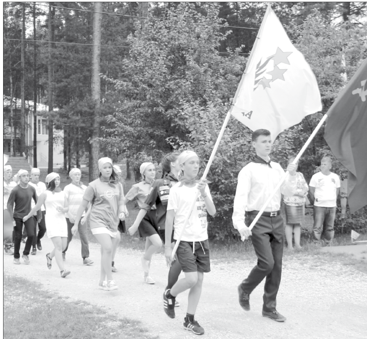
На торжественную церемонию открытия ребята выходили под флагами «Зарницы» и СССР.