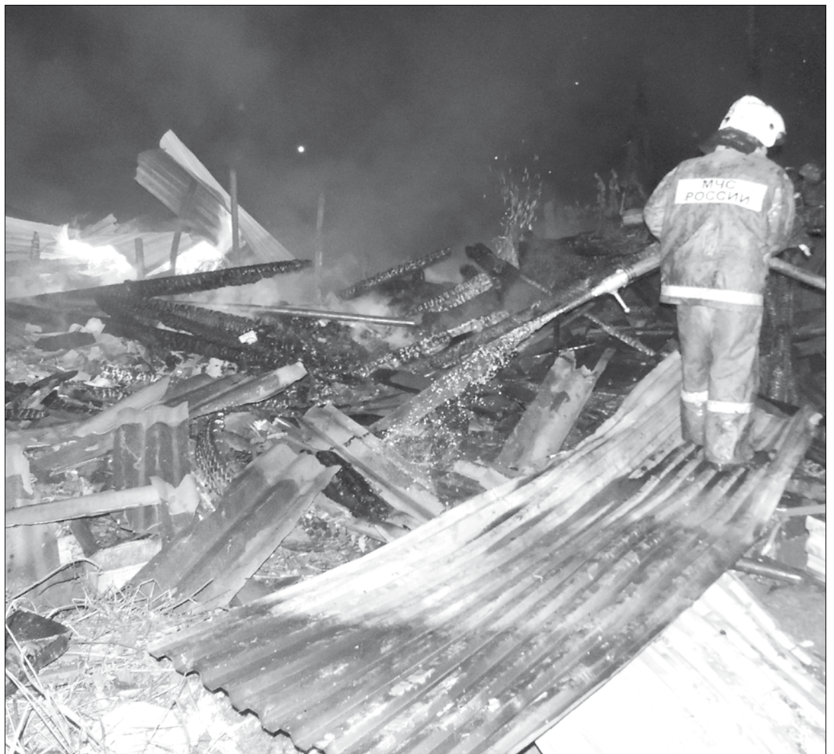
Сгоревшие сараи в посёлке Кедровка.