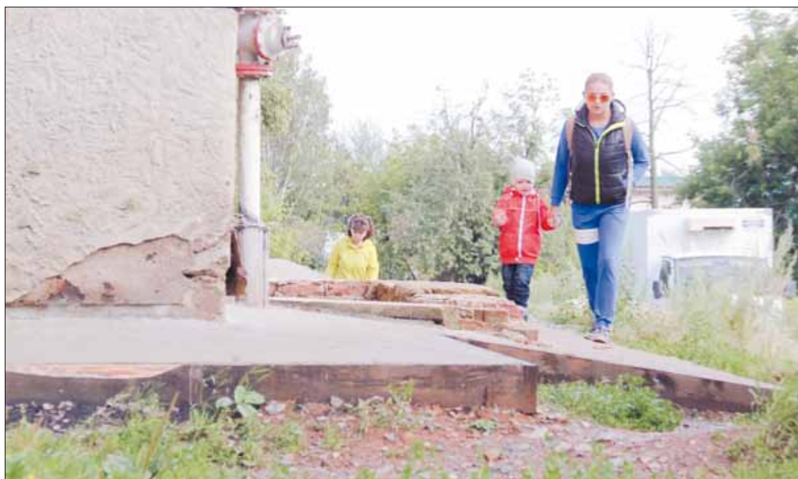
В обход разбитого участка на ул. Театральной народная тропа пролегает по отсыпке здания третьего дома.

В объёмном перечне значатся, в основном, ремонты школ, детских садов и работы по благоустройству — освещение улиц, асфальтирование дорог, тротуа-