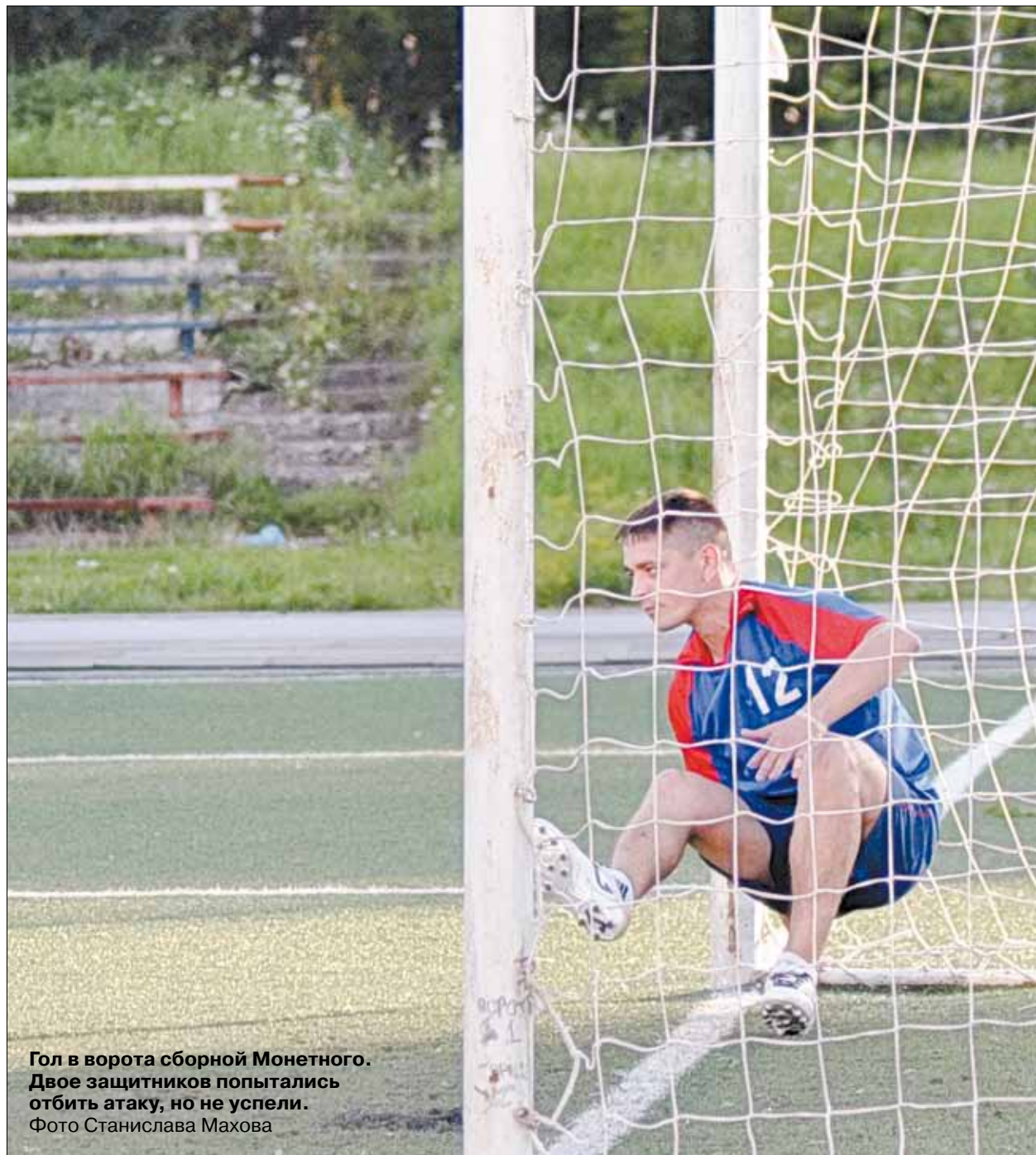
Гол в ворота сборной Монетного. Двое защитников попытались отбить атаку, но не успели.