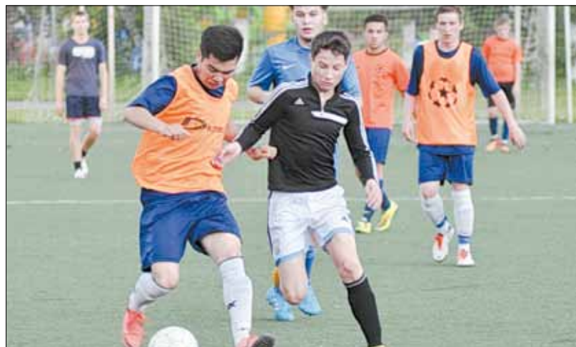
В рамках чемпионата Берёзовского. Кова