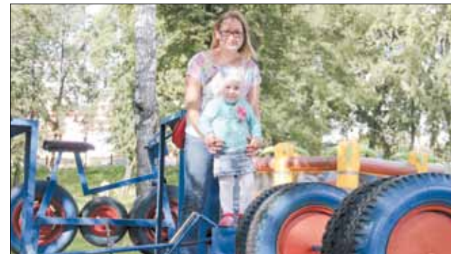
Рукотворные качели и тренажёры – очень популярное место в Историческом сквере для прогулок с детьми.