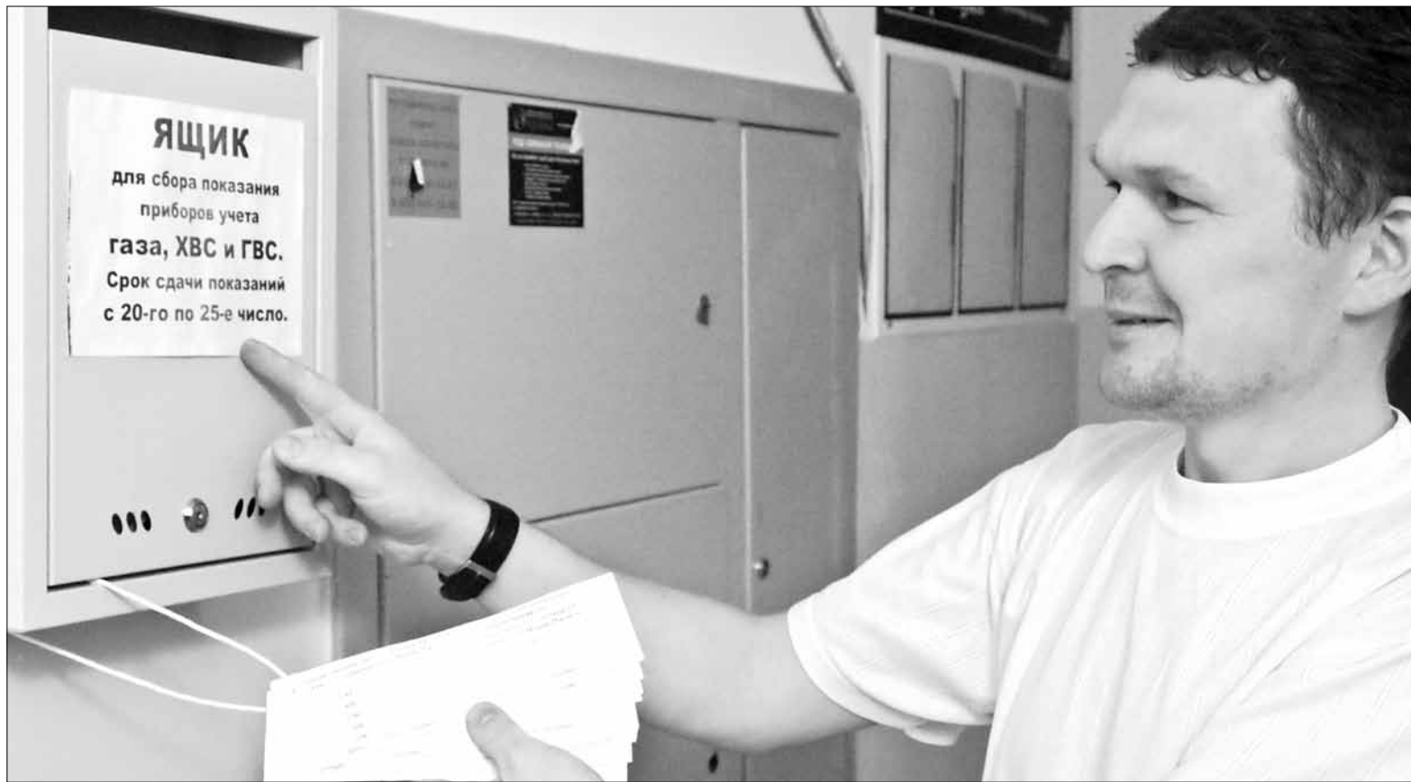
Показания индивидуальных приборов учёта жители многоэтажки опускают в ящики, установленные в подъездах. Затем члены правления ТСЖ все данные переводят в электронный вид и отправляют поставщикам ресурсов. Благодаря такому простому новшеству, удалось добиться практически 100-процентной собираемости показаний.

Ещё одна статья расходов — водоснабжение на общедомовые нужды — полностью исчезла из квитанций, приходящих собственникам восьмого дома. Те-