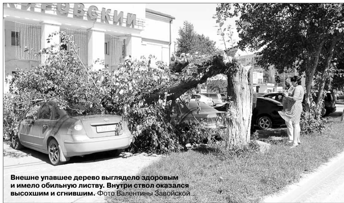
Внешне упавшее дерево выглядело здоровым и имело обильную листву. Внутри ствол оказался высохшим и сгнившим.