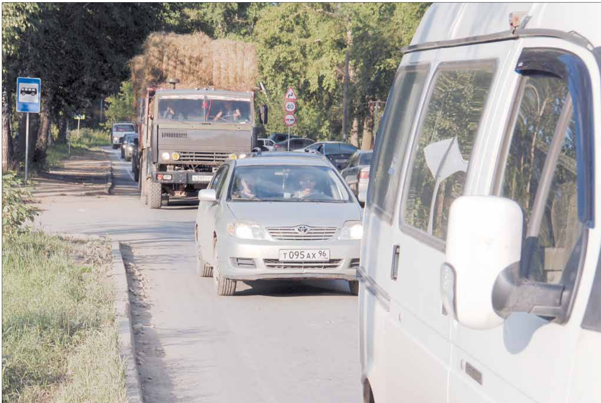
Вечерняя пробка на ул. Шиловской.