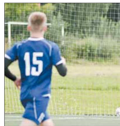
После встречи с тагильчанами «BROZEX» занимает в турнирной таблице пятое место. Отставание о