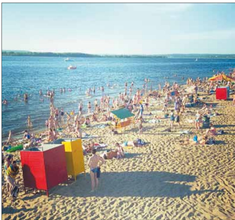
Пляжи на реке Волге в Самаре поразили друзей чистотой и ухоженностью.

мёки инспектора, уральцы сказали, что с собой у них только самое необходимое — мангал, тушёнка и деньги на бензин. В итоге сошлись на штрафе в одну тысячу рублей.