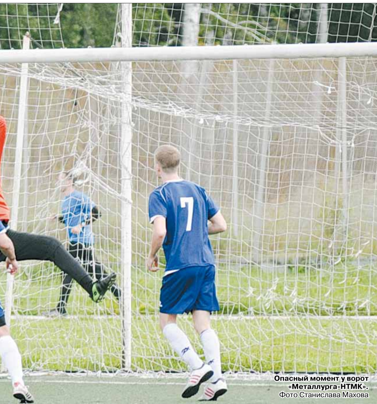
Опасный момент у ворот «Металлурга-НТМК».