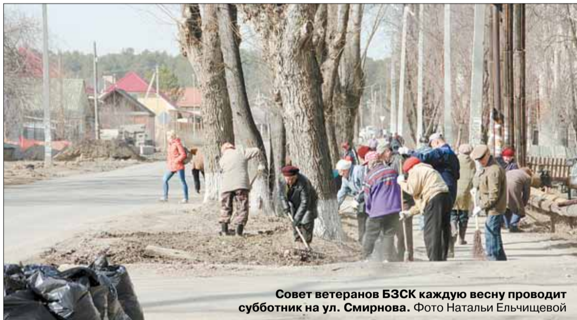
Совет ветеранов БЗСК каждую весну проводит субботник на ул. Смирнова.

От Волги и до Енисея конструкции наши нужны, И едут панели и плиты на важные стройки страны.