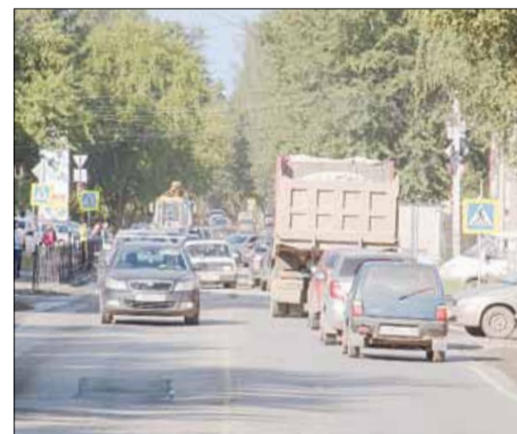
Перекрёсток ул. Гагарина и Шиловская на сегодняшний день загружен практически до предела. Изменение режима работы светофора на одном направлении может спровоцировать большие пробки на другом. Частично разгрузить дороги возможно за счёт расширения проезжей части.