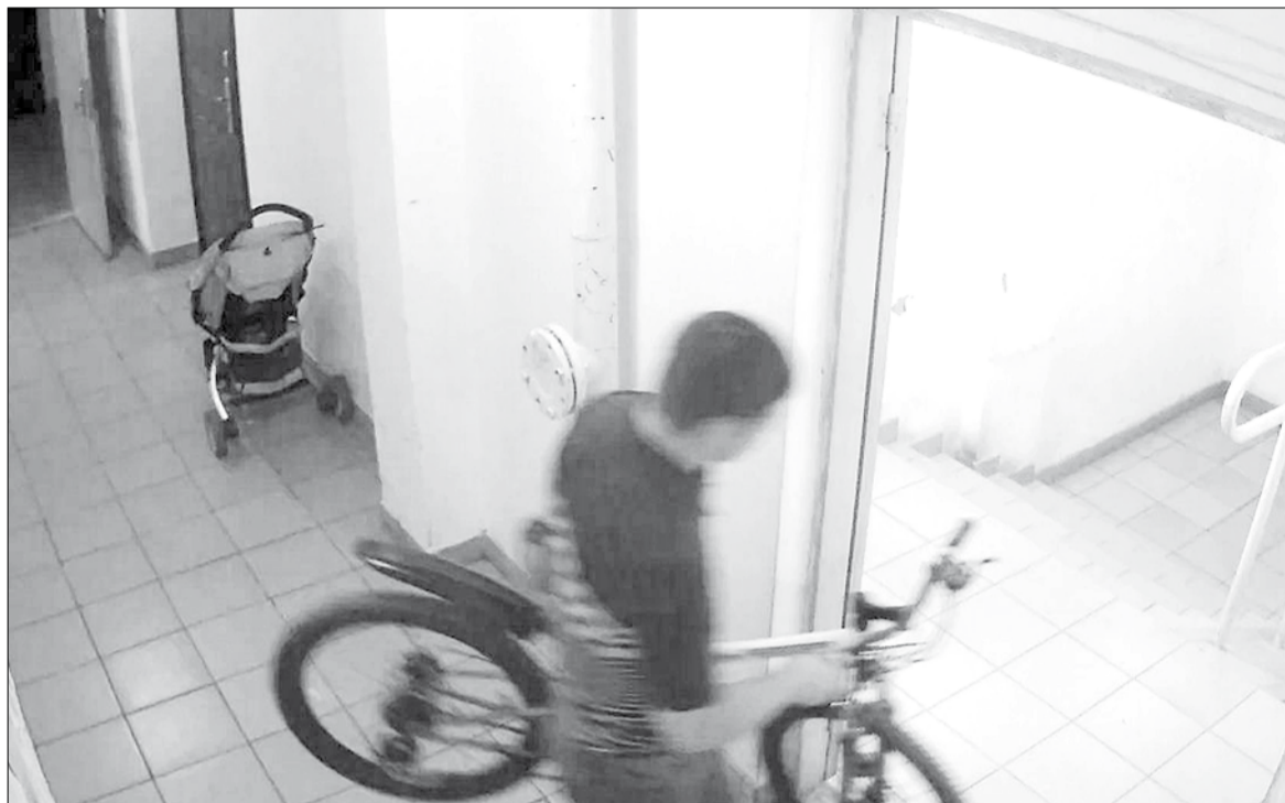
На кадрах видеозаписи с камер, установленных в подъездах домов жилого комплекса «Радужный», видно, как велосипед выносит мужчина.