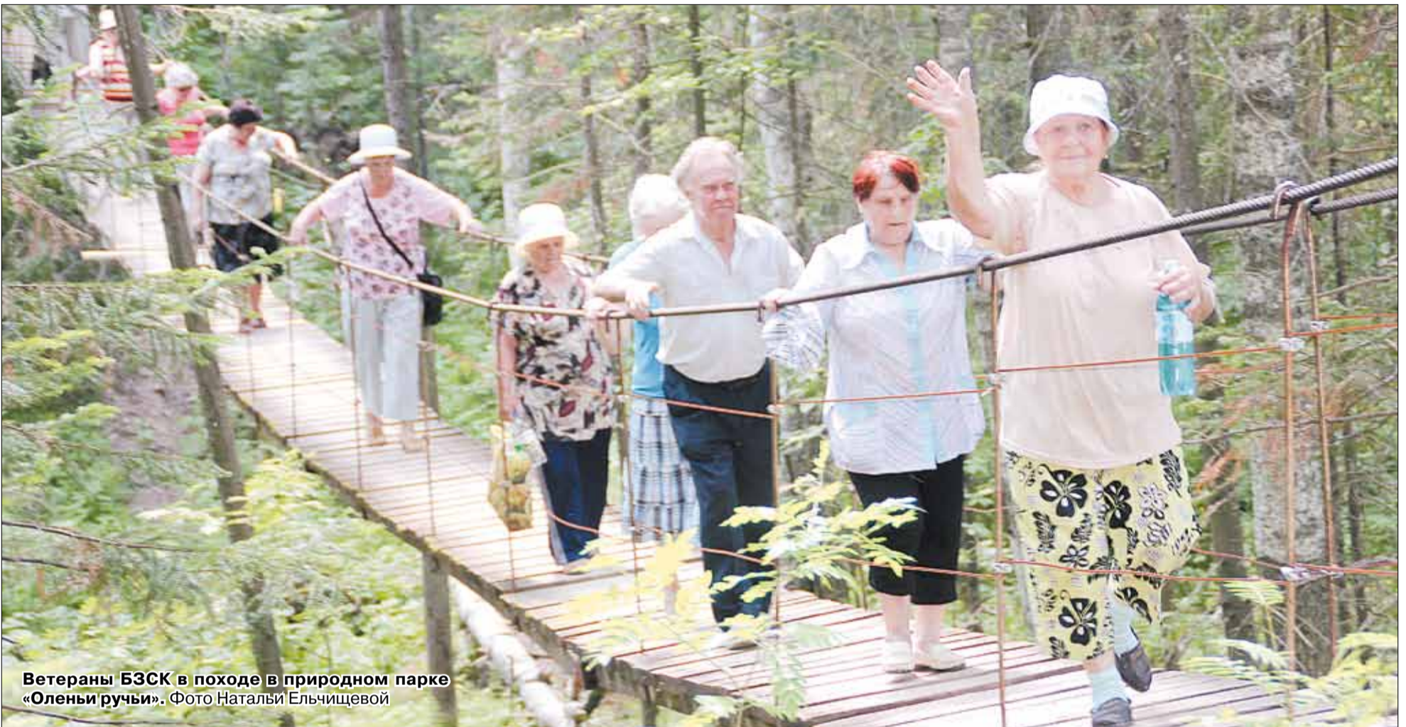
Ветераны БЗСК в походе в природном парке «Оленьи ручьи».

Тел. журналистов: (34369) 4-53-95, 8-904-982-33-11