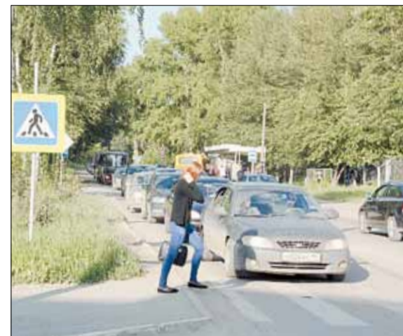
Пешеходный переход у центральной городской больницы заметно тормозит движение машин. Даже когда на перекрёстке загорается зелёный сигнал светофора, автомобили вынуждены стоять, пропуская пешеходов