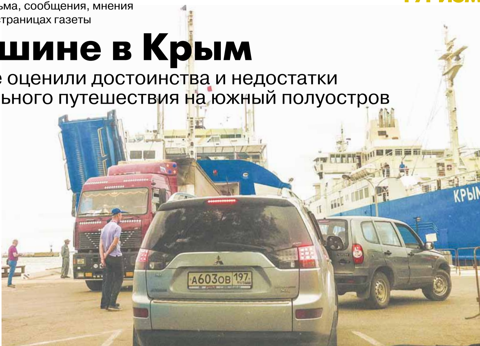
Больших очередей на паром, отправляющийся в Крым, не было. Чтобы попасть на борт, уральцы ждали не больше часа. В прошлом году ситуация была хуже — в очередях туристы простаивали по несколько часов и даже дней.

Диалог с непорядочным полицейским получился забавным. Не отреагировав на на-