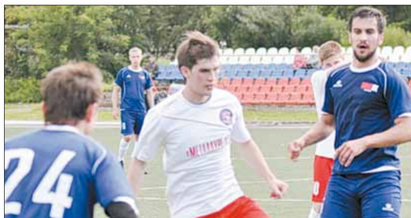
Топ лидеров чемпионата составляет девять очков