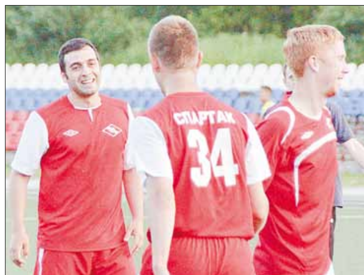
Футболисты «Спартак» радуются победе над «Родником». Счет встречи — 7:3.

Ручьи», сплывились по уральским рекам Серга и Чусовая. В планах — походы на горный хребет Шихан, сплав по реке Реж, а в конце июля берёзовские туристы отправятся на Кольский полуостров.