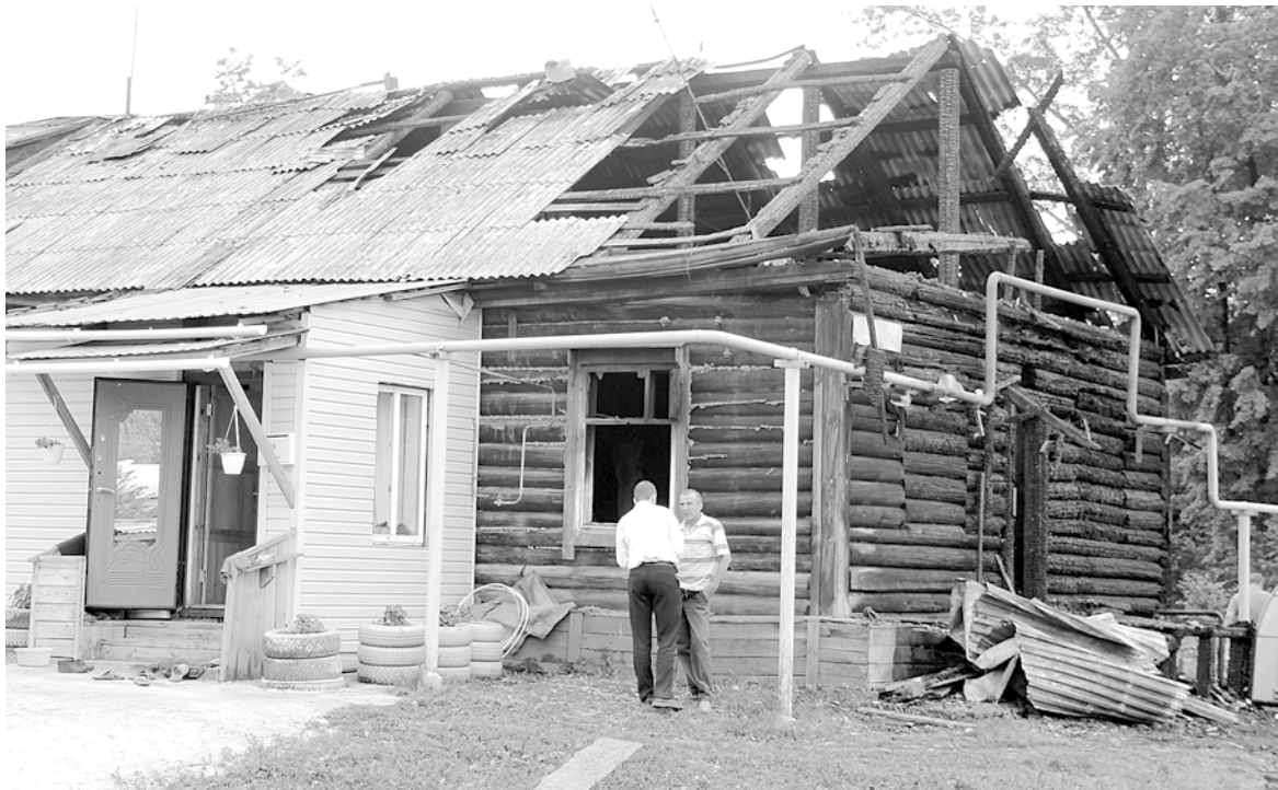
Хозяева пострадавших квартир уже на следующий день после пожара приступили к разборке сгоревших частей дома и их вывозу. Ремонтить жилье собственникам предстоит за свой счет.

лей на Театральную со стороны Успенского храма. Пока машины проезжают перекрёсток, встречное направление стоит. При прежней схеме на дороге скапливались большие пробки, самые нетерпеливые водители проскакивали на жёлтый сигнал светофора.