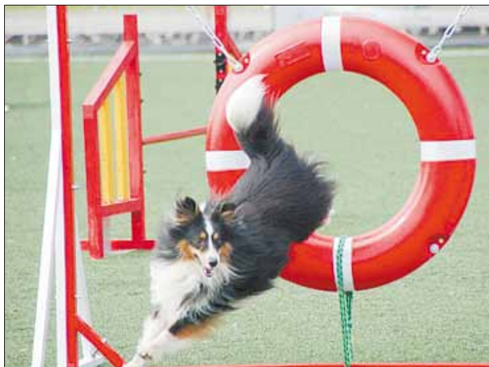
Чемпионат России по аджилити на стадионе «Горняк» в Берёзовском, 2013 год.

Тел. журналистов: (34369) 4-53-95, 8-904-982-33-11