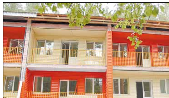
Ремонт в жилом корпусе лагеря приостановлен до осени.

Пишите: gorka-info@rambler.ru Звоните по тел. (34369) 4-53-95, сот. 8-904-982-33-11 Наш сайт: zg66.ru