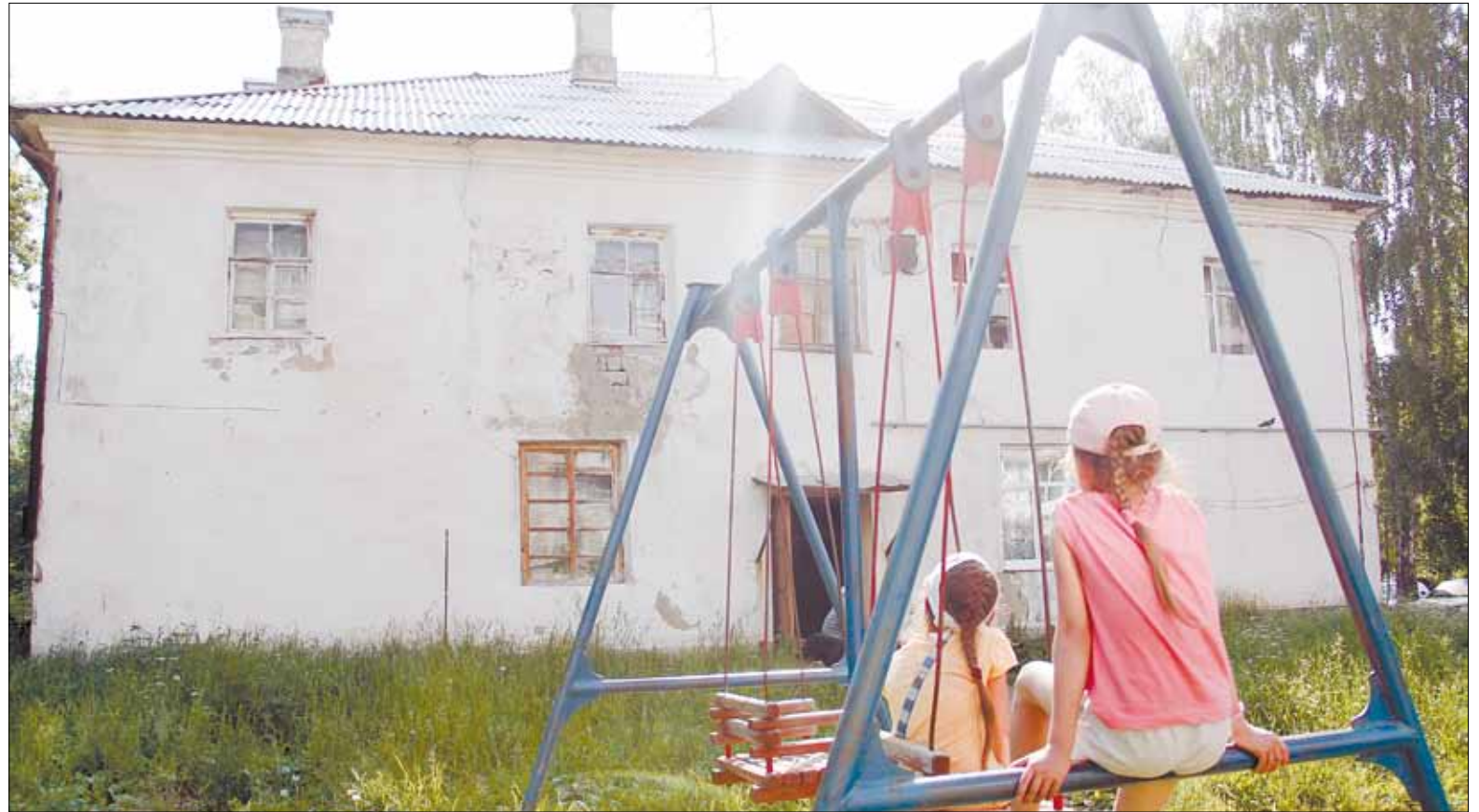
Собственников домов № 1 и 2 по ул. Советской в посёлке Кедровке чиновники наказали за неуплату взносов за капремонт, отложив этот самый ремонт в их домах еще на год. Как оказалось, в ситуации с неплатежами виноват сам региональный Фонд капитального ремонта — квитанции на уплату взносов кедровчанам доставили только в июне.

Новость об изменении региональной программы неприятно удивила жителей самого от-