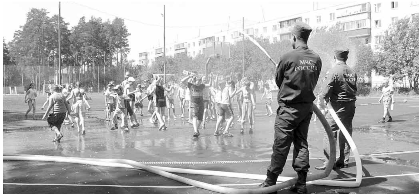
Погода в день эстафеты была настолько жаркой, что почти все ребята пожелали облиться водой из пожарных шлангов.