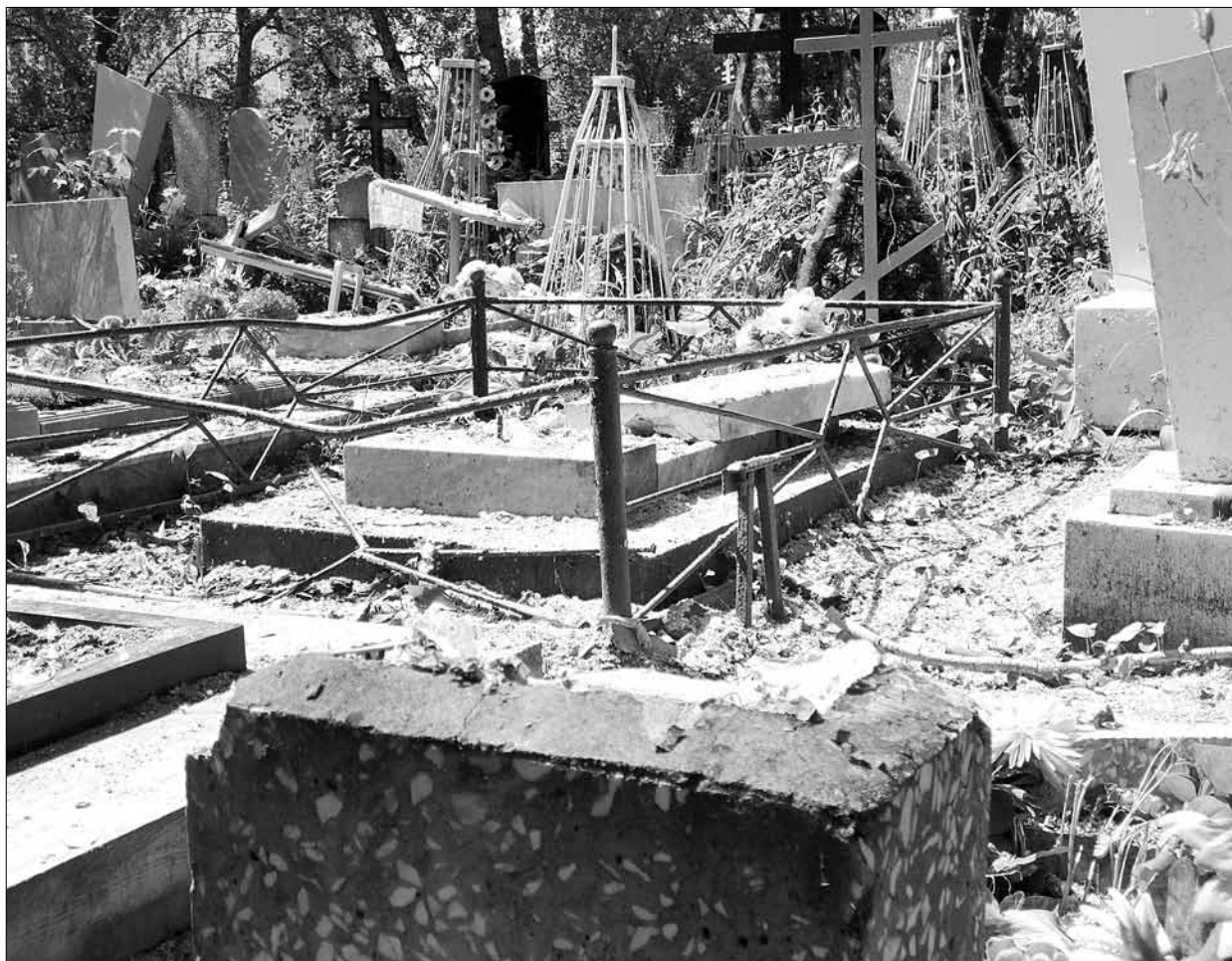
Упавшие от разгула стихии деревья серьезно повредили надгробия в разных местах центрального кладбища.