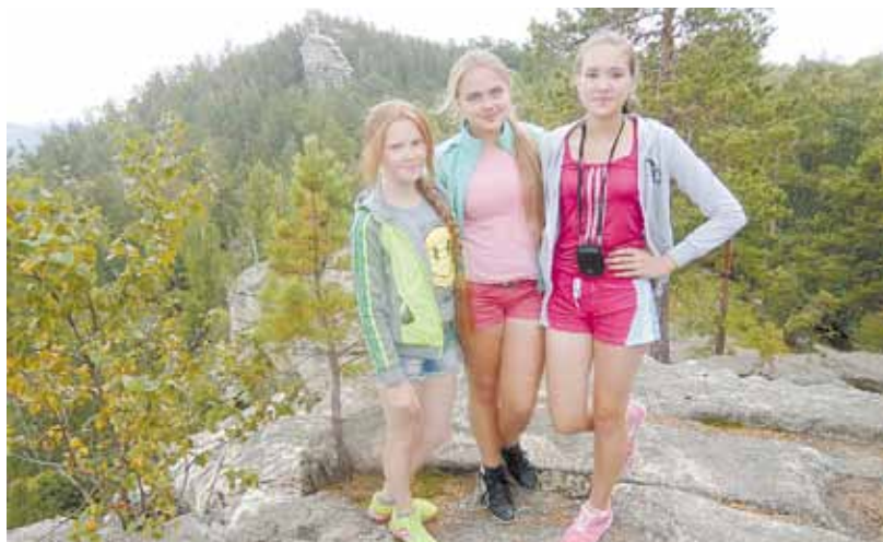
Берёзовские туристки на Аракульском шихане