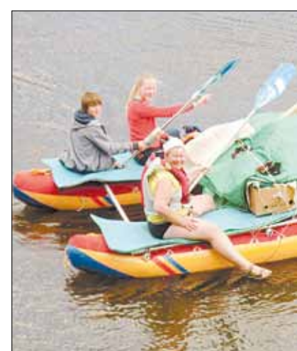
Сплав по реке Серга в июне 2014 года