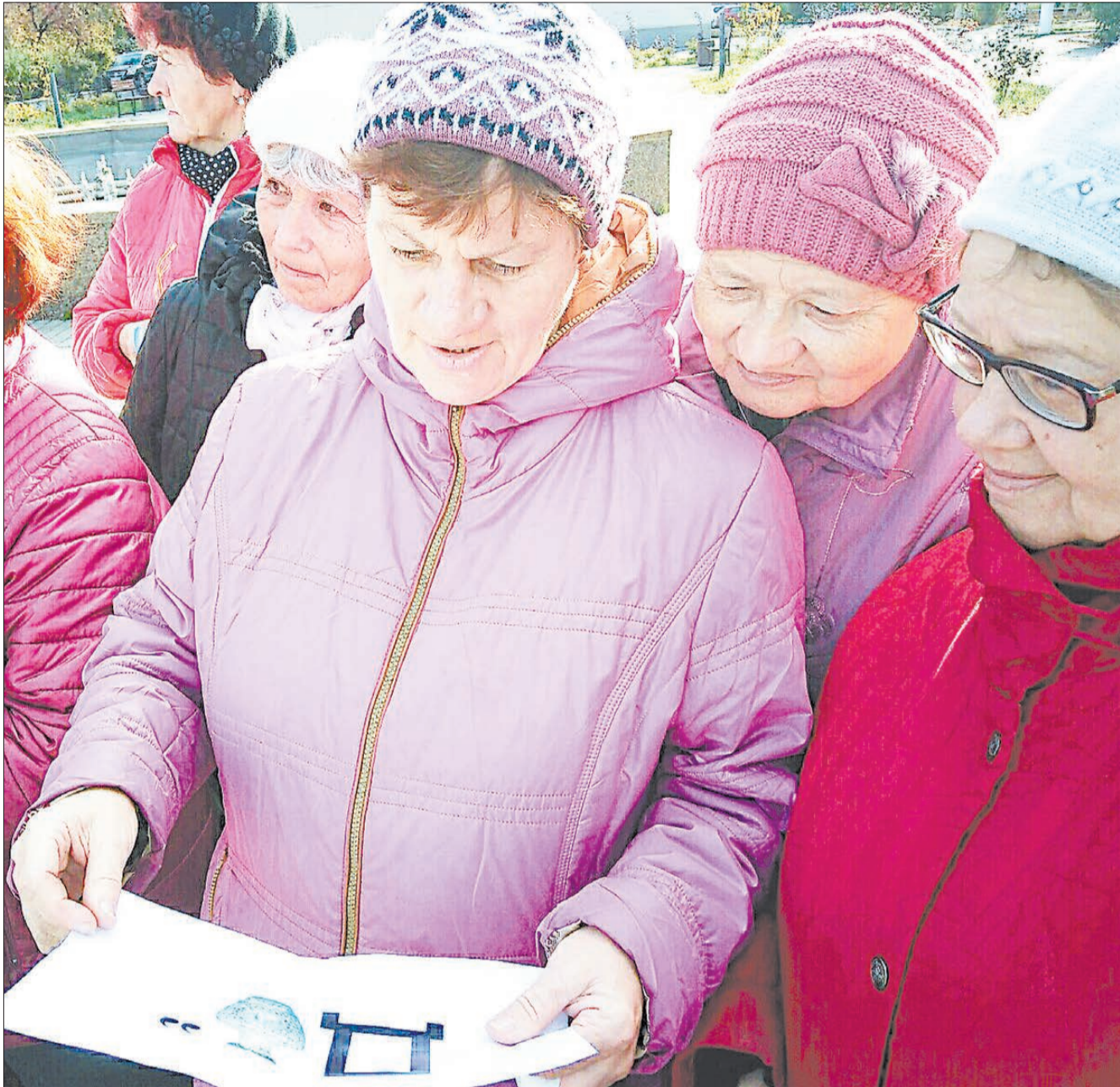
Задание на первом этапе квеста обсуждает команда берёзовского отделения Всероссийского общества слепых.