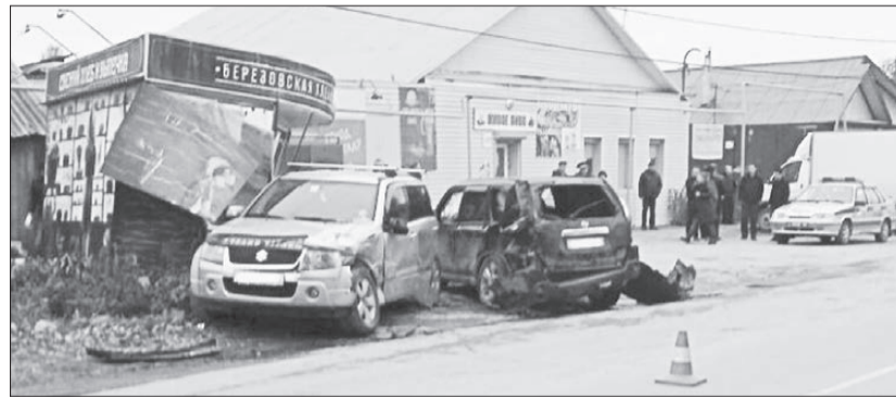
От столкновения внедорожников серьезно пострадал хлебный киоск, а продавщица отделалась испугом.

Как сообщают в отделении ГИБДД по городу Берёзовскому, виновником смерти пожилой покупательницы стал 33-летний водитель «Ниссана». Он ехал в сторону ул. Пушкина от ул. Ленина. Рулевой намеревался обогнать попутный автомобиль, но не справился с управлением. С проезжей части «Икс-Трейл» занесло вправо, и в районе продуктового магазина и хлебного киоска он вре-