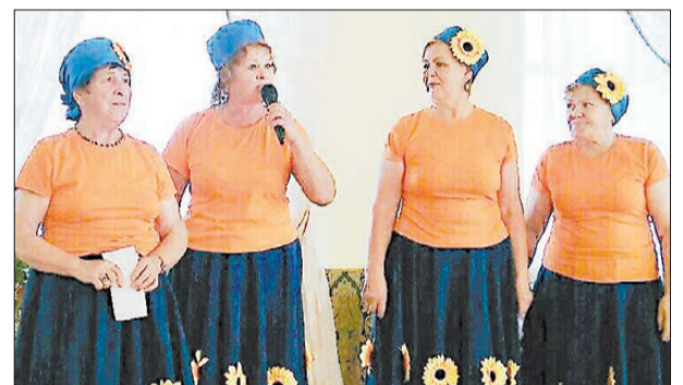
Песню на музыкальном этапе квеста исполнила команда пенсионеров из Старопышминска