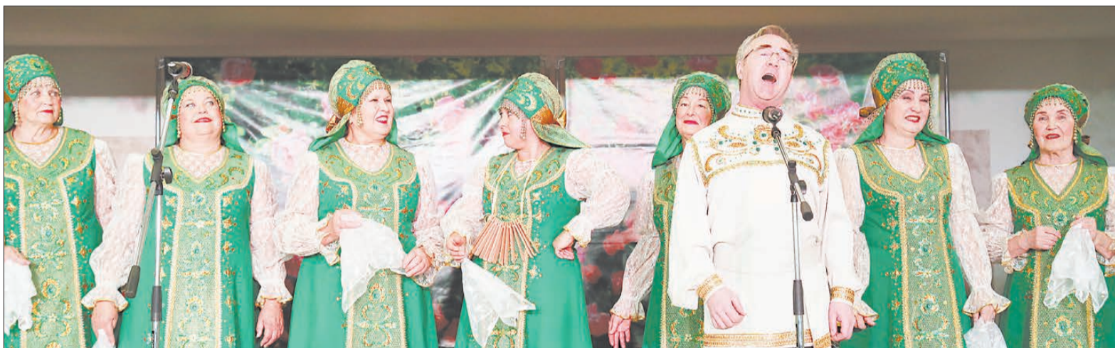
Участники хора «Уральская зоренька» пели о широкой русской душе, о любви и верности.