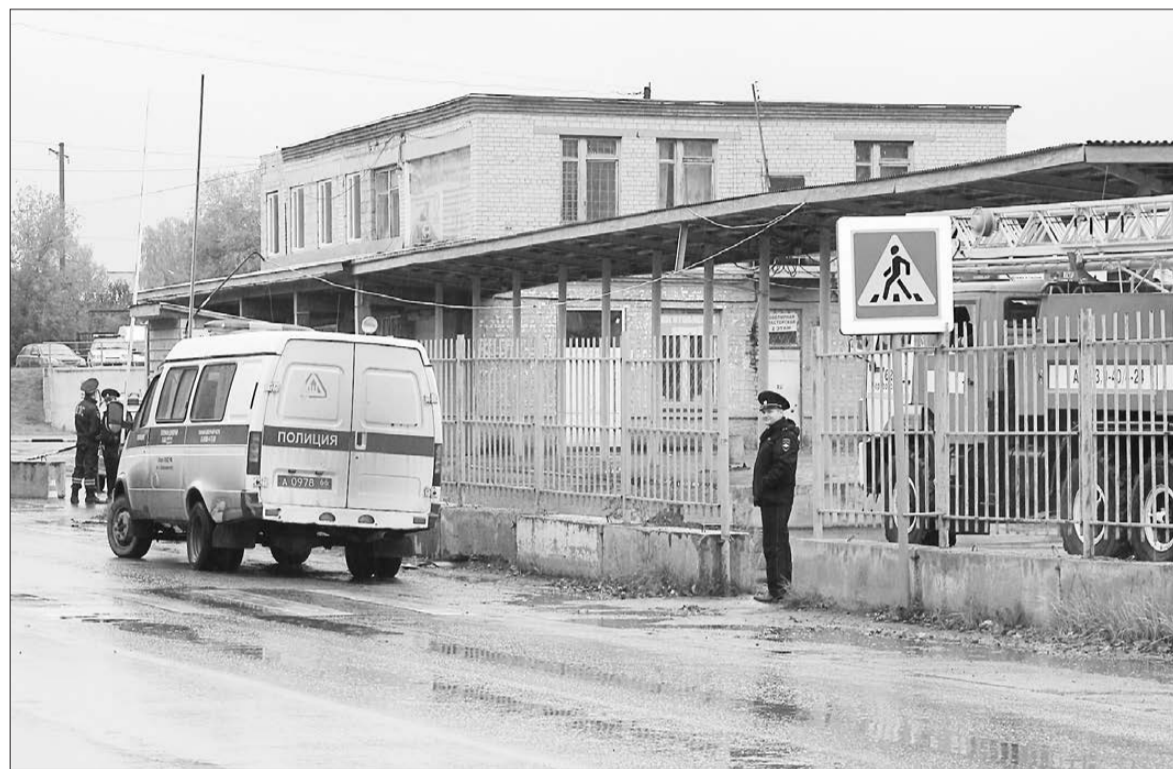
Полиция выставила оцепление вокруг территории автостанции на время проверки анонимной информации о минировании.

Также будут проиндексированы оклады председателя Думы и сотрудников его аппарата, председателя общественной палаты города.