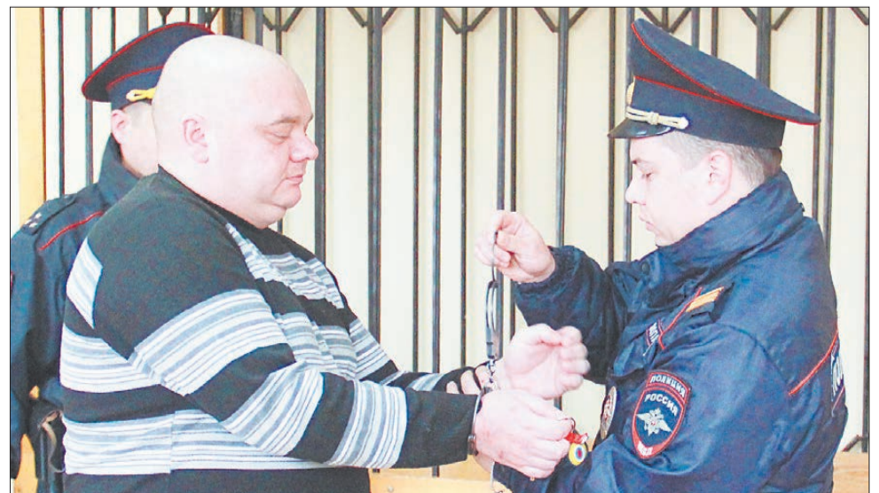
После оглашения приговора бывшего полицейского взяли под стражу в зале суда.