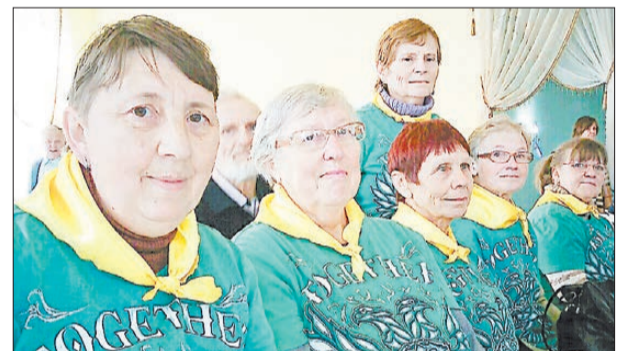
Команда «Одуванчики» поселка Ключевска.