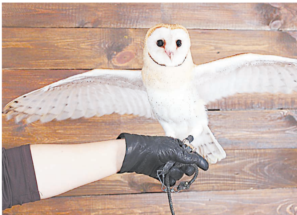
«Гадкий утенок» подрос и превратился в красивую хищную птицу. Фото справа в круге: такой сипуха была куплена в питомнике два года назад