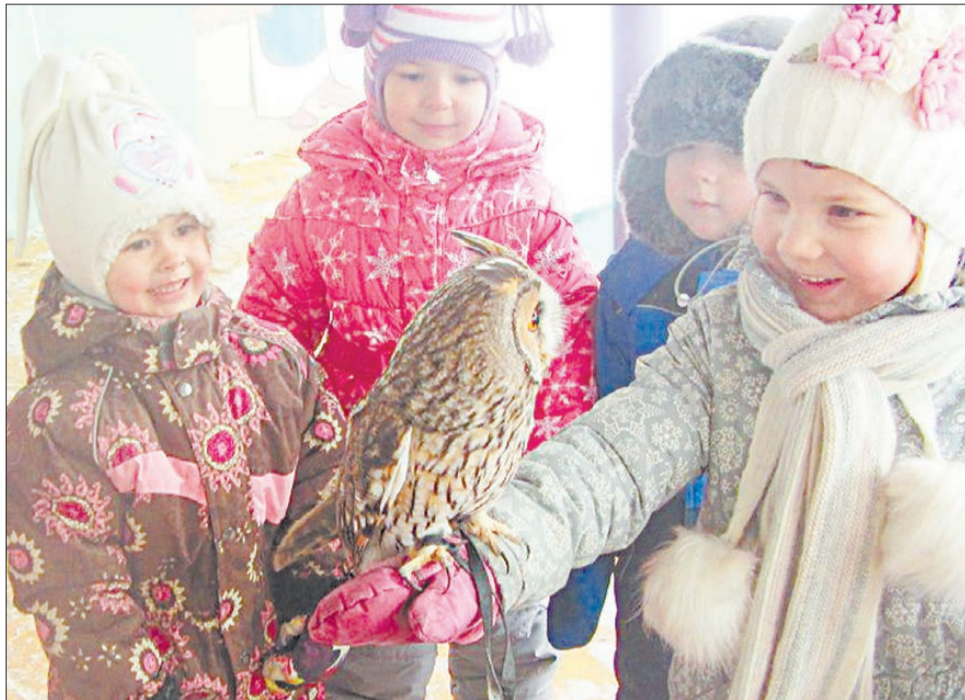
В гостях у воспитанников детского сада № 39. Малышам разрешили погладить птиц, а самым смелым – подержать их на руке