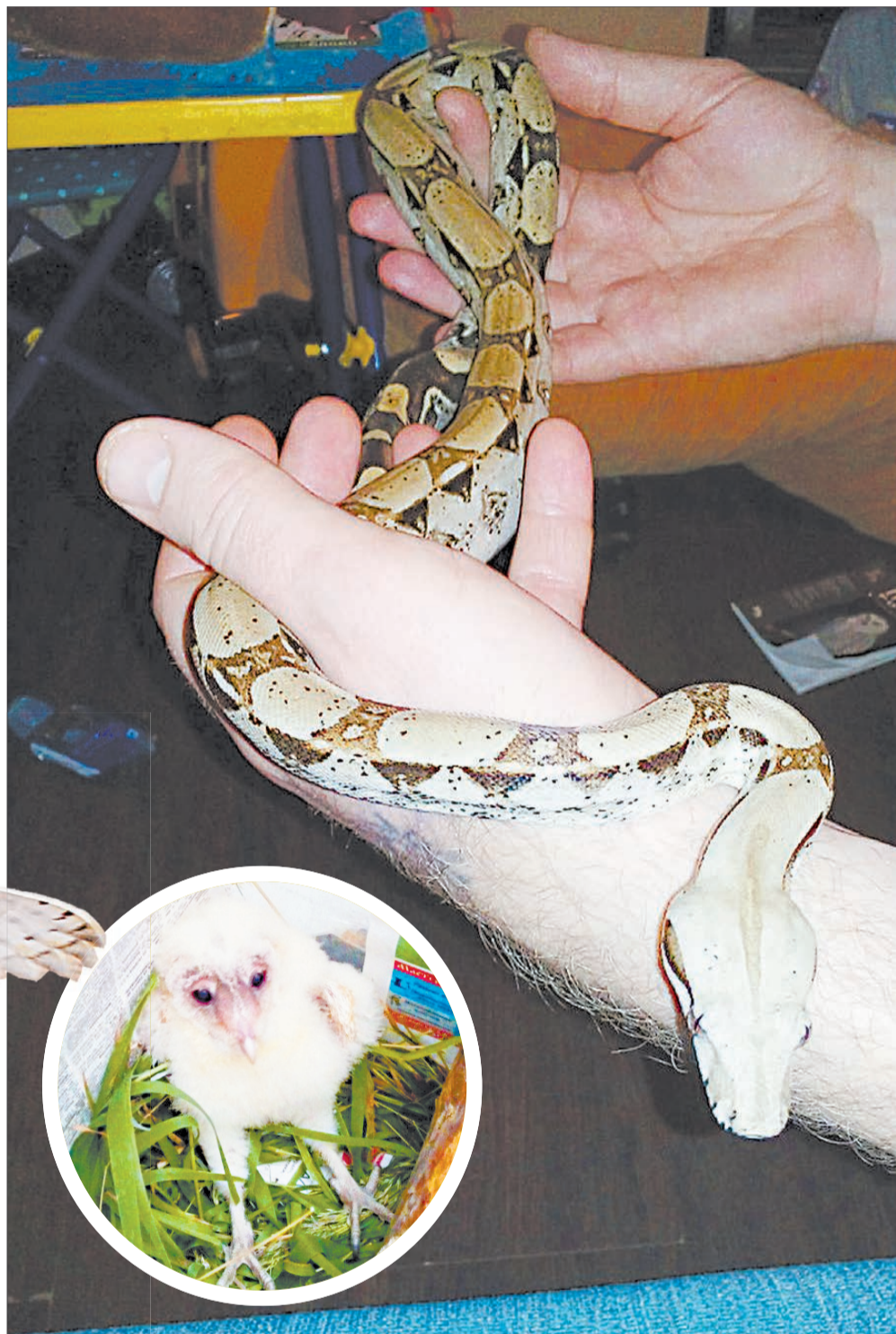
Императорский удав чаще всего лежит, свернувшись кольцом, но иногда хозяева выходят с ним «погулять» по квартире