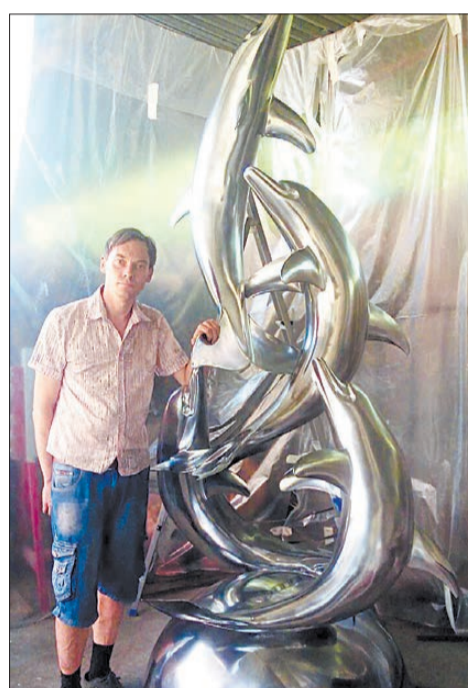
Стайку грациозных дельфинов скульптор создал в 2016 году.