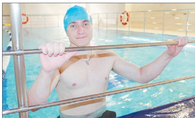
В областном реабилитационном центре. Тренировки в воде способствуют всестороннему укреплению организма и снятию стресса