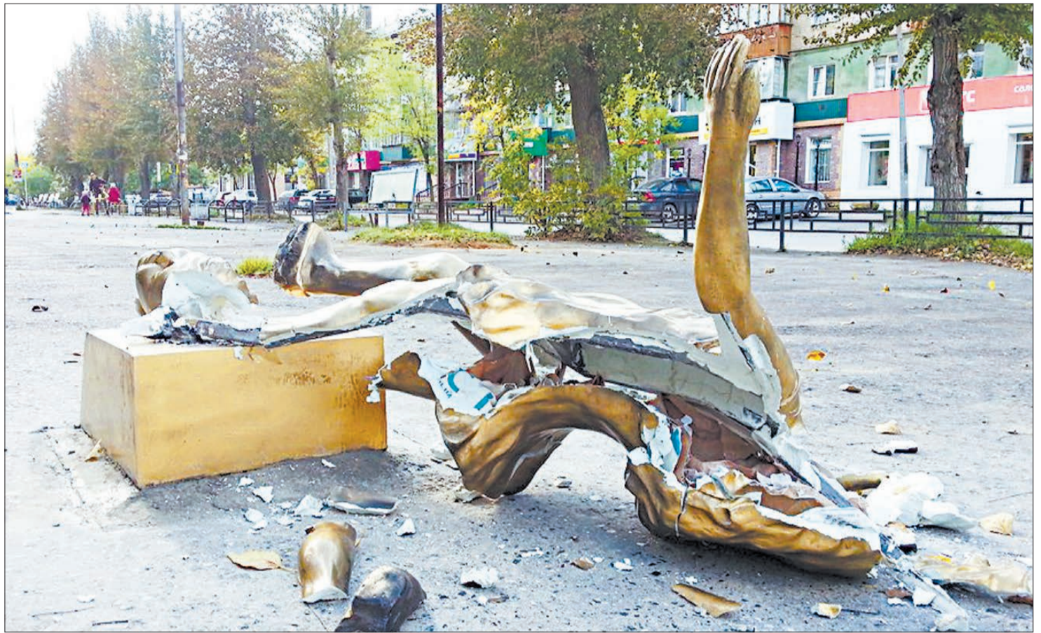
В таком виде скульптуру нашли уже на следующее утро после установки. Как отмечают очевидцы, на улице в ночь с 16 на 17 сентября на улице было много людей — погода благоволила прогулкам.

Немало оказалось и тех, кто был удивлен хрупкостью скульптуры. Их мнение таково: если уж ставить что-то на улице — то это должно быть что-то железобетонное во всех смыслах слова, а тут — сами виноваты. Отчасти это справедливо: учитывая, что город состоит из одних только интеллигентов, снимающих шляпу друг перед другом, то стоит заранее думать о том, чтобы обезопасить объект уличного искусства. Когда взялись за поиск вандалов, оказалось, что ни на одну камеру уличного видеонаблюдения они не попали, и теперь вся надежда — на очевидцев, случайных свидетелей. Сама девочка была выполнена из сплава на основе белого цемента, разгромить ее оказалось не так уж трудно. А кто приложил руку к этому — подростки без мозгов или наполненные горячительным взрослые — дело вторичное.