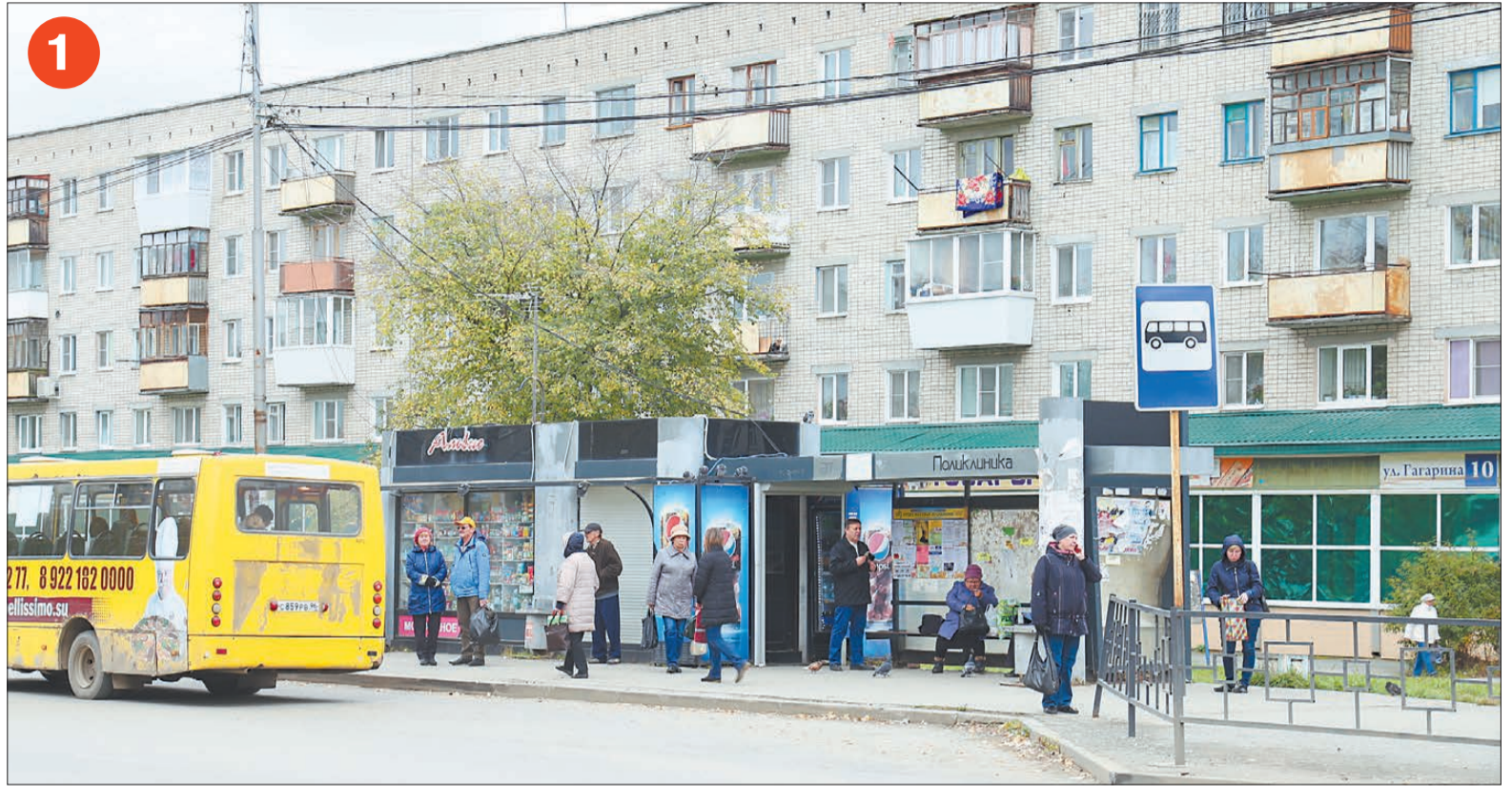
1 Торговый павильон на остановочном комплексе «Поликлиника» у торгового центра «Советский».

Торговля в остановочных комплексах до сих пор не прекращается. Продавцы ссылаются на перешедшие к ним права на имущество, но документами это подтвердить не могут. И остановки, и павильоны построены на частных день-