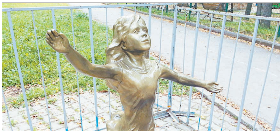
Открытие памятника в екатеринбургском парке имени Маяковского состоялось с еще большим размахом, чем в Берёзовском. Многие люди в интернете посмеялись над оградкой вокруг девочки — временной мерой защиты от вандалов.