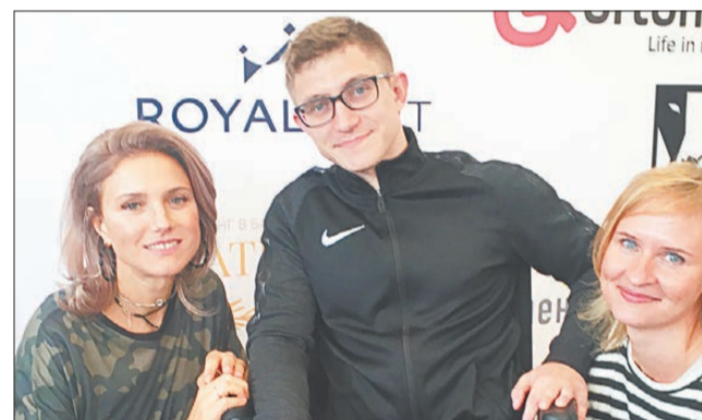
Поддержать необычных спортсменов на фестиваль приехали звезды: Сати Казанова, Анна Седокова, Ирина Тонева (слева)