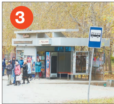
3 Остановка «Музыкальная школа» по ул. Театральной возле Культурного сквера