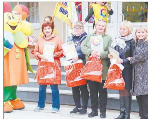
Дипломы и подарки получают руководители предприятий сферы потребительского рынка

«Цветочные россыпи», «Цветочные мастера», «Цветущая детская площадка». Вот команда из детского сада № 9.