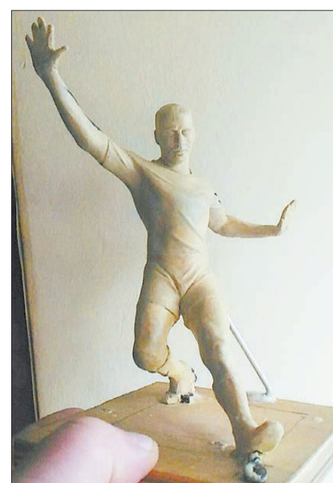
Прежде чем приступить к полномасштабному производству искусства, скульптор создает его макет