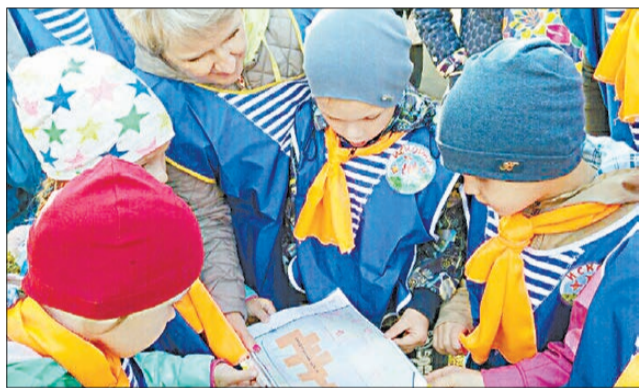
Команда «Искорки» детского сада № 41 обсуждает маршрутный лист турслета