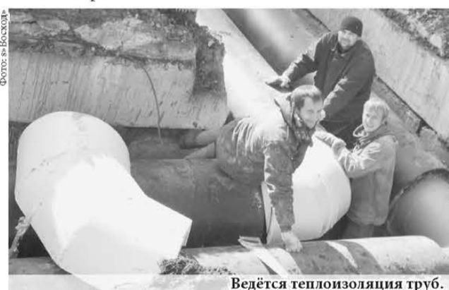
Ведётся теплоизоляция труб.

На главный вопрос «о парилке» специалист ответил, что свою работу они выполняют качественно и отвечают за неё стопроцентно. Проблема горожан решается, а это значит, что власти действуют в правильном направлении теплосбережения.