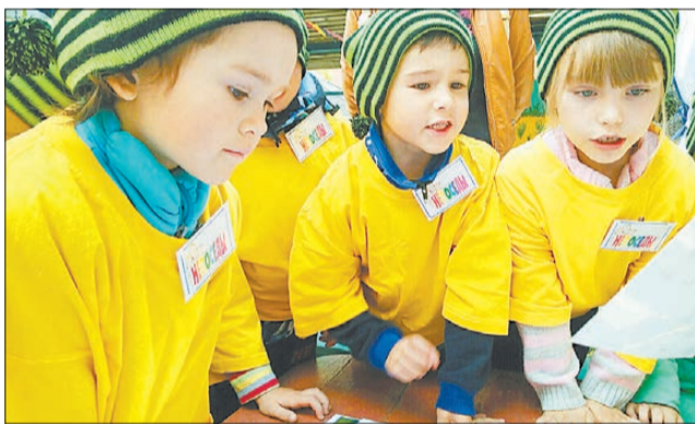
Ребята из команды «Непоседы» детского сада № 11 решают задание по знакам на карте