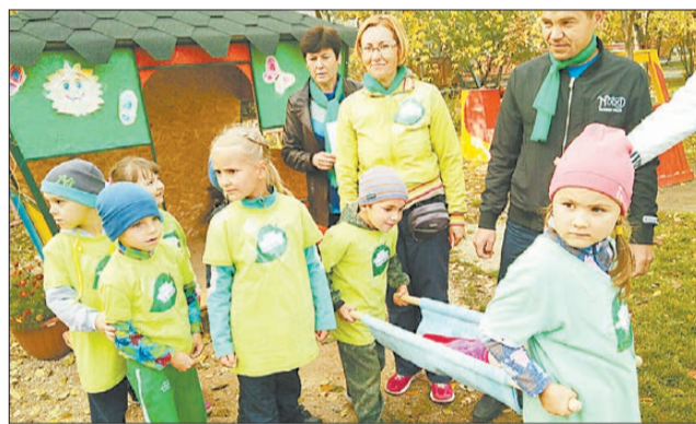
Команда «Эколята» детского сада № 13 на старте этапа «Первая помощь».