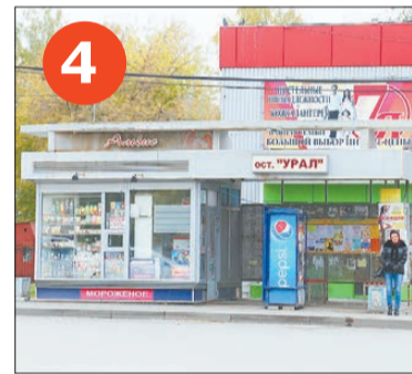
4 Павильон на ул. Ленина — остановка «Урал» со стороны Исторического сквера