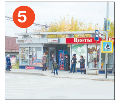
5 Павильоны на остановке «Ул. Кирова» — со стороны супермаркета «Кировский»