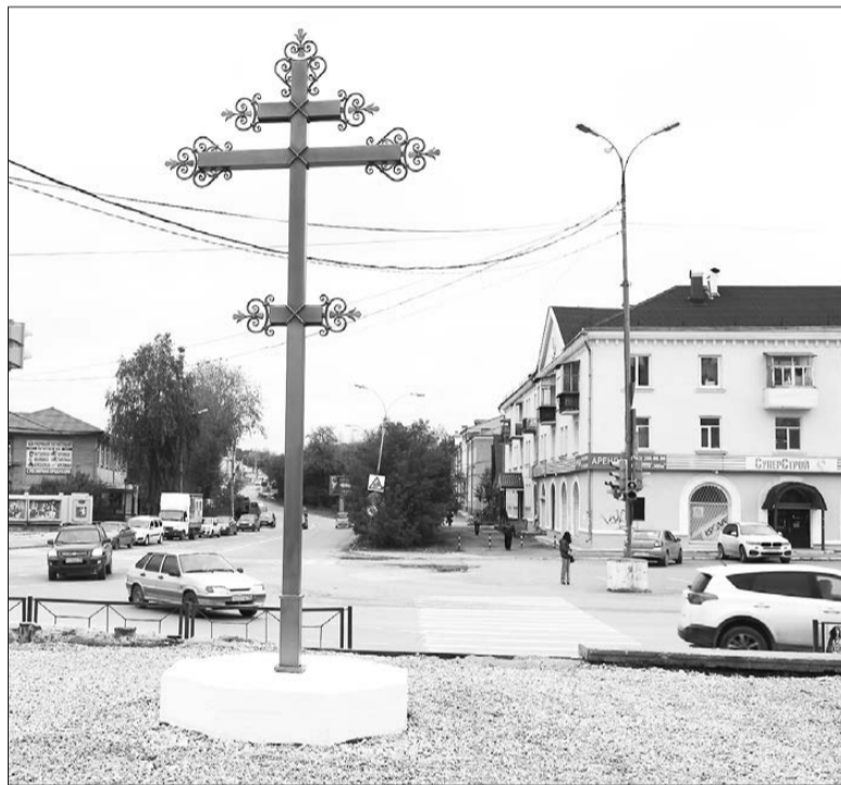
Поклонный крест появился на месте снесенной Пророко-Ильинской церкви при Берёзовском заводе

— Поклонный крест... тогда понятно! Но ныне это место, на мой взгляд, совершенно не под-