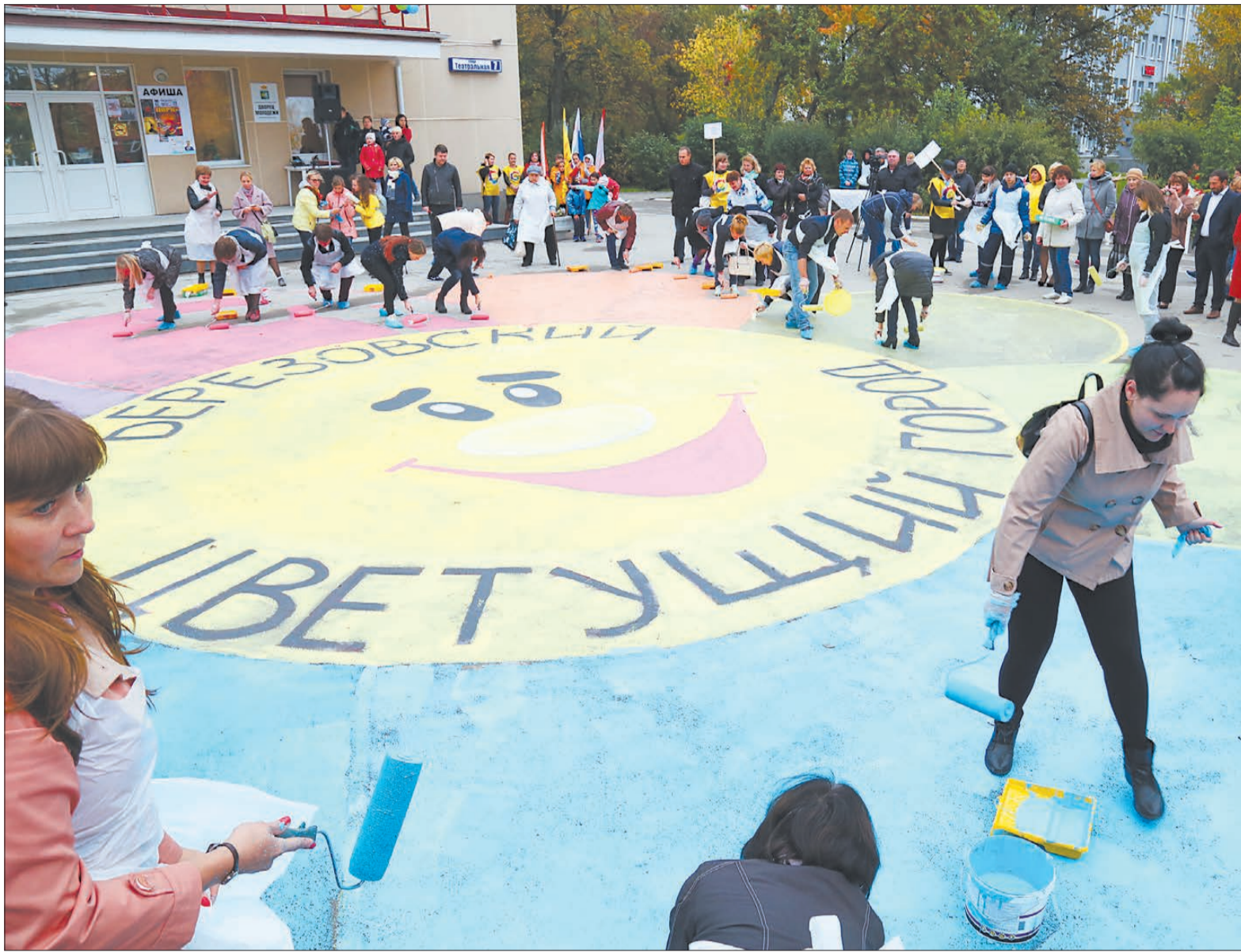
Шесть команд и организаторы конкурса «Цветущий город» перед подведением итогов раскрасили лепестки символа конкурса на асфальте.

– Жители нашего поселка регулярно получают награду на этом конкурсе. Знаете, сколько фантазии и труда вкладывают люди в свои композиции?! – делится Галина Ивановна.