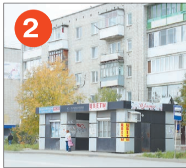
2 Павильон на ул. Гагарина со стороны центральной городской библиотеки