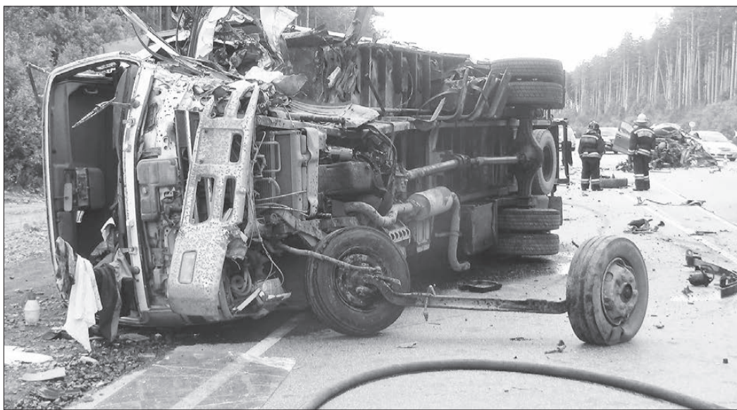
Место аварии со смертельным исходом.

Также похитители поработали в коттеджном поселке Становлянка. В строящемся доме сломали окно, влезли внутрь и увели восемь радиаторов отопления, электрический бойлер, болгарку «Макита», перфоратор «Стартус», три насоса отопления «Вита». Общий ущерб составил 60 тыс. руб. Кража произошла в период с половины седьмого вечера 24 июля до девяти утра 25 июля. Полиция разыскивает подозреваемых.