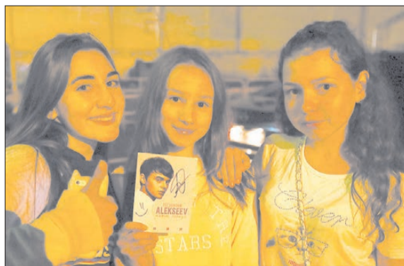
Ученицам школы № 2 и гимназии № 5 удалось получить заветный автограф и фото с кумиром.