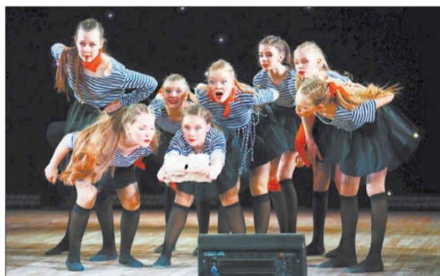
Международный фестиваль-конкурс творческих коллективов «Уральский калейдоскоп», 2017 год.