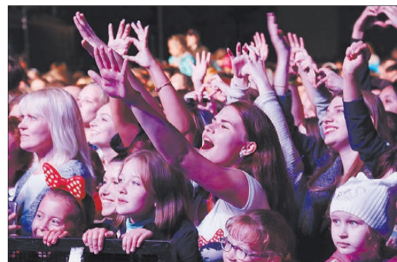
После концерта поклонницы больше часа ждали возможности сфотографироваться со звездой и получить его автограф