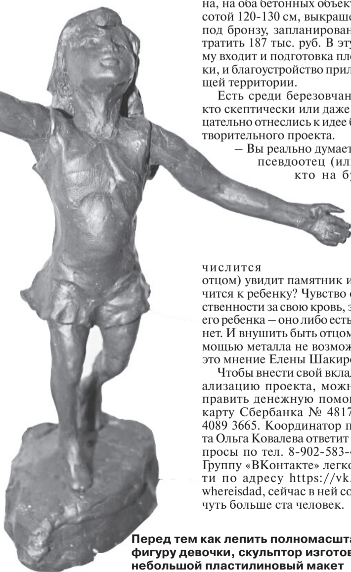
Перед тем как лепить полномасштабную фигуру девочки, скульптор изготовил небольшой пластилиновый макет

На вечер 14 августа за третий вариант в открытом голосовании на странице проекта «ВКонтакте» проголосовало большинство — 100 человек из 236 (42%). 83 проголосовавшим (35%) понравилось место около кафе, 53 человека (23%) высказались в пользу Новоберёзовского микрорайона.