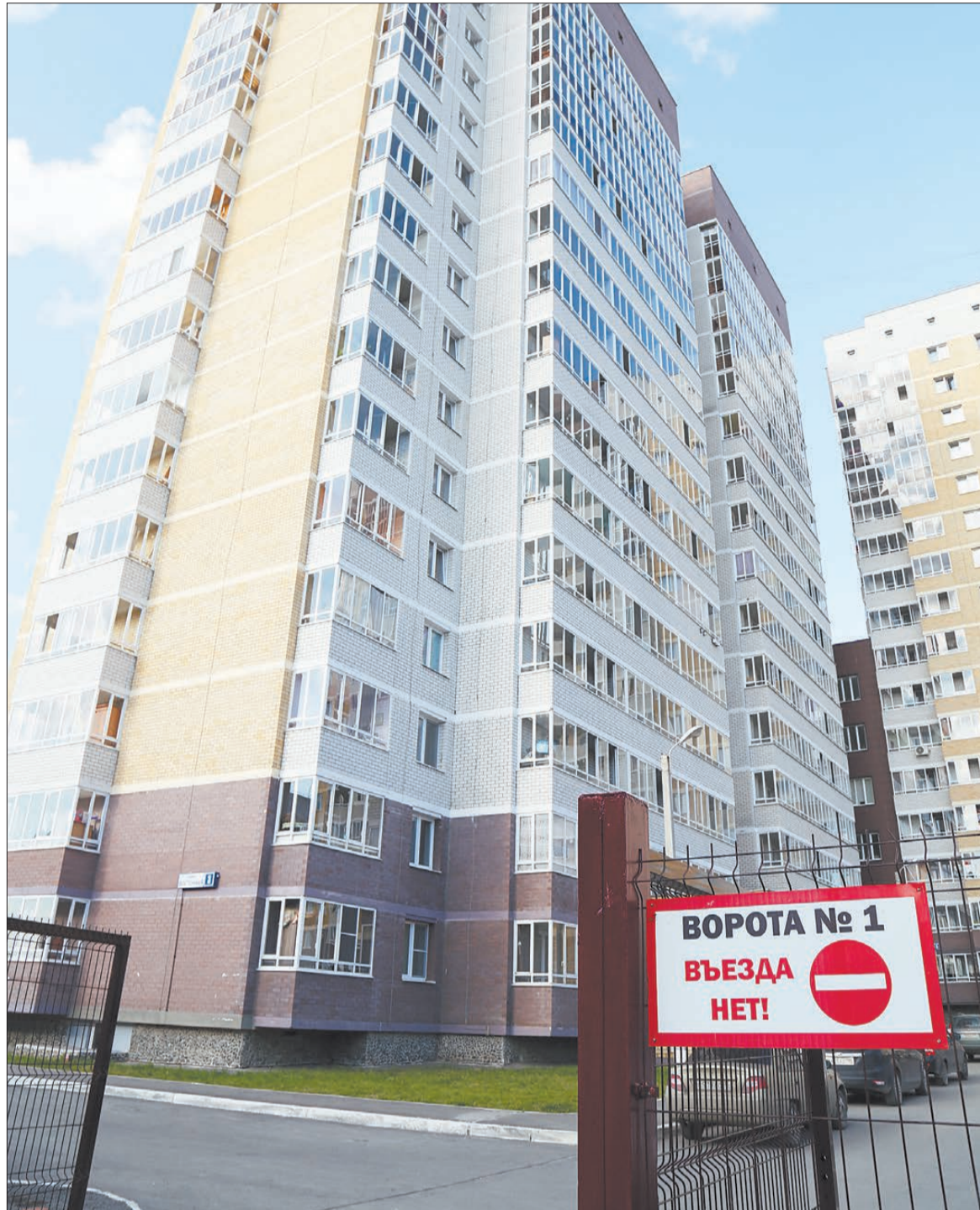
Смена руководства УК «Актив» коснулась 450 квартир «Центрального парка», всего же новый жилой комплекс в Берёзовском насчитывает более 1400 квартир

Отстраненный директор уверяет, что под её началом УК доставляла немало бонусов застройщику, устраняя гарантийные недостатки по электрике, сантехнике и мелкой отделке. Но в самой стро-