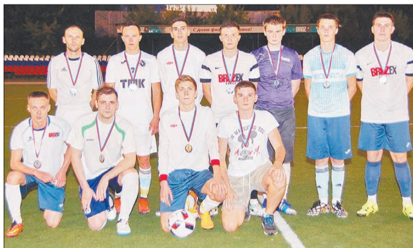
Команда «Брозекс» поднялась на второе место в городском кубке.