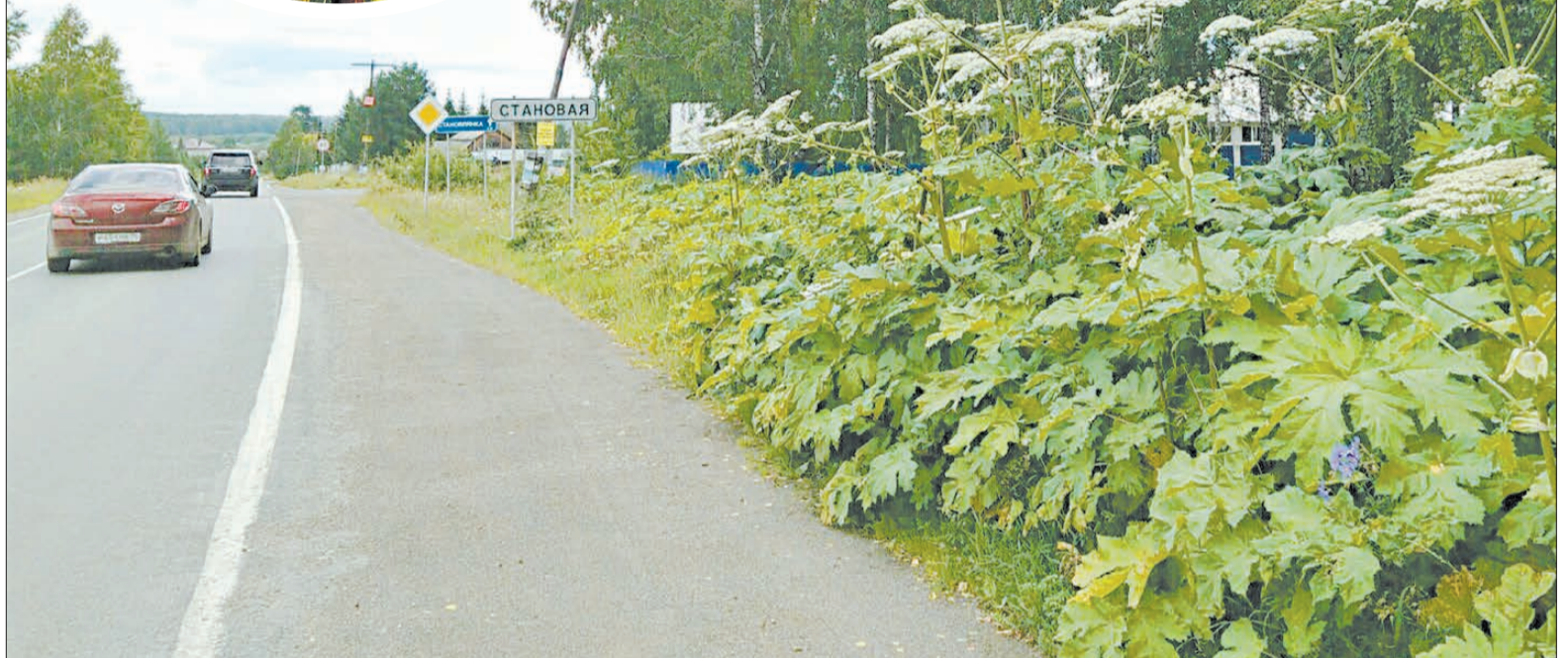
По обочинам почти всех дорог вокруг Берёзовского растёт опасный для людей борщевик Сосновского. Он уже заполнил бесхозные поля.