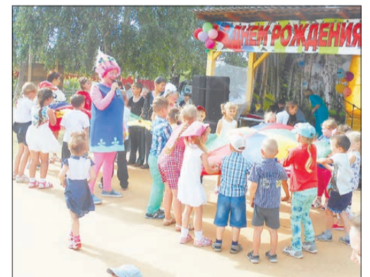
Многие дети поселка пришли на главную площадь, чтобы поучаствовать в развлекательной программе

— Сколько каши наготовили? — спрашиваем.