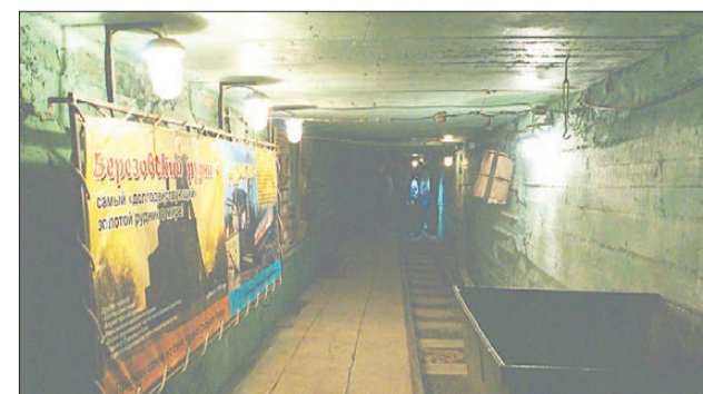
В уникальном подземном музее можно увидеть, как раньше в Берёзовском добывали золото

Пишите: gorka-info@rambler.ru Звоните по тел. (343) 237-24-60, моб. 8-904-982-33-11 Наш сайт: zg66.ru