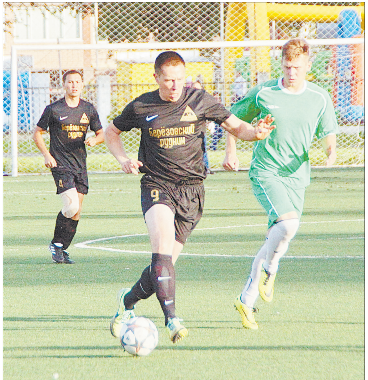
В ходе всего матча инициативой владели игроки «Горняка», соперник отвечал редкими контратаками.

Тренер наших лыжников Геннадий Берсенев отмечает, что соревнования прошли на высоком уровне, и трасса по профилю хорошая. Один лишь недостаток: она для таких состязаний достаточно узкая, поэтому при обгонах часто возникают неудобства.