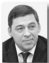
Евгений Куйвашев, глава Свердловской области:

Кроме того, 12 муниципалитетов получили в совокупном объёме 1,2 миллиарда иных межбюджетных трансфертов на строительство, реконструкцию, капитальный ремонт, ремонт автодорог местного значения».