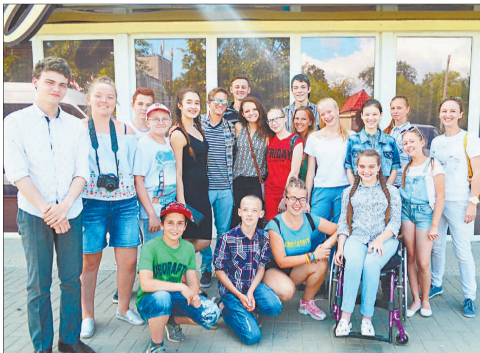
Американские школьники, волонтеры «Искорок добра» и юные журналисты «АйсбергТВ» за день сдружились.

да зазвучали частушки под балайку, американские школьники вместе с волонтерами пустились в пляс. Тут же на лужайке вместе со всеми были и ребята с ограниченными возможностями здоровья, они тоже участвовали в играх и пробовали угощения. Замечательно, что мероприятие было открыто для всех: постепенно к библиотеке подходили жители окрестных домов, прохожие с детьми, люди вышли на балконы и живо интересовались происходящим. Все желающие участвовали в играх и конкурсах, угощались чаем и общались.