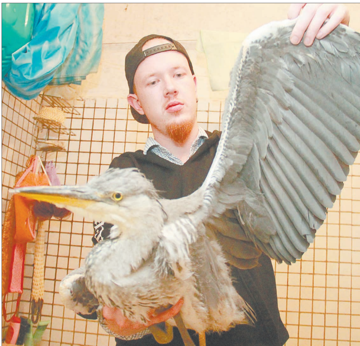
Кирилл Липин изначально предполагал, что цапле вряд ли удастся выжить после приключений в городской черте, но несмотря на это прилагал все усилия, чтобы спасти птицу.