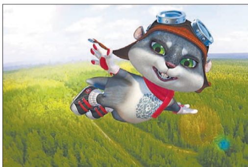
Такой вот забавный персонаж представляет Висимский заповедник как эталон природы Среднего Урала