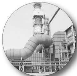
Сдан в эксплуатацию участок по производству глинозема на Уральском алюминиевом заводе