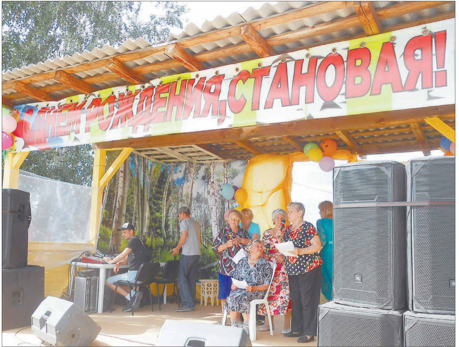
Самодельный хор ветеранов выступил перед односельчанами с песней собственного сочинения и пожелал всем здоровья и хорошего урожая.