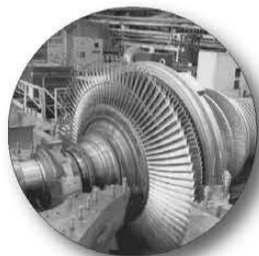
Парогазовая установка мощностью 420 МВт на Верхнетагильской ГРЭС