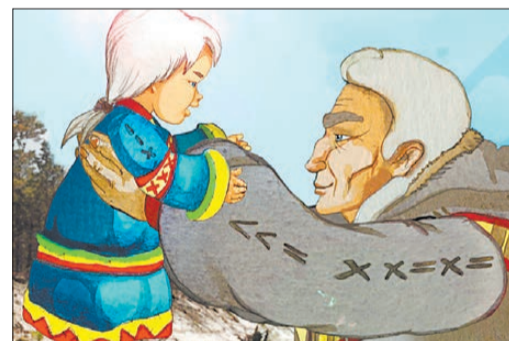
«Маленькая Катерина» — мультфильм необычный. Он вместил в себя и анимацию, и кадры документального кино

нии в свою домашнюю студию Малышев поправил этот кусочек.