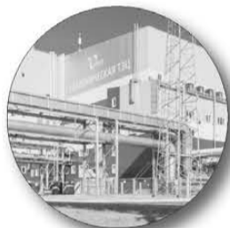
ТЭЦ «Академическая» в Екатеринбурге