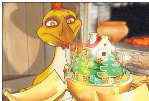
Кадр из «Рябы». Режиссер уверен: мульт может быть смешным или вызывать грусть