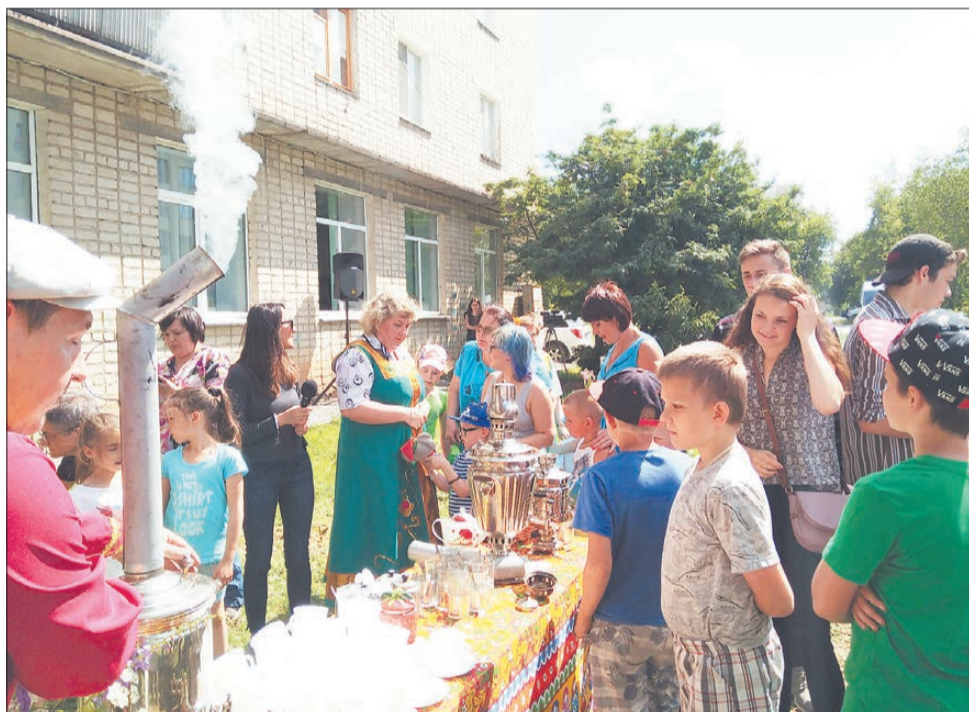
На «Самовар-пати» пришли жители соседних домов, а гости учили слово «ватрушка».