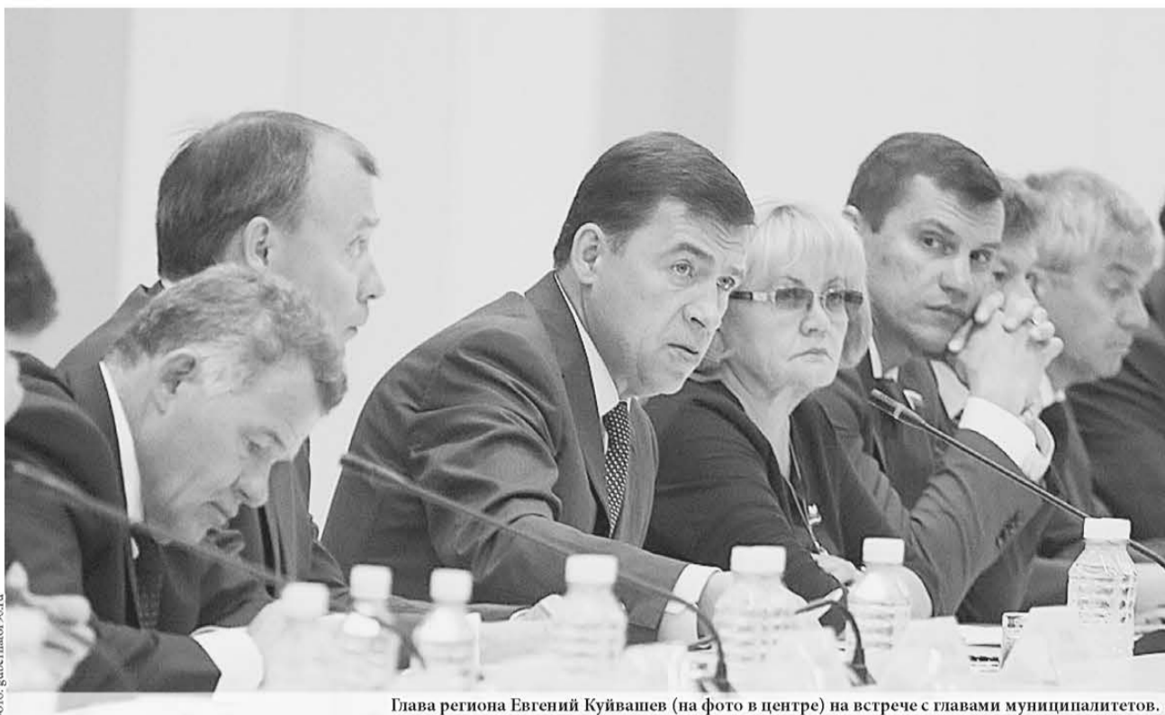
Глава региона Евгений Куйвашев (на фото в центре) на встрече с главами муниципальных образований.

Он поручил главам муниципалитетов довести до жителей информацию о личных приёмах граждан членами правительства, в том числе, с возможностью использования видеосвязи.