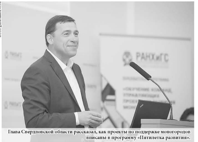
Глава Свердловской области рассказал, как проекты по поддержке моногородов вписаны в программу «Пятилетка развития».