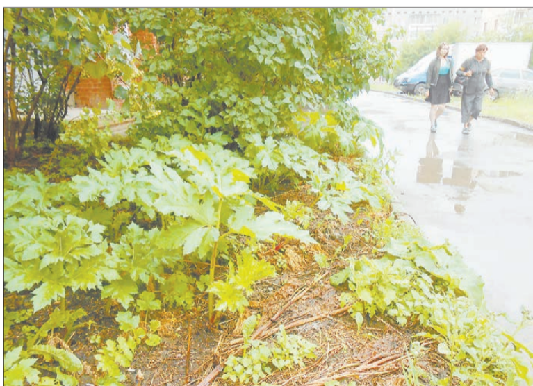
Борщевик уверенно захватывает городские газоны и растёт прямо у подъездов.

Если с медицинской помощью всё ясно, то сельскохозяйственные методы борьбы с борщевиком у садоводов различны: растение срезается под корень, и в стебель заливают 70% уксусную кислоту, засыпают золой, солью, выкапывают вместе с корнем и сжигают. Как свидетельствуют садоводы, эти методы действуют в течение одного сезона, а на следующий год борщевик вырастает снова. По мнению агротехников, срезать зеле-