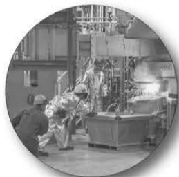
Новое производство на Екатеринбургском заводе по обработке цветных металлов