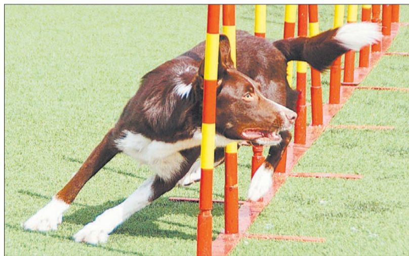
«Змейка» по-собачьи. Каждому питомцу на трассе дается всего одна попытка. Если собака пугает очередность снарядов, то команда снимается с трассы.