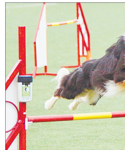
Организация соревнований спорт кинологического спорта: время фотофиниш.