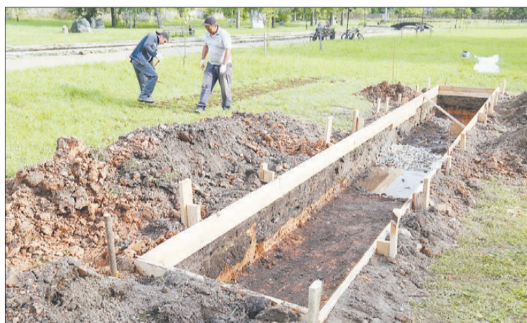
Чтобы посадить будущее «Сейчасстье» в землю, понадобилось вырыть яму и сделать деревянную опалубку