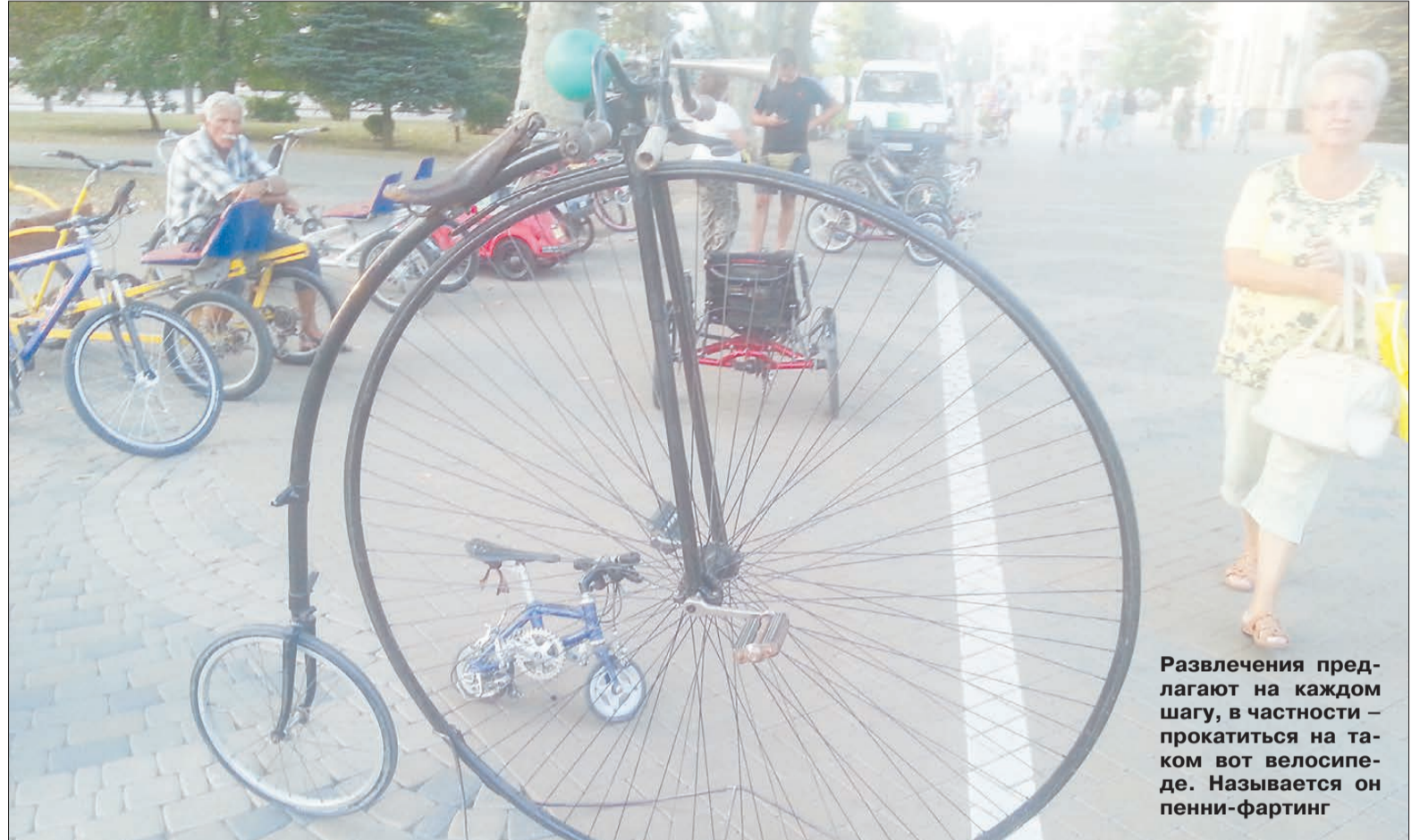
Развлечения предлагают на каждом шагу, в частности — прокатиться на таком вот велосипеде. Называется он пенни-фартинг

Гуляя по новому городу, люблю обращать внимание на забавные названия магазинов или кафе. Вывески бургерной «Краснодарский парень», киоска с фаст-фудом «Вкуснолюб», а также пиццерии «Жар-пицца» достойны того, чтобы достать фотоаппарат. Еще понравился — по соседству со знакомым екатеринбуржцам «Бургер кингом» — бар «Сель-