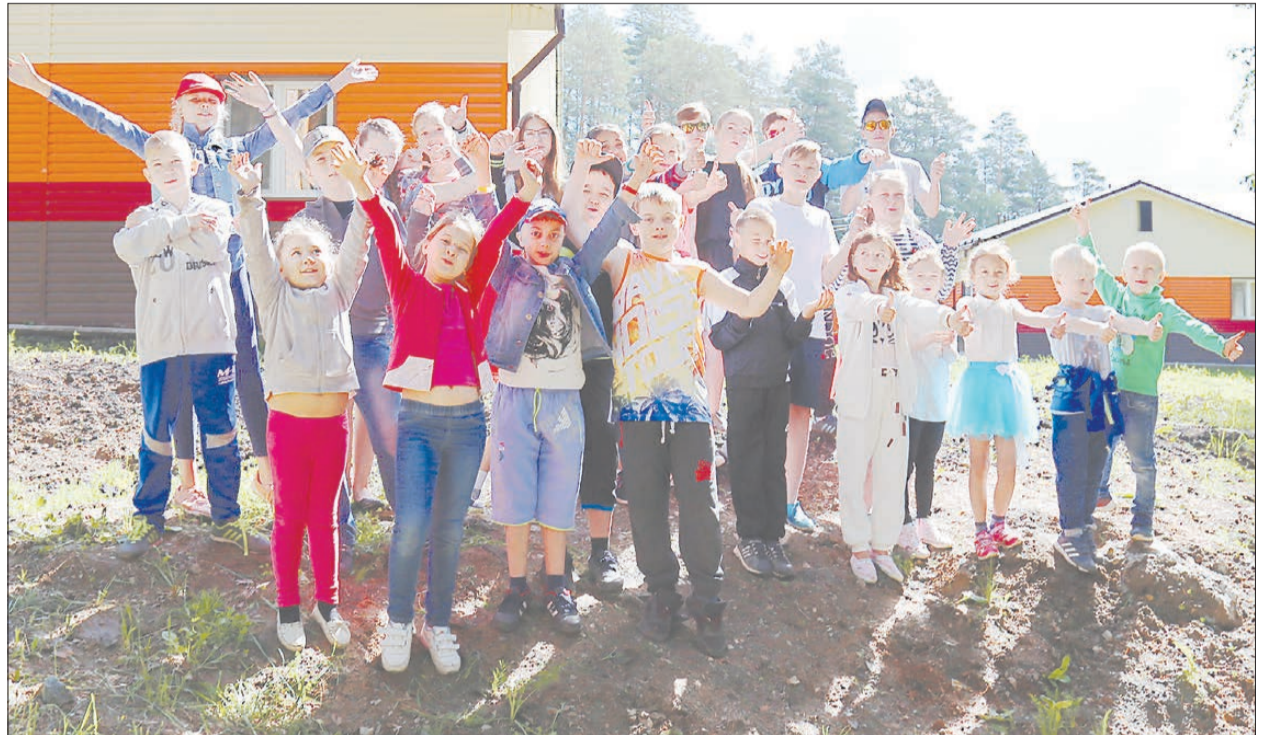
Дети в «Зарнице» учатся, танцуют, занимаются спортом и дружат под пение птиц и шелест деревьев. Преображение лагеря завершилось с ремонтом одноэтажных корпусов (на фото)