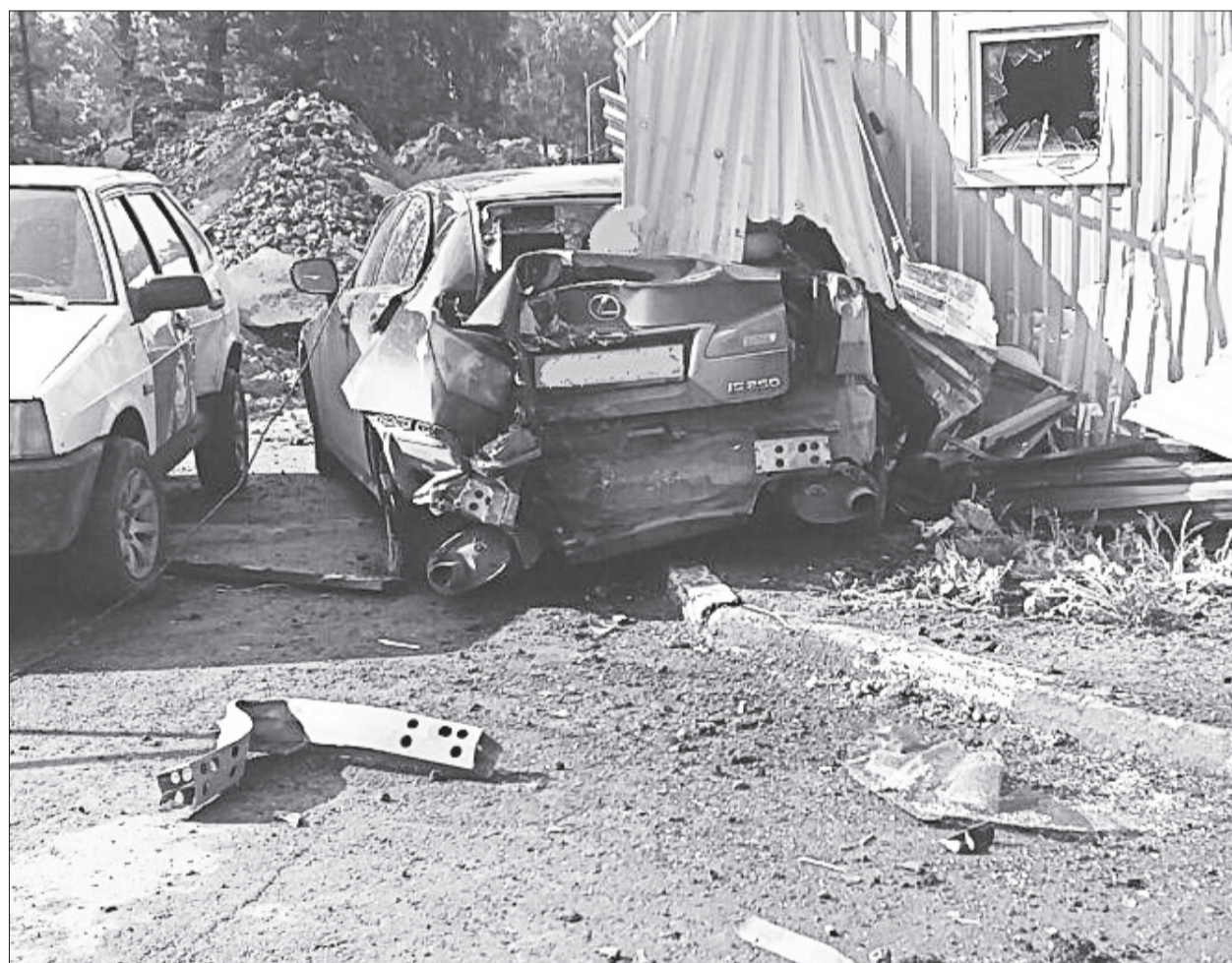
По данным полиции, рулевой иномарки не был в состоянии алкогольного или наркотического опьянения.

Пишите: gorka-info@rambler.ru Звоните по тел. (343) 237-24-60, моб. 8-904-982-33-11 Наш сайт: zg66.ru