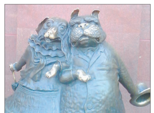
Возле памятника влюбленным собакам редко бывает одиноко: фотографируются с ними любят и дети, и взрослые

дерей» для приверженцев правильного питания. Из социальной рекламы бросается в глаза, и в сердце огромная надпись во всю стену строящегося дома от управления по делам молодежи: «Мама, ты же обещала поиграть со мной!».