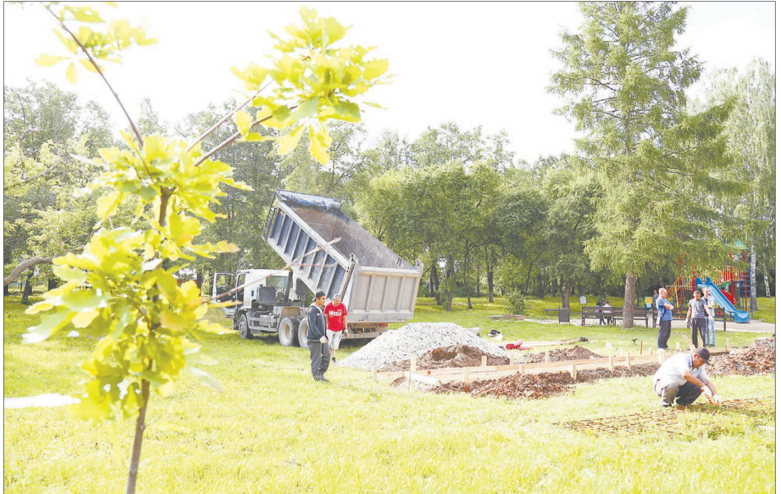
Большинство строительных материалов, необходимых для установки «Сейчасстья», бизнесмены предоставили в качестве материальной поддержки общественного проекта.

Стоимость проекта на начальном этапе согласно смете была определена в 450 тыс. руб. Хотя идейные вдохновители и потратили немало сил на распространение информа-