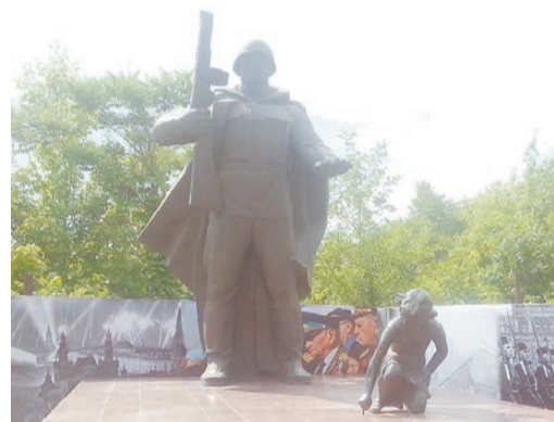
Памятник студентам, преподавателям и сотрудникам Кубанского технологического университета