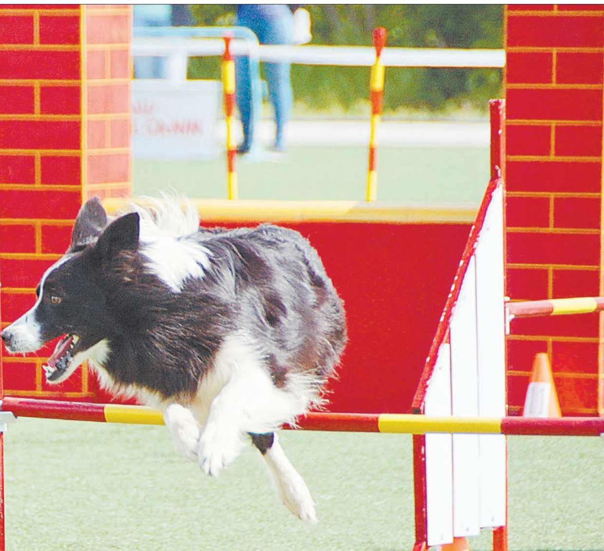
...к управлять собакой, которая видит препятствия впервые.