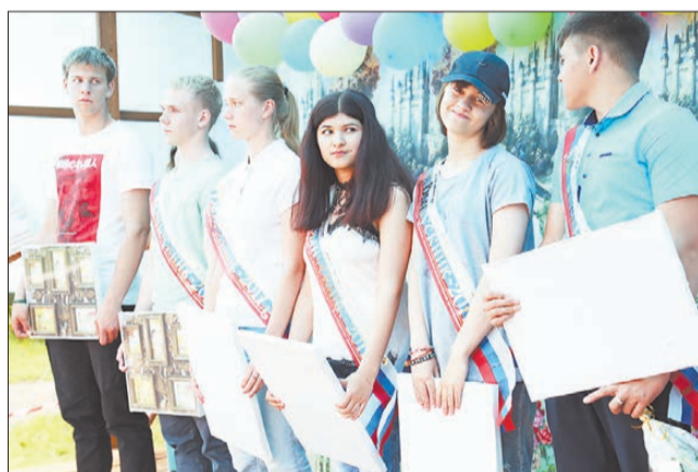
Все семь выпускников школы № 11 планируют учиться дальше, подали документы в вузы и техникумы.