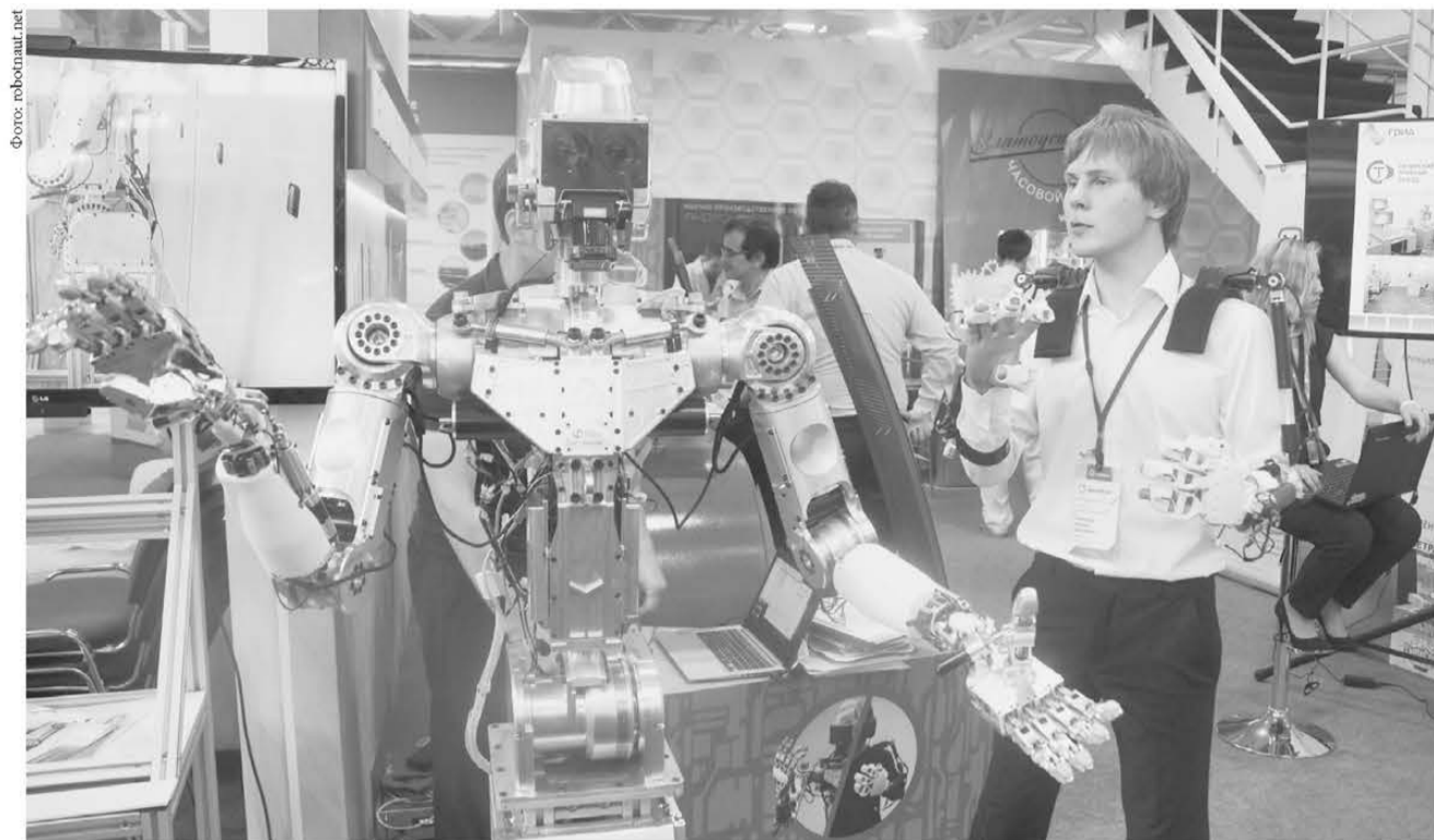
Создание полностью автоматизированного производства — главный тренд современной промышленности.

В этом году на выставку приедет более 400 представителей японской промышленности, бизнеса и власти. В национальной экспозиции будут представлены Toyota, Mitsubishi, Toshiba, Kawasaki Heavy Industries, Marubeni, Sojitz, JGC,