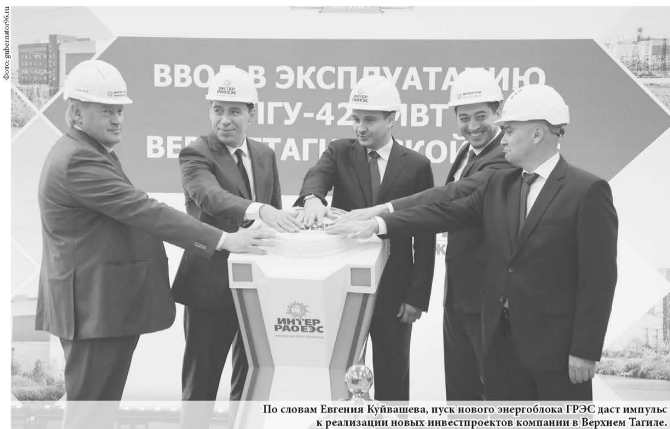
По словам Евгения Куйвашева, пуск нового энергоблока ГРЭС даст импульс к реализации новых инвестпроектов компании в Верхнем Тагиле.

Первые серийные КриоАЗС могут появиться уже в ближайший год и будут установлены в зоне производственной деятельности компании «Газпром трансгаз Екатеринбург».