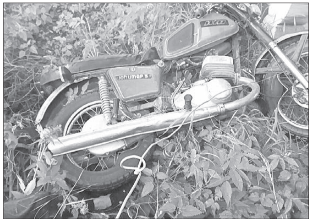
Передвигался ли мотоциклист в пьяном виде станет известно после медэкспертизы

При обыске в коттедже стражи порядка обнаружили около 900 граммов вещества производного метилового эфира, а также самодельное огнестрельное оружие на основе травматического пистолета «Хорхе» и боеприпасы. За покушение на незаконный сбыт наркотиков обвиняемым грозит от 15 до 20 лет лишения свободы, за приобретение и хранение огнестрельного оружия и боеприпасов — до четырех лет.