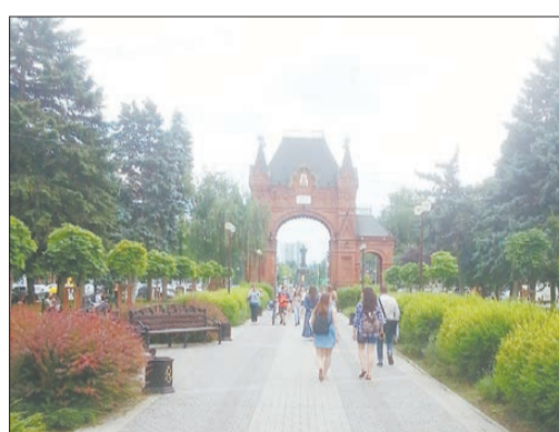
Александровская триумфальная арка названа так потому, что возведена к визиту императора Александра III в 1888 году