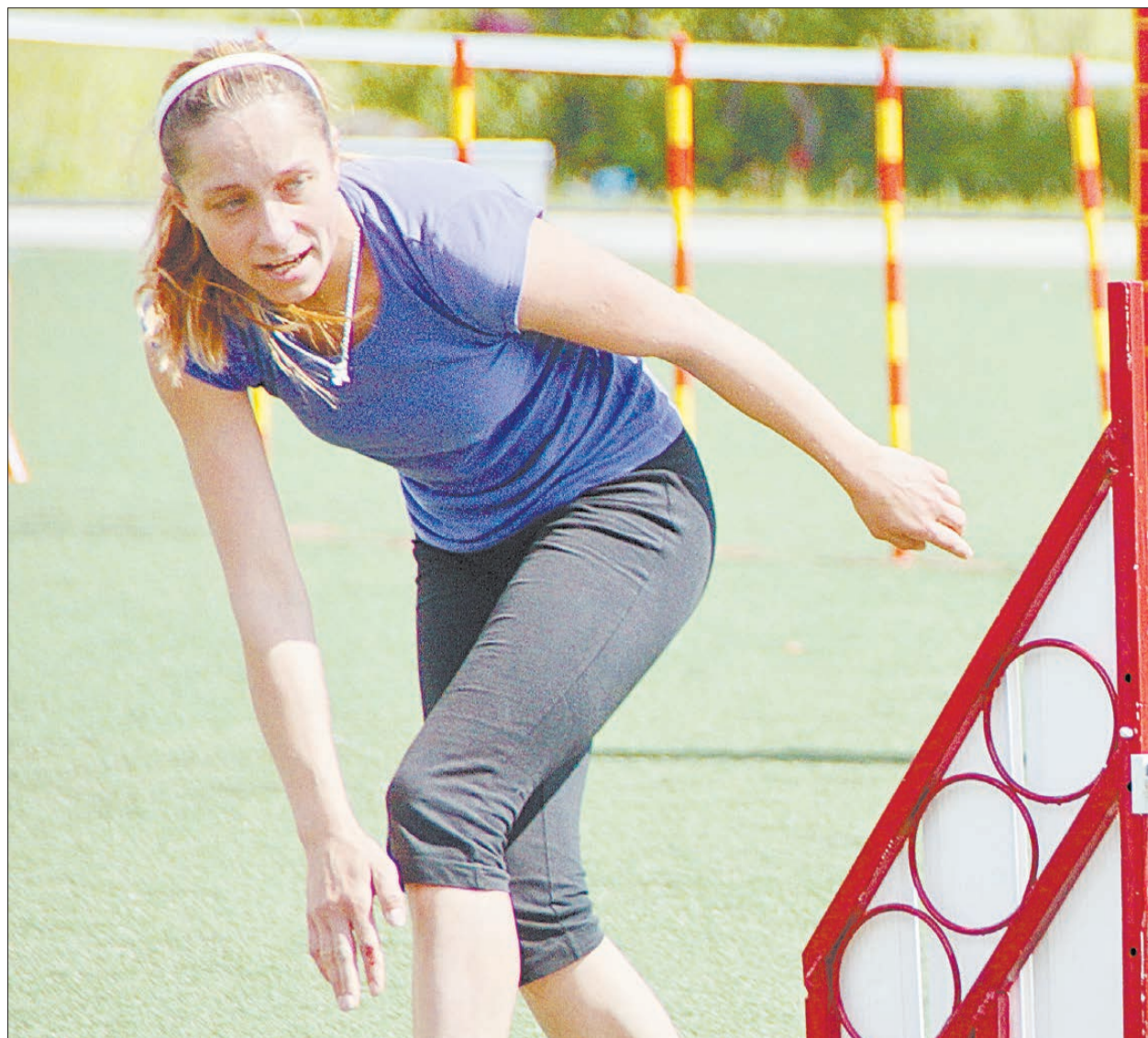
У человека перед началом забега есть несколько минут познакомиться с трассой, чтобы понять, ка

Внимание, в расписании возможны изменения!