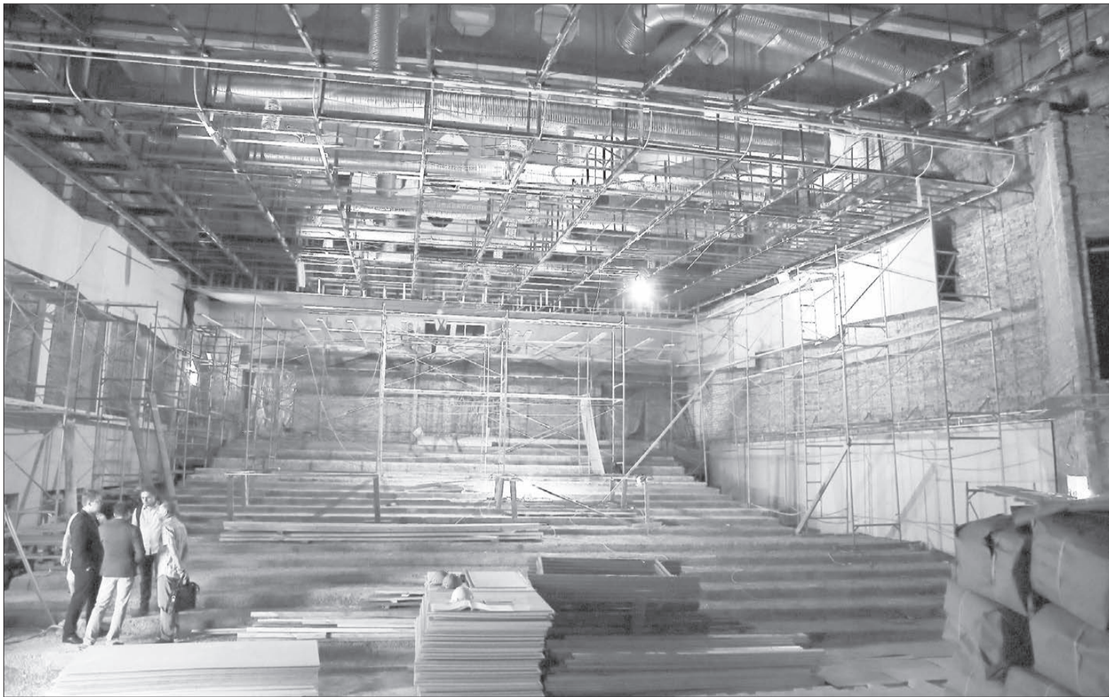
В зрительном зале «Современника», вместимость которого предполагается в 396 мест, стоят леса для монтажа потолка из гипсовых панелей.

Сумма скорректированно после разрыва отношений с предыдущим подрядчиком нового контракта на ремонт составила 4,6 млн руб. Она стала меньше, но заложенный в сметах объем работ строители обе-