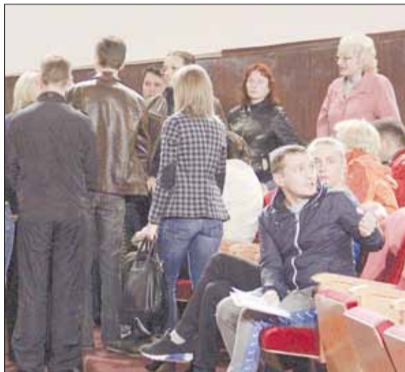
Ни один из домов 19 мая не смог набрать кворум, поэтому собственники отыскивали соседей и обсудили дальнейшие планы