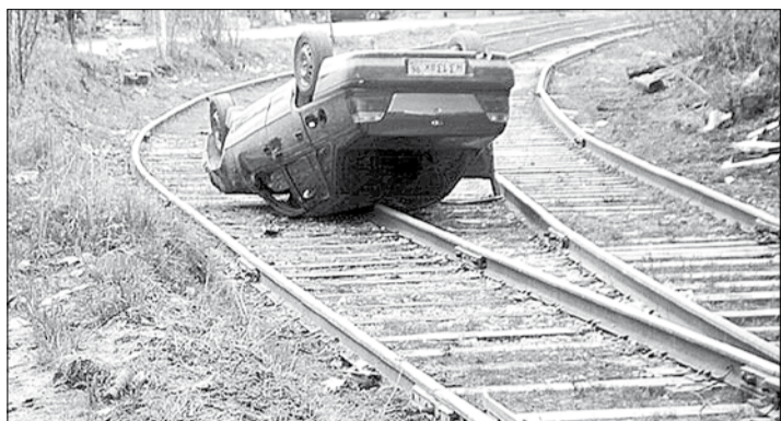
Пилоту «Дэу Нексия» повезло, что в момент аварии по путям не передвигался поезд.

Тел. журналистов: (34369) 4-53-95, 8-904-982-33-11