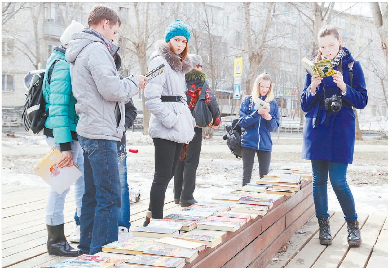
Обменом книг заинтересовались и подростки, и гуляющие с колясками родители, и пенсионеры. Его участниками в общей сложности стали около 50 человек.