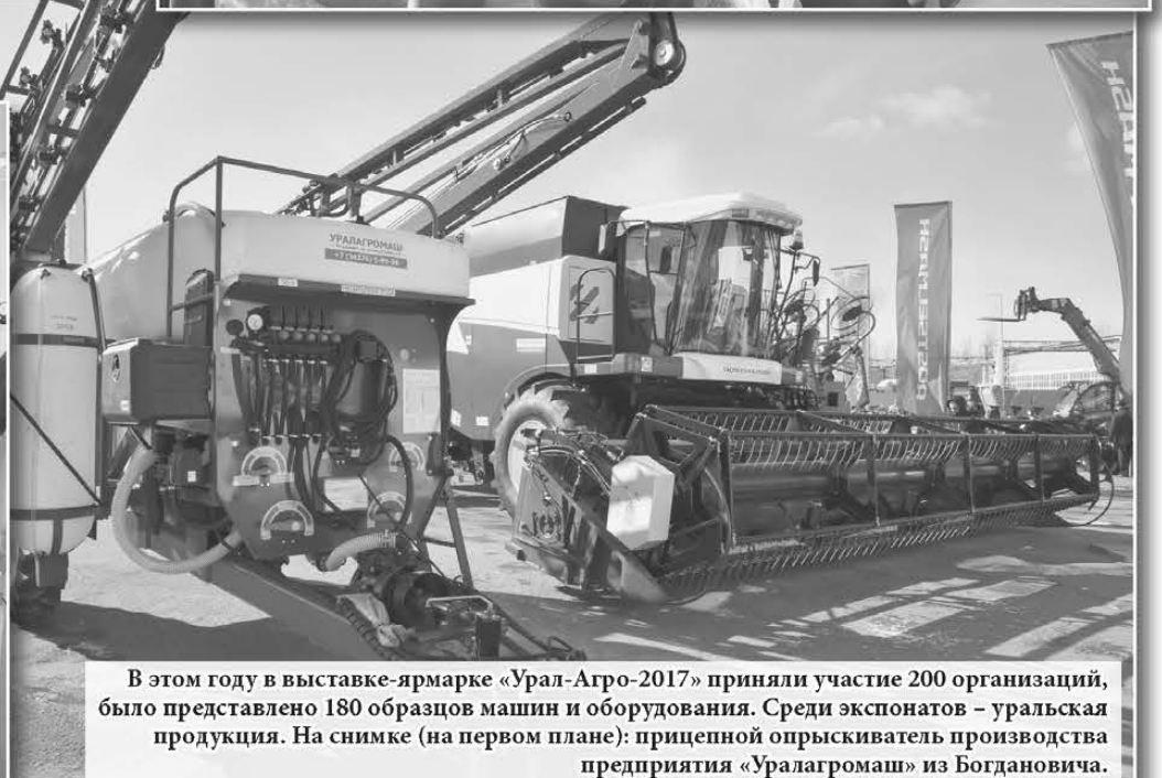
В этом году в выставке-ярмарке «Урал-Агро-2017» приняли участие 200 организаций, было представлено 180 образцов машин и оборудования. Среди экспонатов – уральская продукция. На снимке (на первом плане): прицепной опрыскиватель производства предприятия «Уралагроماش» из Богдановича.