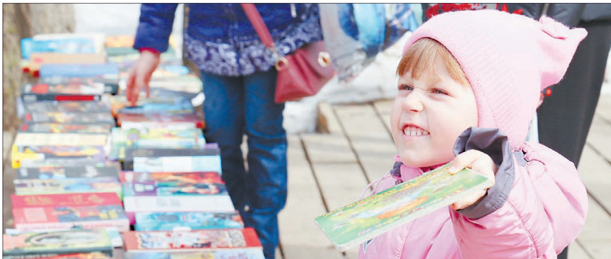
Пока взрослые пытались определить, что взять домой, по содержанию, то малышей, конечно, интересовали яркие картинки.