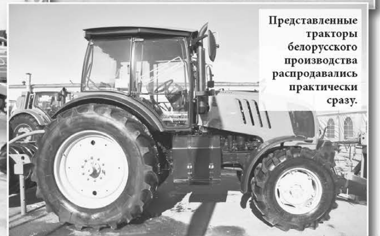
Представленные тракторы белорусского производства распродавались практически сразу.