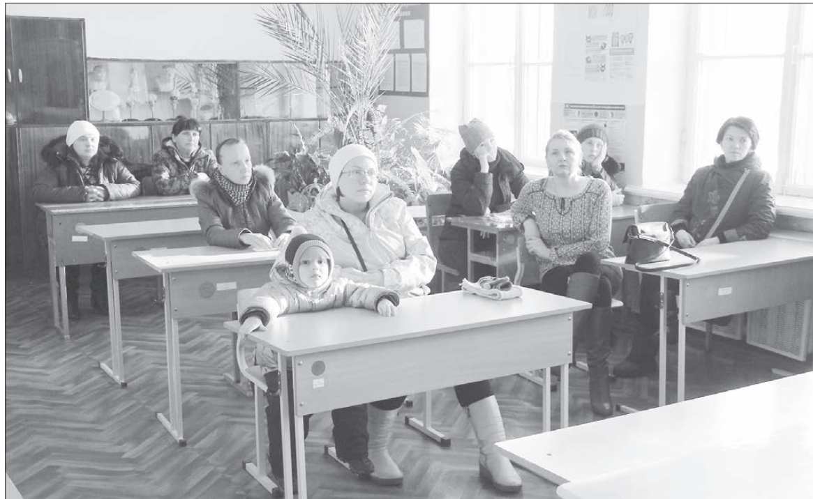
Родители обсудили скандальную ситуацию на собрании.

Учить местных ребят биологии должен никто иной, как Яна Морозова, считает она сама. Полтора года назад специалист пришла работать в сарапуль-