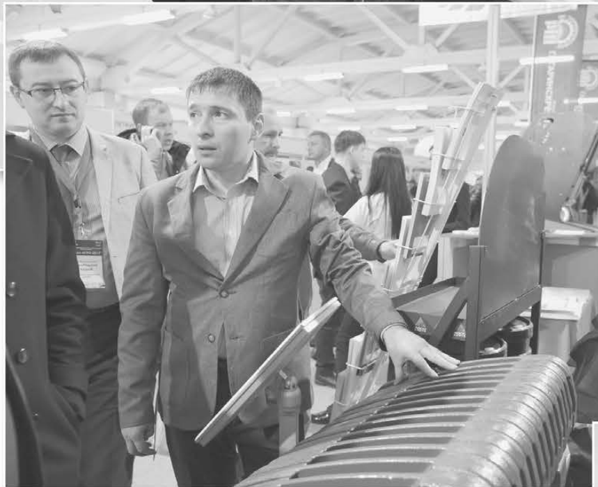
Представитель российской корпорации «Русские машины» знакомит посетителей выставки с новой системой охлаждения трактора MF6713, которая позволяет машине работать практически без перегрева.