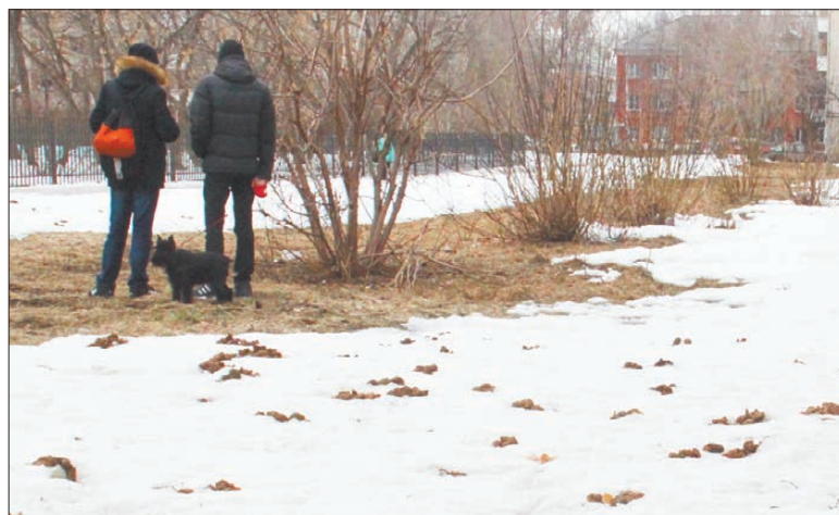
Многие хозяева стараются не ходить с питомцами прямо во дворах или на детских площадках, но пешеходам всё же стоит смотреть себе под ноги.

ну огороженной территории, а вторую отвести под тренировки участников «Клуба», которые дрессируют своих питомцев и готовятся к соревнованиям. Эта часть «Артемона» будет оснащена необходимыми для работы с собакой снарядами.