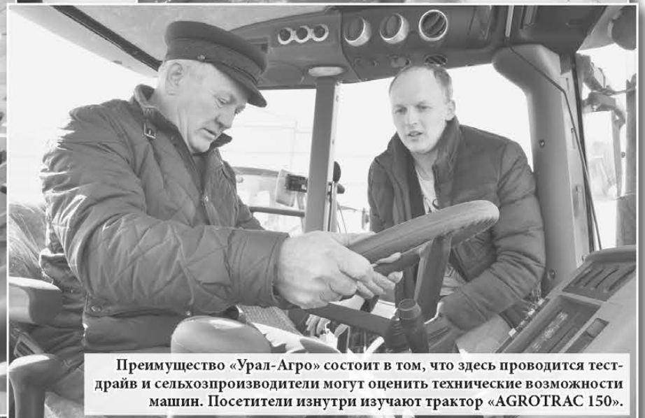
Преимущество «Урал-Агро» состоит в том, что здесь проводится тест-драйв и сельхозпроизводители могут оценить технические возможности машин. Посетители изнутри изучают трактор «AGROTRAC 150».