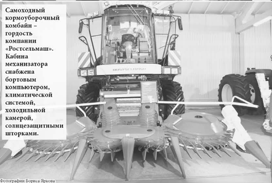
Самоходный кормоуборочный комбайн – гордость компании «Ростсельмаш». Кабина механизатора снабжена бортовым компьютером, климатической системой, холодильной камерой, солнцезащитными шторками.