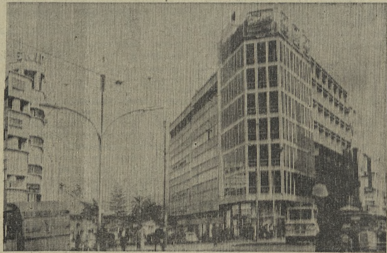
Бейрут. Административное здание в центре города.