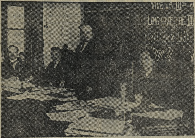
В. И. Ленин в президиуме I конгресса Коммунистического Интернационала. Москва, март 1919 года.

У ИСТОКОВ ЕДИНСТВА МЕЖДУНАРОДНОГО РАБОЧЕГО ДВИЖЕНИЯ