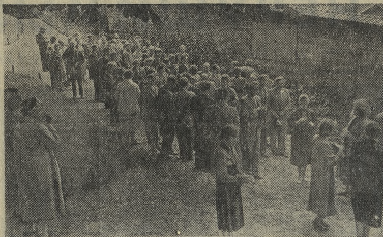
Франция. Париж. У Стены Коммунаров на кладбище Пер-Лашез, где были расстреляны последние защитники Парижской коммуны.

Накануне франко-прусской войны 1870—1871 года, в период июльского кризиса, французские и немецкие члены Интернационала решительно протестовали против военных приговоров, протягивали друг другу руки через границу. 21 июля, на второй день войны на чрезвычайной сессии германского рейхстага рабочие депутаты А. Бебель и В. Либкнехт демонстративно воздержались от голосования за военные кредиты, публично заявив о своей принадлежности к Международному Товариществу. После крушения бонапартистской империи 4 сентября, немецкая социал-демократия, являвшаяся ветвью Интернационала, выступила с требованием почетного мира без аннексий с Французской республикой, отстаивая эту позицию на страницах рабочей печати и на собраниях. Репрессии, обрушившиеся на руководителей партии, не испугали передовых рабочих. Подвергаясь преследованиям, они продолжали борьбу. В это же вре-