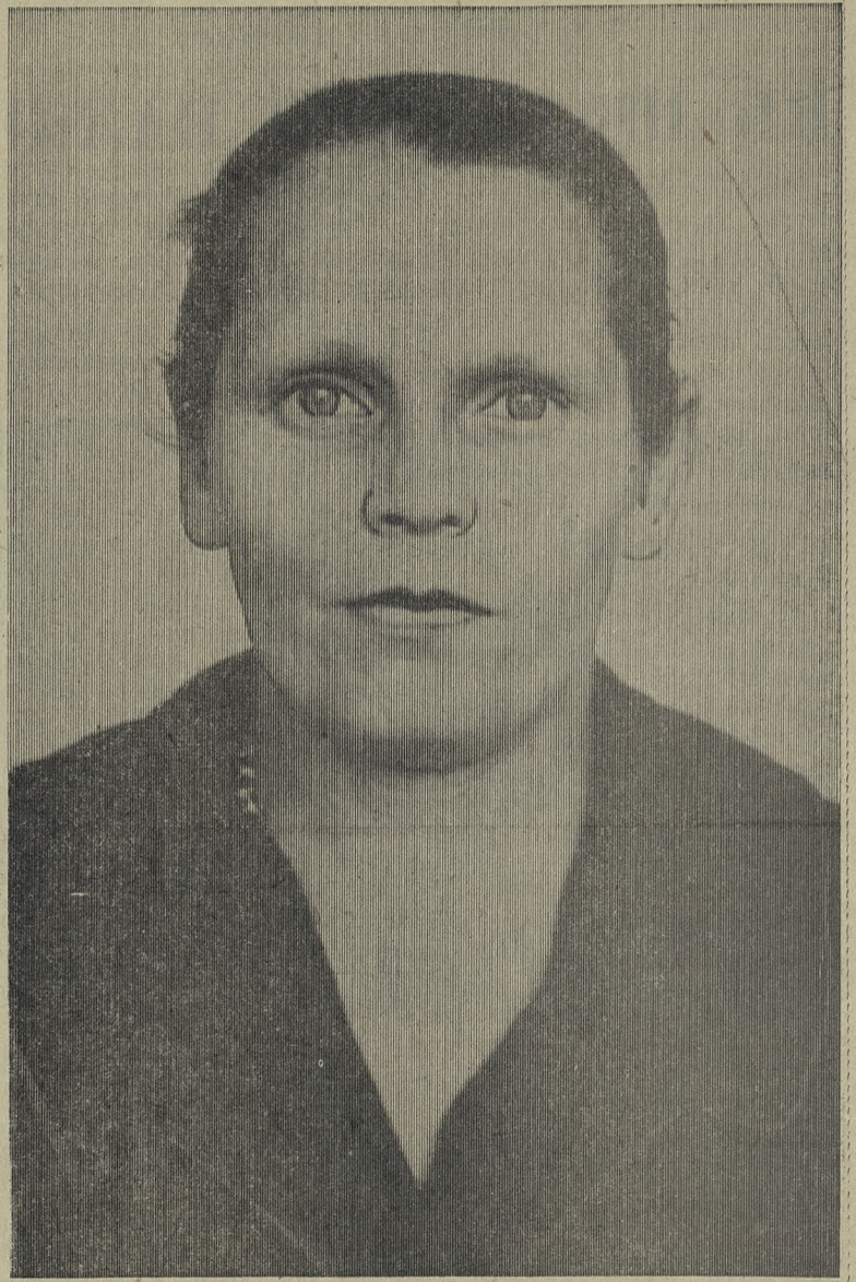
Редактор А. Н. ПОТОРОЧИН.