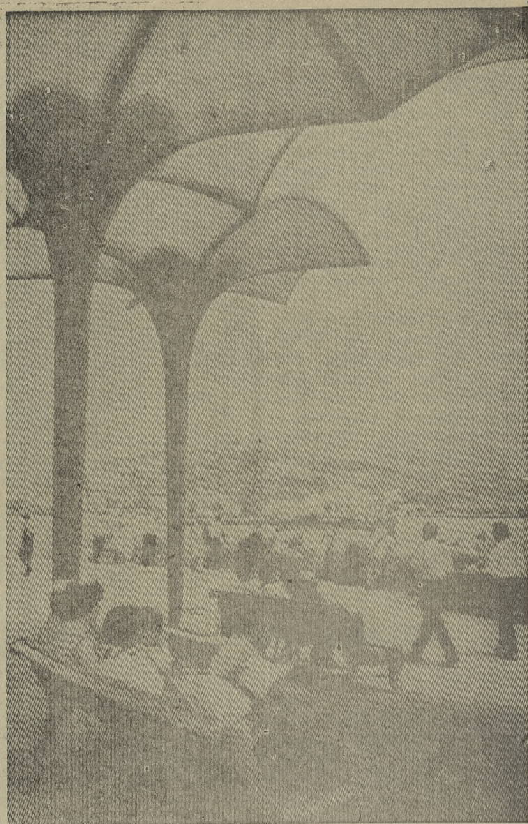
Ялта. «Тихий уголок».