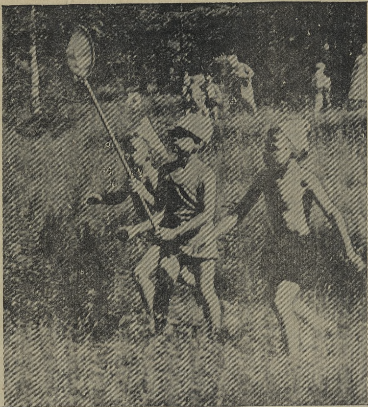
Вышли на охоту.