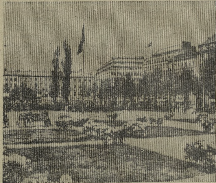
Столица Швеции Стокгольм. Парк в центре города.