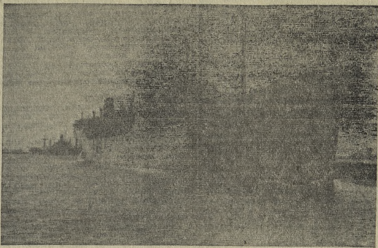
ЦЕЙЛОН. Советский танкер «Гурзуф», доставивший очередную партию нефтепродуктов для Национальной нефтяной корпорации Цейлона. Советский Союз является основным поставщиком корпорации.