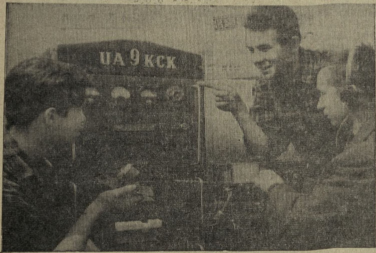
Члены радиоклуба во время работы за коллективной любительской радиостанцией.

* В октябре — декабре 1962 года впервые в истории советскими учеными проведена радиолокация планеты Меркурий и дважды — планеты Венера. За четыре с половиной минуты сигналы прошли общий путь в 85 миллионов 360 тысяч километров. Первыми словами, которые передали телеграфным кодом на Венеру, были слова: «Мир», «Ленин», «СССР».