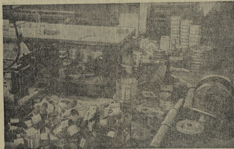
Так хранятся заготовка и готовые детали в механическом цехе СТЗ.