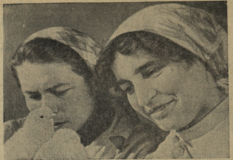
КАМЧАТСКАЯ ОБЛАСТЬ. 400 тысяч цыплят и 140 тысяч утят получают в этом году колхозы и совхозы полуострова из инкубатория Елизовского птицевосхоза. В марте выведены первые 50 тысяч цыплят.

Дел на стройке хоть отбавляй. Несмотря на то, что ре-