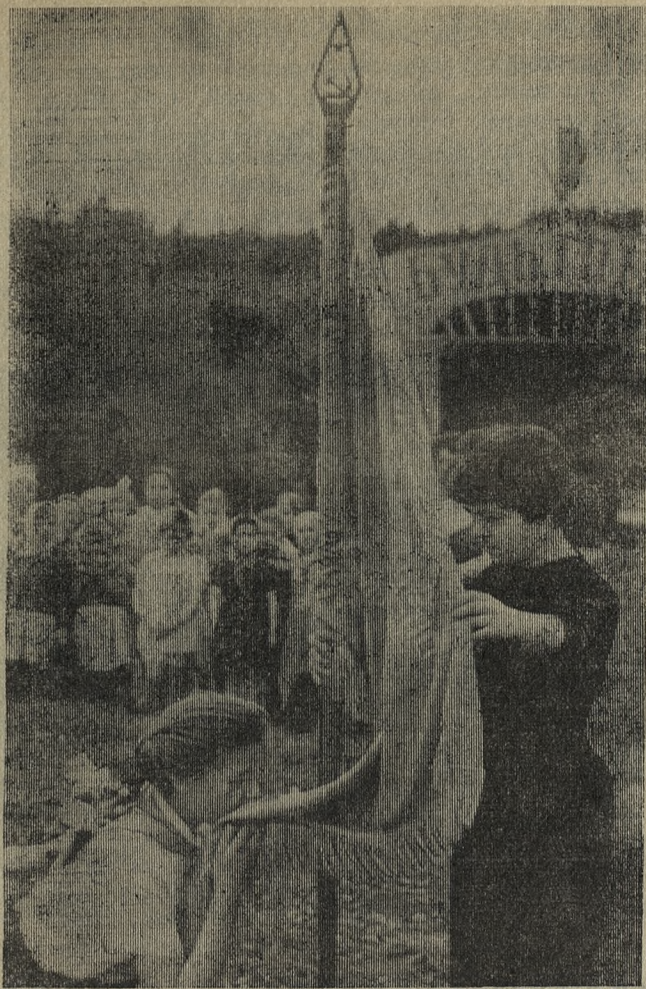
Вручение дружинного знамени пионерам лагеря Старотрубного завода.