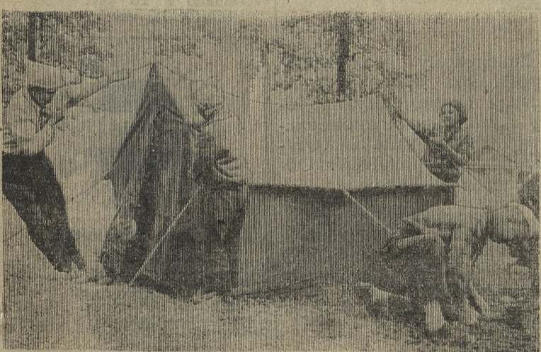
Туристы готовы в поход

...Утро. Под яркими лучами июньского солнца изумрудами переливается на зелени лужайки роса. Тишина. Крепко спят ребята. Но вот на крыльце появляется горнист. И льются требовательные, настойчивые звуки. Пора вставать, пора новый день начинать. Ожил лагерь. Зазвонили во всех уголках детские голоса.