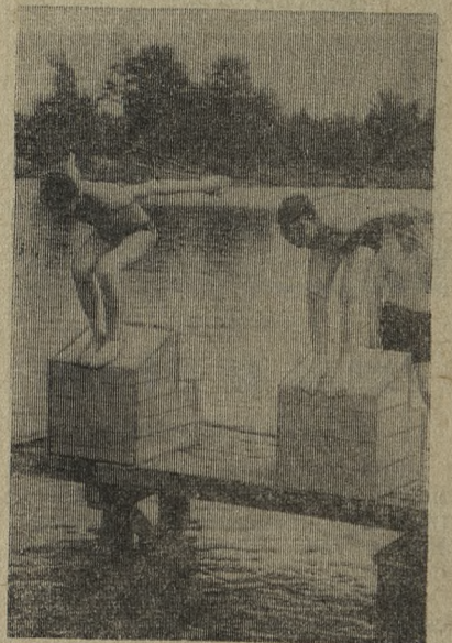
Внимание! Старт!