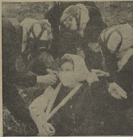
Первое звено санитарной дружины Старотрубного завода во время городских соревнований.