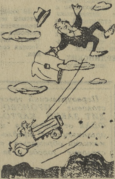
— На наших дорогах я себя чувствую прямо на седьмом небе!..

го дня тяжело, особенно водителю автобуса.