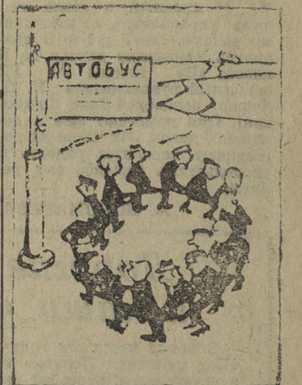
Устроились... Рис. А. ГРУНИНА.