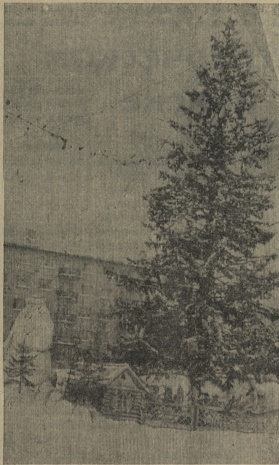
В этом сказочном городке из снега и льда, среди веселых зверушек, возвышается красавица-елка. Вечером она зажигается сотнями разноцветных огней. Сказочный городок — любимое место развлечений ребятшек.

дывали шарady, участвовали в викторине. В комнате сказок, не смотря на большое количество детей, тишина. Слышится голос учителя, читающего русскую сказку. Сюда собрались учащиеся 1—4 классов и для них проведен утренник «Сказка у нас в гостях».