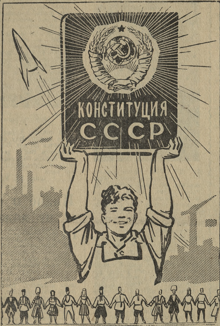
Плакат В. Жаринова.