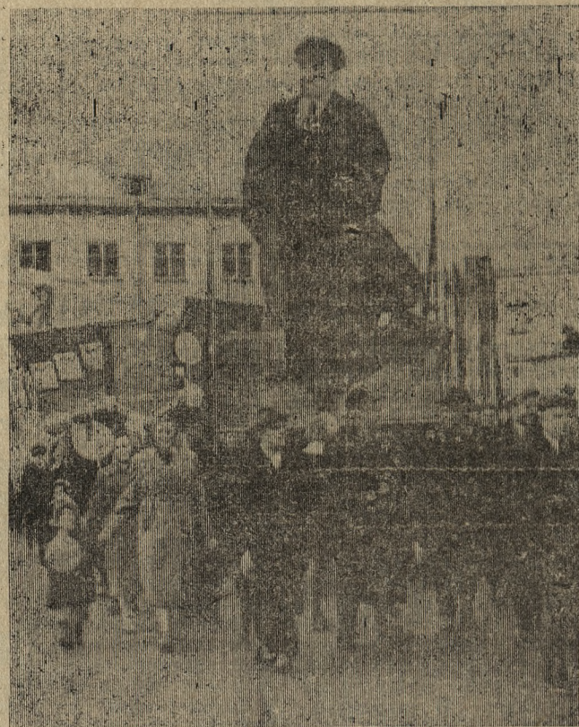
Идет колонна новотрубников.