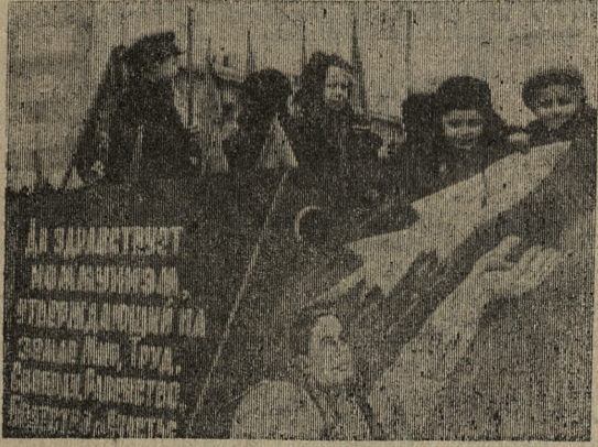
Юные участники демонстрации.