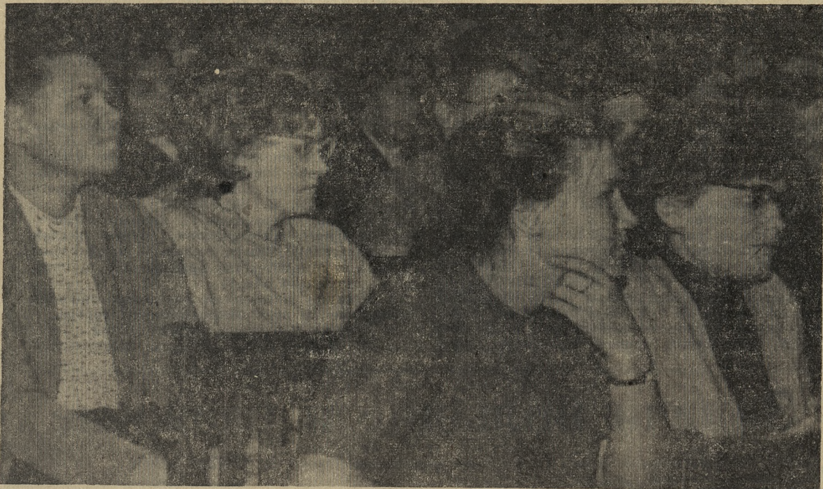
В ЗАЛЕ КОНФЕРЕНЦИИ