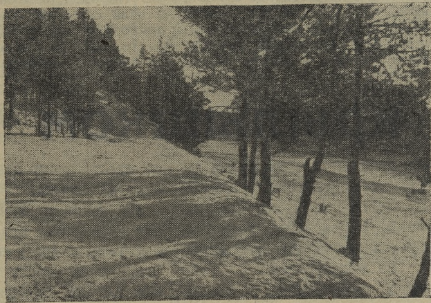
Снег, сосны, солнце.

И вот ровно в 12 часов, вдали от больших селений, в маленькой лесной избушке раздался глухой звон наших походных кружек.