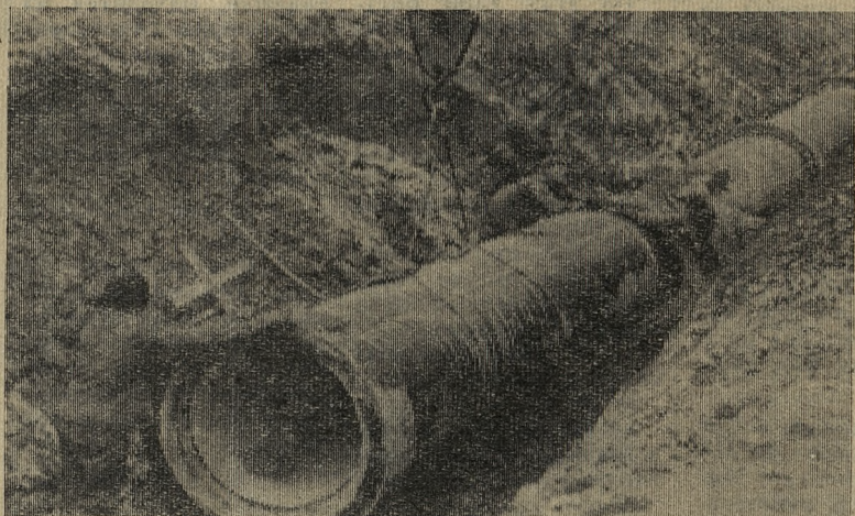
Укладка канализационных труб работниками «Уралспецстрой» на строительстве стана «102».