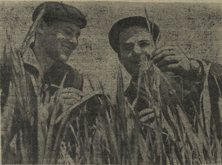
РУМЫНСКАЯ НАРОДНАЯ РЕСПУБЛИКА. Благодаря непрерывно оснащению сельского хозяйства современной техникой в стране растет производство зерновых и других сельскохозяйственных культур.

В Белграде открылась сессия Союза народной скупщины Югославии. Сессия обсуждает ряд вопросов, касающихся внутренних, экономической и торговой политики.