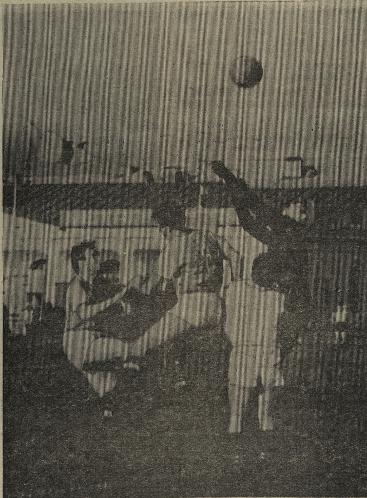
Острый момент у ворот хромпиковцев.